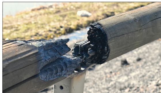
Pożar mógł wywołać znacznie większe straty, na szczęście szybko interweniowały nasze straże pożarne

Choć niektórzy myślą, że wypalanie traw jest naturalnym sposobem na „oczyszczenie” terenu, rzeczywistość jest zupełnie inna. Pożary traw wywołane przez człowieka mogą szybko wymknąć się spod kontroli, prowadząc do niszczenia lokalnej flory i fauny, a także do zagrożeń dla ludzi i ich mienia. Oto główne skutki wypalania traw: 1) Zagrożenie dla środowiska – W wyniku pożaru ginie wiele drobnych organizmów, roślin i zwierząt. Ponadto wypalanie traw degraduje glebę, prowadząc do jej jałowienia, co wpływa negatywnie na bioróżnorodność terenu. 2) Zagrożenie dla ludzi i ich mienia – Pożary traw szybko się rozprzestrzeniają, szczególnie w suchych i wietrznych warunkach. Często dochodzi do sytuacji, w których ogień przenosi się na pobliskie domy, lasy i pola uprawne, stanowiąc zagrożenie dla mieszkańców i strażaków. 3) Wzrost ryzyka pożarów lasów – Pożary traw są jednym z głównych czynników prowadzących do pożarów lasów, które