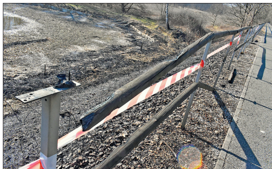
Spaleniu lub nadpaleniu uległo 48 barierek

Kampania „Stop Pożarom Traw” ma na celu edukowanie społeczeństwa oraz przeciwdziałanie powszechnemu wypalaniu nieużytków. Jej główne założenia obejmują: 1) Zwiększanie świadomości społecznej – Uświadamianie, że wypalanie traw jest niebezpieczne, nielegalne i nie przynosi korzyści dla gleby czy rolnictwa. 2) Edukację dzieci i młodzieży – Kampania realizuje programy edukacyjne w szkołach, ucząc najmłodszych odpowiedzialności