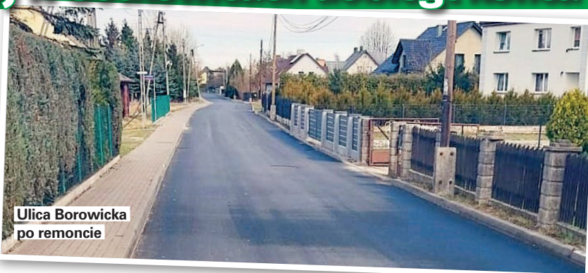
Ulica Borowicka po remoncie

Realizacja zadania kosztowała 407 113,25 zł. Z tego gmina pozyskała kwotę 203 556,62 zł z Rządowego Funduszu Rozwoju Dróg. (a)