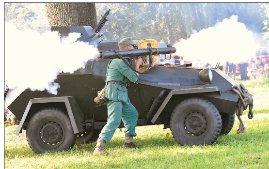
Widowiskowa rekonstrukcja Bitwy pod Studziankami