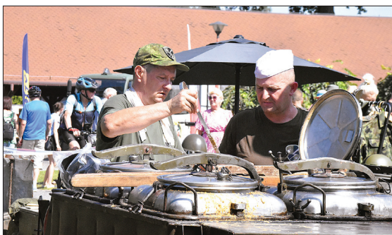
Dużym zainteresowaniem cieszyły się dania z kuchni polowej

Plenerowi poświęconemu serialowi, którego jednym z bohaterów był pies Szarik, musiały towarzyszyć również psie akcenty. Najpierw funkcjonariusz Straży