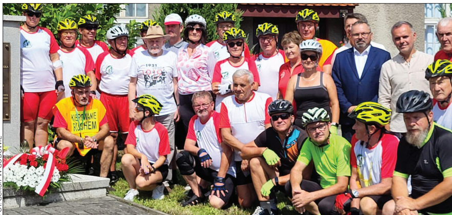
Towarzyszący uroczystości Rajd Kolarski został zorganizowany pod honorowym patronatem Konsulatu Generalnego RP w Ostrawie

17 sierpnia wspominaliśmy 105. rocznicę wybuchu I powstania śląskiego. Z tej okazji w Godowie odbyła się niewielka uroczystość przy dawnym dworcu PKP.