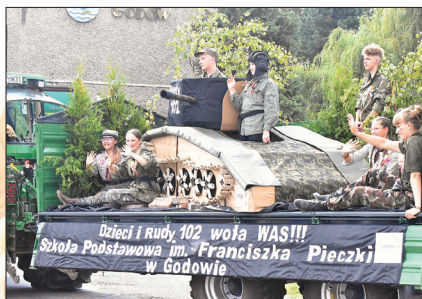
Wóz przygotowany przez SP Godów