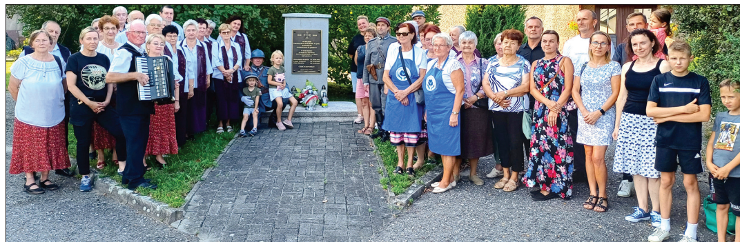
Pamiątkowe zdjęcie uczestników spotkania