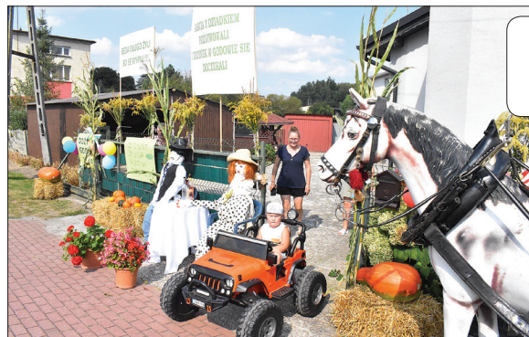
Pięknie udekorowana posesja przy ul. Powstańców Śl.