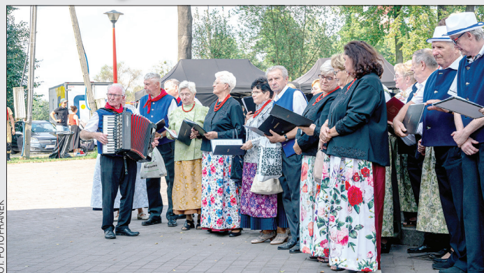
Dożynki Gminne w Godowie, rok 2024