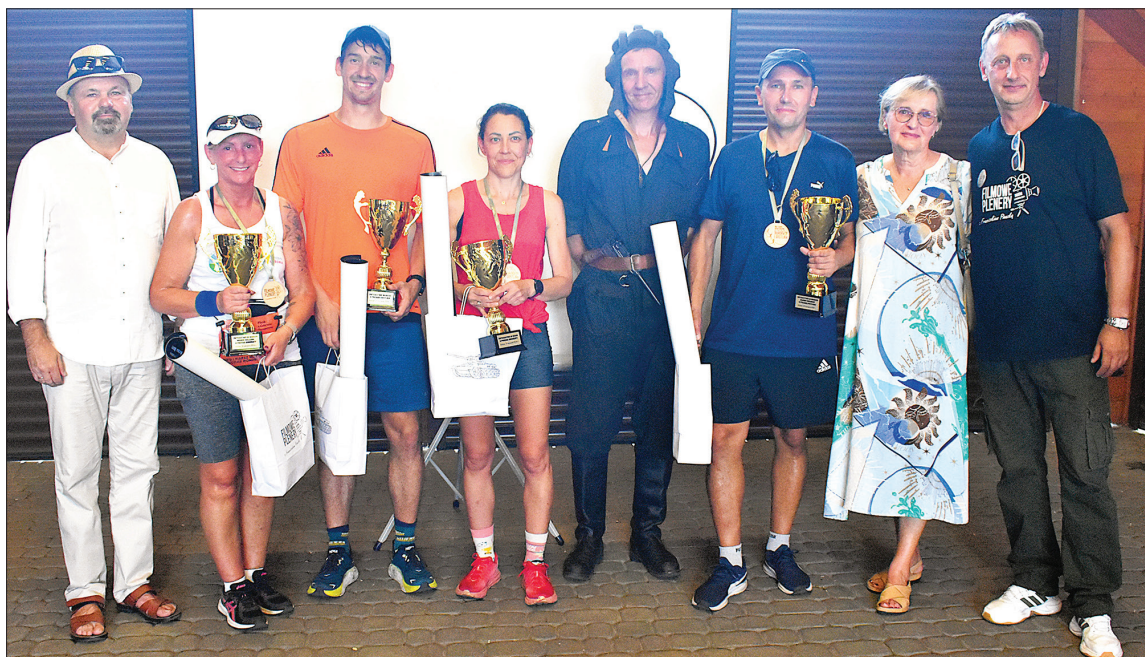
Zwycięzcy biegów i marszów NW na pamiątkowym zdjęciu m.in. z rodziną aktora

Wszyscy czekali jednak na dynamiczne pokazy. Kilkudziesięciu rekonstruktorów z Grup Rekonstrukcji Historycznej odtworzyło Bitwę pod Studziankami, której poświęcone są odcinki 3-5 serialu "Czterej pancerni i pies". Rekonstrukcja bitwy okazała się wspaniałym i efektownym widowiskiem historycznym, za co rekonstruktorom, dźwigającym na sobie – w ponad 30-stopniowym