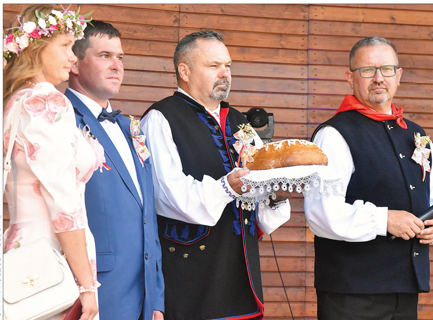
W GODOWIE

W konkursie na najlepiej przygotowany wóz,