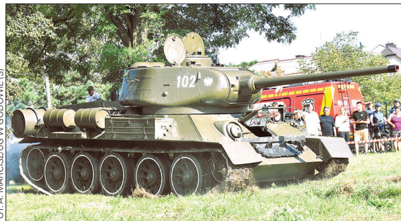
Niekwestionowaną gwiazdą Pikniku był czołg T34/85 o numerze bocznym 102. Takim, jak Rudy.