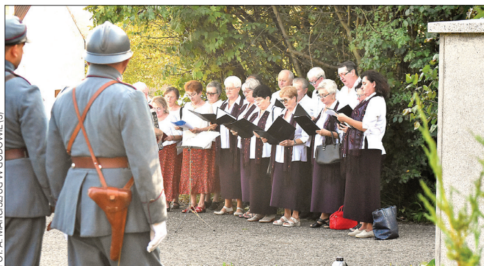
O muzyczną oprawę spotkania zadbał chór Melodia ze Skrbeńska oraz zespół Ballada z Godowa