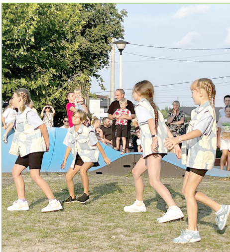
Występ grupy tanecznej zespołu RYTMIX

Placówka Banku Spółdzielczego przy Urzędzie Gminy w Godowie ponownie czynna