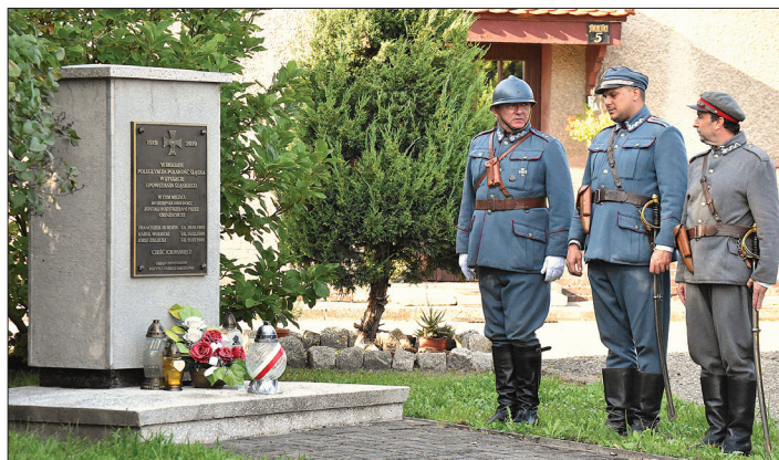
Wartę honorową przy pomniku wystawili członkowie GRH Powstaniec Śląski