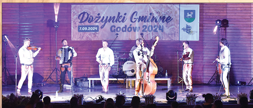
Występ zespołu Pogwizdani

która porwała tłumy do zabawy był zespół folkowy Pogwizdani. Wieczór zwińczyła zabawa tańeczna, podczas której pod sceną bawiło się bardzo wielu uczestników dożynek.