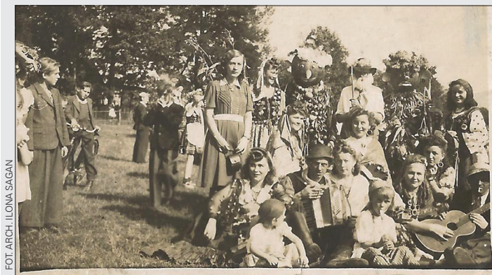
Dożynki w Godowie, rok 1947