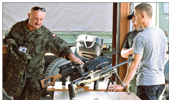
Jedno ze stanowisk przygotowane zostało przez 13 Śląską Brygadę Obrony Terytorialnej

niez wystawę pamiątek poświęconych serialowi, którego znaczną część nakręcono właśnie na poligonie w Żaganiu. (a)