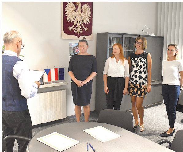
Ślubowanie nauczycieli mianowanych