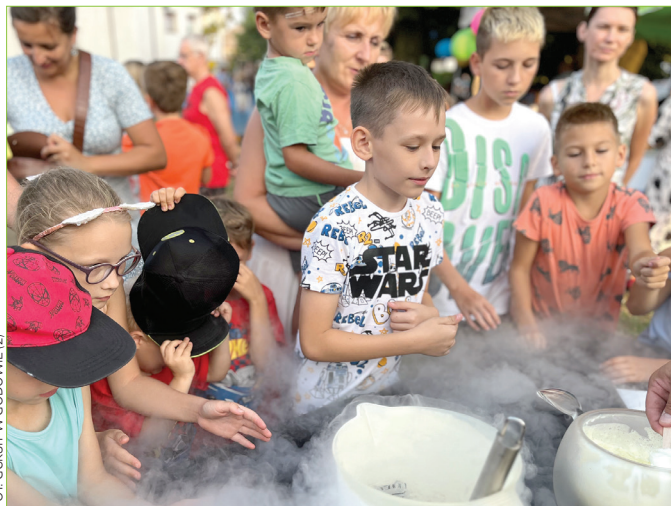
FOT. GOKIST W GODOWIE (2)