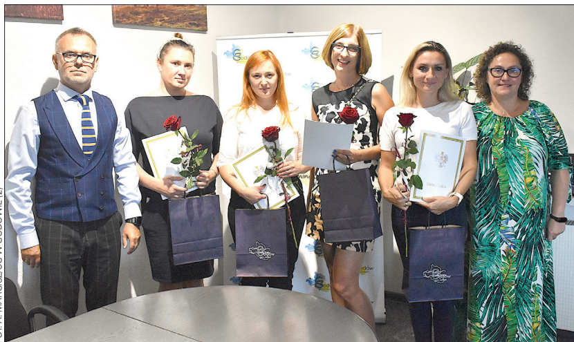
W GODOWIE (2)