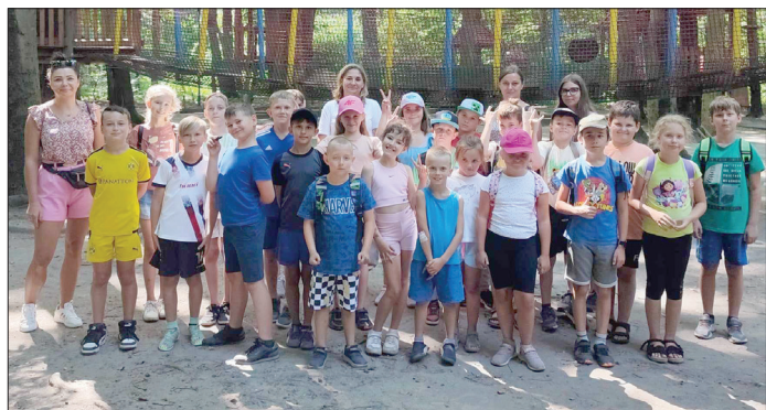
Park linowy "Leśna przygoda" w Radlinie był dla dzieci nie lada atrakcją

Podczas tegorocznych wakacji w Świetlicy Profilaktyczno-Wychowawczej w Krostoszowicach oraz jej filii w Łaziskach nie sposób było się nudzić. Na wychowanków naszych placówek czekało wiele atrakcji.