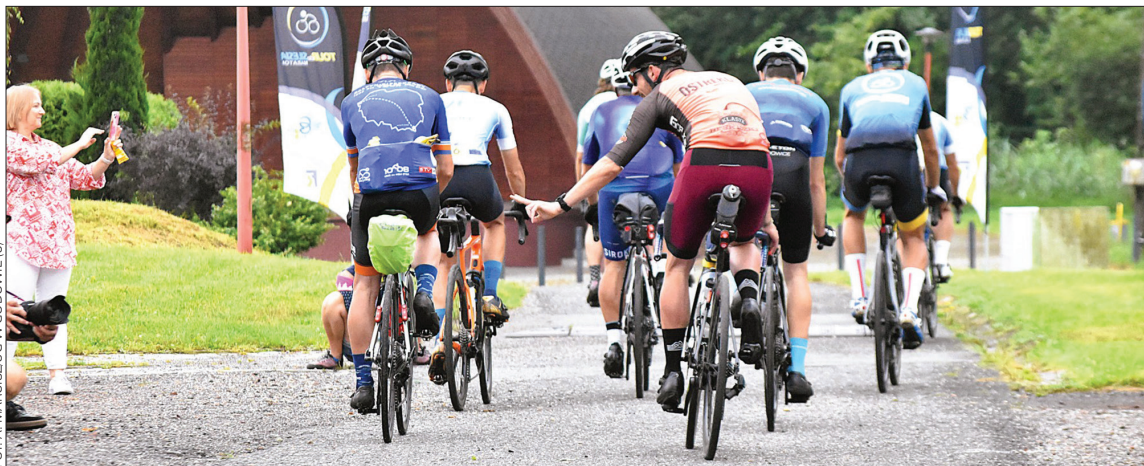
FOT. A. MARCZUK W GODOWIE (3)

W sobotę baza maratonu zaczęła tętnić życiem już przed godziną 6.00. Z minuty na minutę parking zaczął zapełniać się samochodami zawodników, którzy meldowali się w biurze zawodów po od-