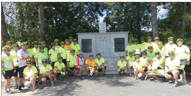
11.08.2024 r. Rajd rowerowy "Łączy nas powstańcza historia i aktywny tryb życia" zorganizowany przez Stowarzyszenie "Aktywna Olza"