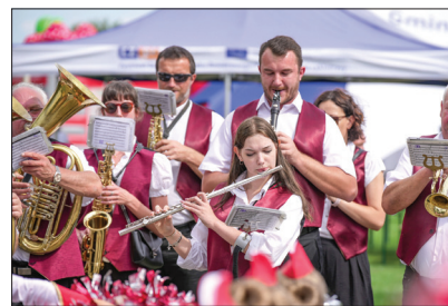
Gminna Orkiestra Dęta z Gołkowic