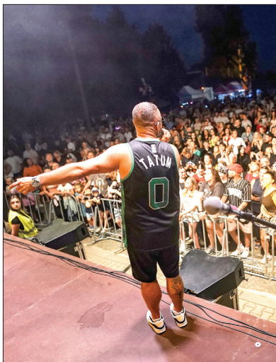
Koncert zespołu Tabu