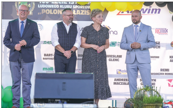
W jubileuszu wzięli udział przedstawiciele Gminy Godów