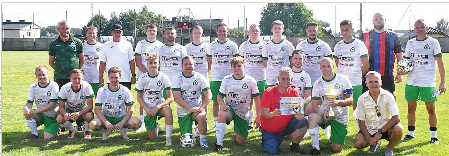
Puchar Wójta Gminy Godów w piłce nożnej wrócił do Skrzyszowa