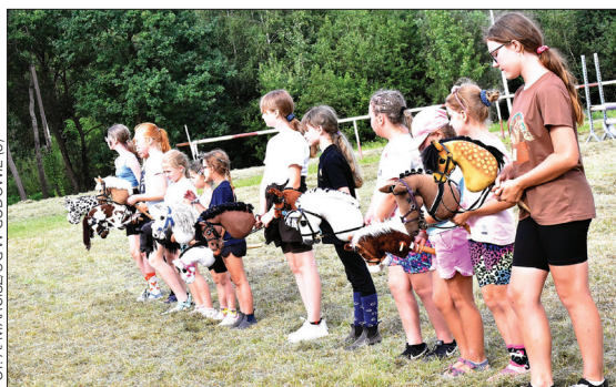
FOT. A. MARCISZUK W GODOWIE (3)