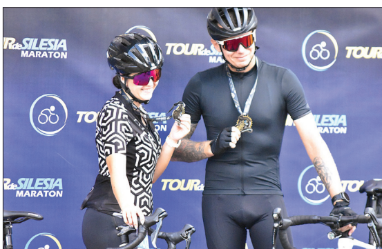
Każdy uczestnik zmagania, który dojechał na metę otrzymał spersonalizowany pamiątkowy medal

O godzinie 8.30 na trasę ruszyła pierwsza grupa zawodników dystansu TdS Mini 300km. Pierwsza połowa trasy tzw. trzysetki wiodła dokładnie tak samo jak pięćsetki. Do rozjazdu doszło za Szczyrkiem, gdzie uczestnicy TdS Mini odbili na Czernichów. Czechowice Dziedzice, Jastrzębie Zdrój, dzięki czemu do-