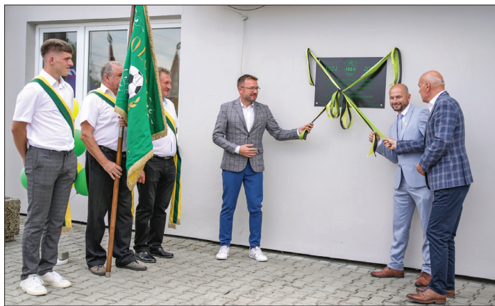
Odsłonięcie pamiątkowej tablicy