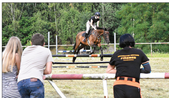
Jak co roku nie brakowało emocji

Ponadto dla najmłodszych organizatorzy przygotowali zawody Hobby Horse, czyli z wykorzystaniem koników na kiju, które są coraz popularniejsze wśród dzieci.