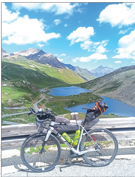
FOT. P. PIECZKA (2)

Zawodnicy pokonywali ten dystans wyznaczoną przez siebie trasą z tym, że każdy