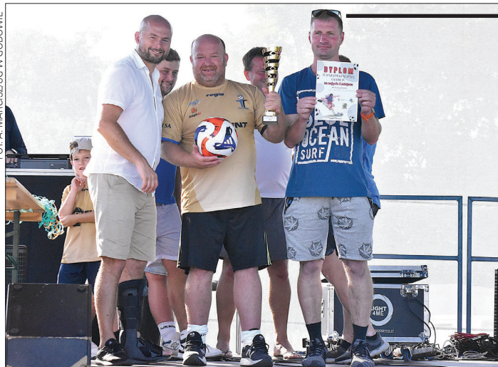
W turnieju tryumfowała drużyna Poltent Interu Krostoszowice