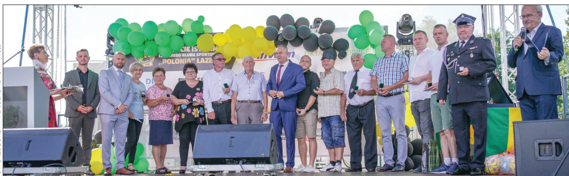
Podczas części oficjalnej wręczone zostały odznaczenia m.in. dla zasłużonych działaczy