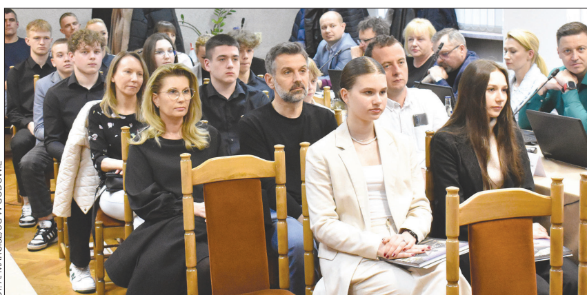
Stypendia zostały przyznane podczas marcowej sesji Rady Gminy w Godowie