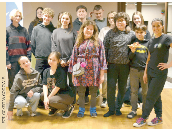
FOT. GOKSIT W GODOWIE

W tym roku działający przy Ośrodku Kultury w Gołkowicach Teatr Naszej Wyobraźni świętował go nietypowo - pod okiem Dominiki Brzozy-Piprek młodzi aktorzy z gminy Godów nocowali w Ośrodku Kultury w Skrbeńsku.