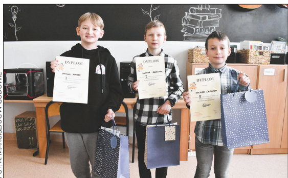
Laureaci w kategorii klas 4.