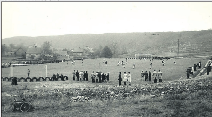
Otwarcie boiska w Krostoszowicach, ok. roku 1974