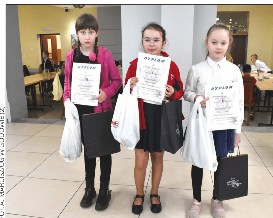
Laureaci w kategorii uczniów młodszych