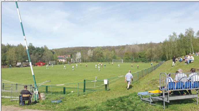
Mecz Interu z „Gwiazdą” Skrzyszów w Krostoszowicach. 7.04.2024 r.