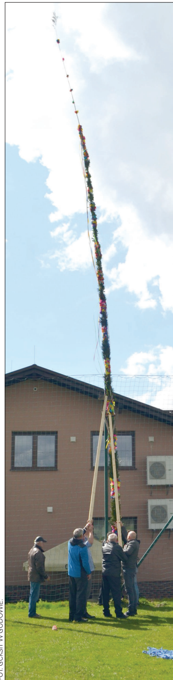
Najwyższa palma miała ponad 17 m wysokości