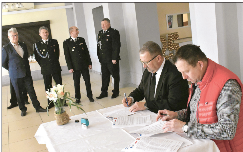
Umowa została podpisana w remizie OSP Łaziska

Całość zadania pochłonie 3 623 878 zł. Gmina pozyskała na ten cel 2 450 000 zł z Programu Rządowego Fundusz Polski Ład: Program Inwestycji Strategicznych. Reszta zadania pokryta zostanie ze środków budżetu gminy. Zakres prac obejmuje budowę budynku zaspokajającego potrzeby szatniowe, higieniczno-sanitarne oraz gospodarce Ochotniczej Straży Pożarnej