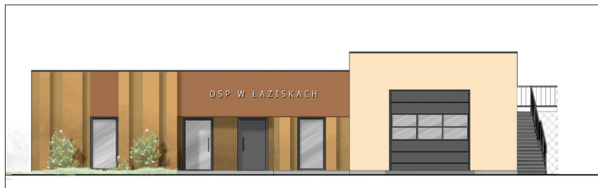
Wizualizacji dobudowanej części remizy