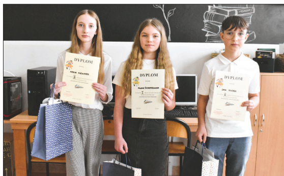
Laureaci konkursu w kategorii klas 5.