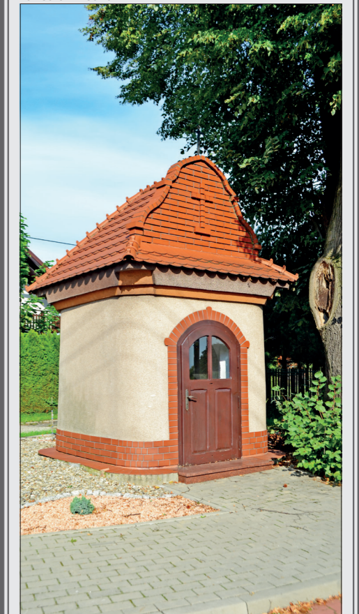
Kapliczka na skrzyżowaniu ul. Cmentarnej i Sobieskiego w Gołkowicach. 2022 r.