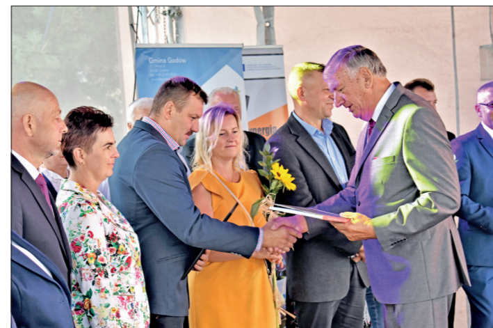
Podziękowania dla rolników