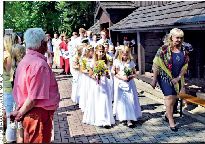
Jubileusz był wielkim wydarzeniem dla społeczności Łazisk

Kościół w Łaziskach jest jedną z trzech zabytkowych świątyni znajdujących się na terenie gminy Godów. Wpisany został do rejestru zabytków. Tylko od 2010 r. Gmina przeznaczyła 237 tys. zł na remonty w kościele. Dzięki tym funduszom udało się wyremontować m.in. zakrystię i schody, oraz wykonać drzwi zewnętrzne do zakrystii oraz drzwi boczne. We wcześniejszych latach Gmina również dotowała remonty w kościele. (a)