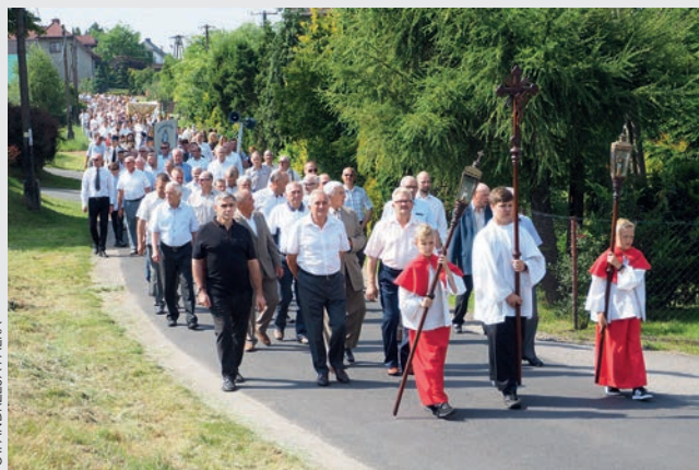
Boże Ciało, Skrzyszów rok 2022 r.