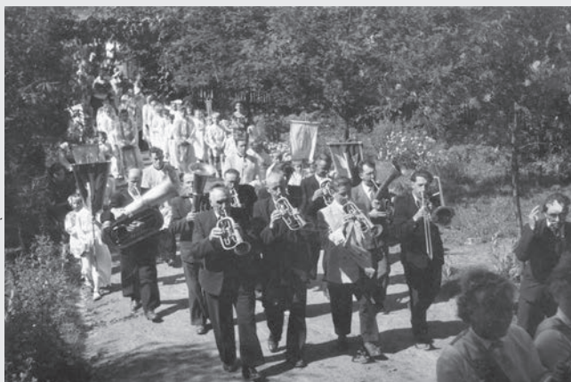
Boże Ciało, Łaziska lata 1950 – 1960