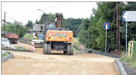
Ul. Żabkowska w Gołkowicach

połączenia ul. Szybowej z Olszyńską w Krostoszowicach. Wartość umowy wynosi 1.464.991,50 zł. Termin realizacji mija 16 sierpnia przyszłego roku. (a)