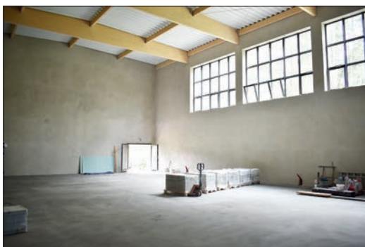
W sali gimnastycznej w Skrbeńsku trwają obecnie prace wykończeniowe (stan na zdjęciu z 1 sierpnia)