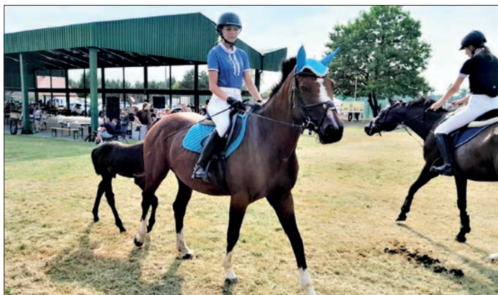
Każdy mógł spróbować grochówki z polowej kuchni wojskowej