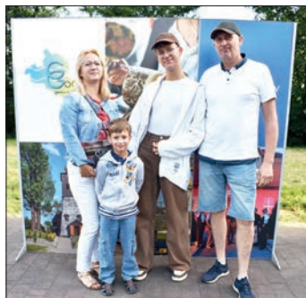
W bezinteresowną pomoc angażowały się często całe rodziny

Wydarzenie miało szczególnie charakter ze względu na toczącą się za wschodnią granicą naszego kraju wojnę, będącą efektem napaści Rosji na Ukrainę. Skutkiem tego od 24 lutego do Polski zaczęły przybywać miliony uchodźców z Ukrainy. Na terenie gminy Godów w szczytowym okresie przebywało ponad