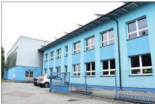
Termomodernizacja Szkoły Podstawowej w Gołkowicach dobiega końca

Ponadto 27 czerwca rozpoczęto budowę drogi do terenów inwestycyjnych w Gołkowicach. Wartość umowy wynosi 2.689.520,13 zł. Termin realizacji mija 6 czerwca przyszłego roku. Aktualnie trwają prace związane z budową kanalizacji deszczowej. Trwają również prace projektowe w formie „zaprojektuj i wybuduj” dla budowy