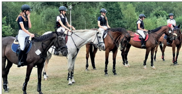
W Pokazie wzięło udział ponad 20 koni

Widowiskowe zmagania cieszyły się dużym zainteresowaniem widzów, dla której organizatorzy – Stowarzyszenie Hodowców i Miłośników Koni Mustang – zapewnili sporo atrakcji. W tym grochówkę z wojskowej kuchni polowej, którą przygotowali członkowie Stowarzyszenia Obrona Państwa. Stowarzyszenie podczas imprezy zapewniło również prelekcje historyczne, a także możliwość strzelania do tarcz z replik broni Air Soft Gun. (a)