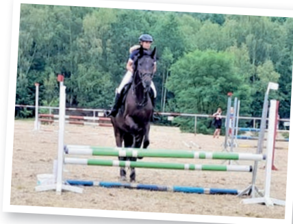
Najbardziej efektowna część imprezy, czyli skoki przez przeszkody