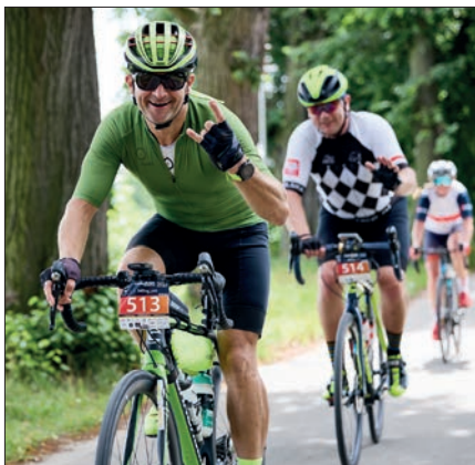
Z Godowa w trasę ruszyło w sumie ponad 500 kolarzy

Początek trasy dla najdłuższych dystansów był taki sam. Zawodnicy wzdłuż granicy z Czechami, ruszyli w kierunku Głubczyc. Na 85 km w miejscowości Pomorzowiczki czekał na nich pierwszy punkt żywieniowy, gdzie mogli zjeść ciasto i uzupełnić bidony. W miejscowości Javornik, zawodnicy dystansu 530 km ruszyli na objazd Kotliny Kłodzkiej. Po drodze mijali takie miejscowości jak Łądek Zdrój, Międzyzlesie czy Duszniki Zdrój. Następnie przebili się przez Góry Stołowe i przez Nową Rudę dotarli do Kamieńca Ząbkowickiego. Tam czekał na nich kolejny punkt żywieniowy. Dodatkowo spotkali się tam z uczestnikami dystansu 340 km, którzy to z Javornika, przez Złoty Stok popędzili prosto do tego punktu. Ostatni odcinek dla obu dystansów to fajna jazda z wiatrem w kierunku