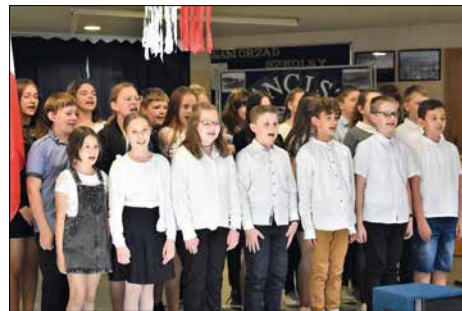
Społeczność szkoły przygotowująca bogaty program artystyczny