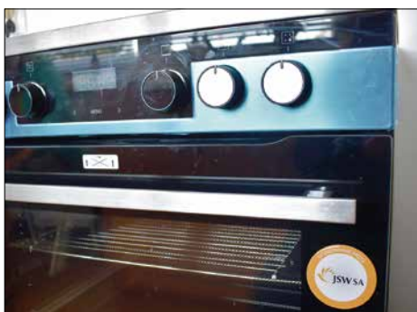
Nowoczesny sprzęt trafił do świetlicy w Podbuczu i remizie w Godowie

W przyszłości ze sprzętu będą mogli korzystać również strażacy oraz osoby użytkujące świetlicę wiejską. (a)