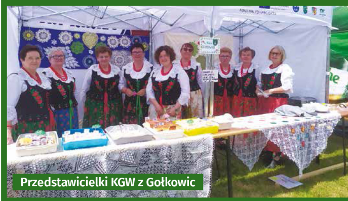
Przedstawicielki KGW z Gołkowic