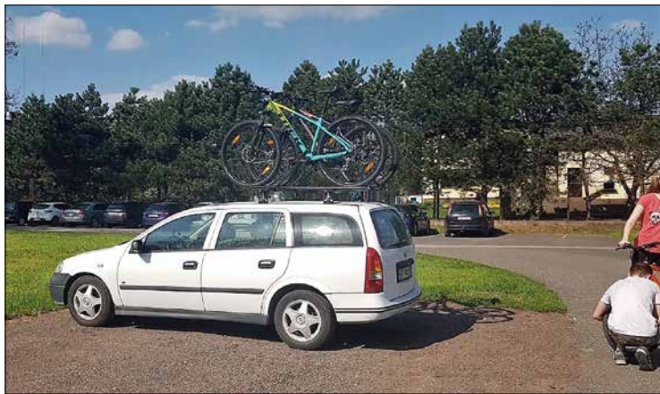
(a) Dodatkowe miejsca znajdują się nieopodal budynku urzędu gminy

Do tej pory zdarzało się, że w słoneczne dni sprzyjające turystyce rowerowej, a także podczas różnych uroczystości, trudno było znaleźć miejsca parkingowe przy urzędzie gminy. Dodatkowe miejsca postojowe powinny poprawić sytuację.