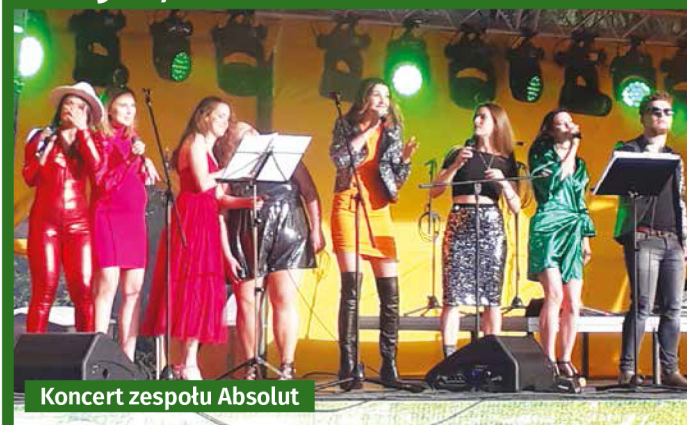
Koncert zespołu Absolut