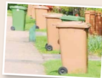
Bioodpady odbierane są tylko w pojemnikach

Zachęcamy też do samodzielnego kompostowania bioodpadów. Osoby posiadające kompostowniki i kompostujące samodzielnie bioodpady, zwolnione są z części opłaty za odbiór i zagospodarowanie odpadów. Zwolnienie wynosi 1,50 zł od stawki obowiązującej opłaty za gospodarowanie odpadami komunalnymi od osoby zamieszkującej daną nieruchomość. Ponadto na terenie gminy realizowana jest akcja „Własny kompost = piękny ogród”, w ramach której, realizująca akcję firma Planergia dostarczyła mieszkańcom 40 darmowych kompostowników, a kolejnych 40 przekazała w cenie obniżonej o 50%. Nadal prowadzona jest też akcja edukacyjna na temat kompostowania, np. na temat tego jak własnoręcznie wykonać kompostownik. (a)