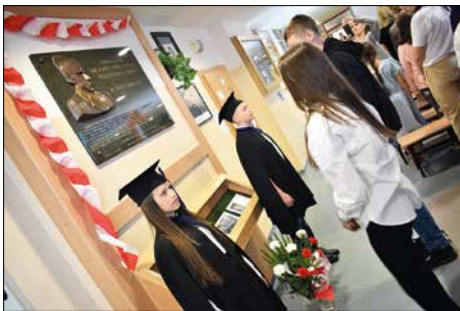
Uczniowie składają kwiaty pod tablicą pamiątkową poświęconą patronowi szkoły