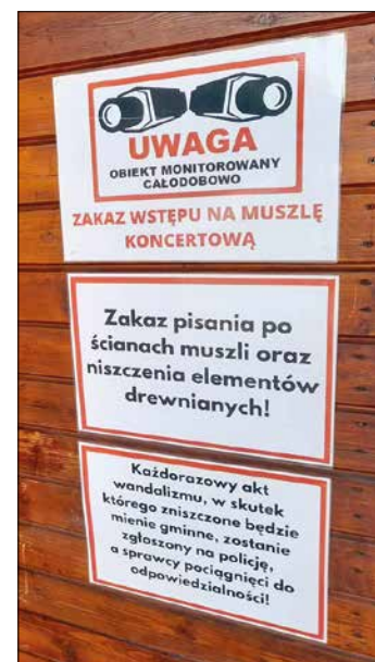
Przypominamy, że obiekt objęty jest całodobowym monitoringiem