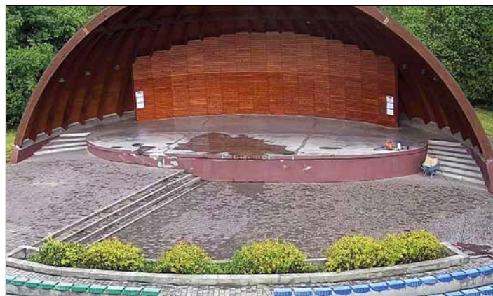
Muszla koncertowa została odnowiona. Apelujemy, by jej nie niszczyć.

budynków, to również niszczenie mienia i robić tego po prostu nie wolno! (a)