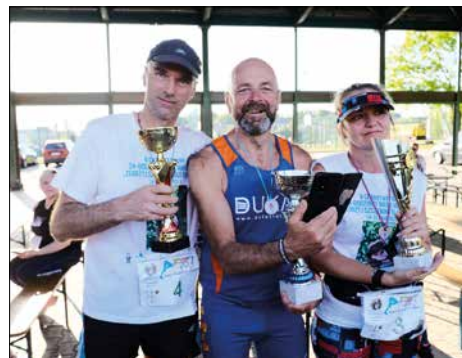
V Charytatywny Bieg i Marsz NW