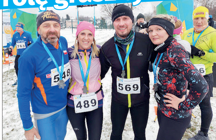
FOT. ŁAPACZE ZACHODÓW SŁONCA (3)