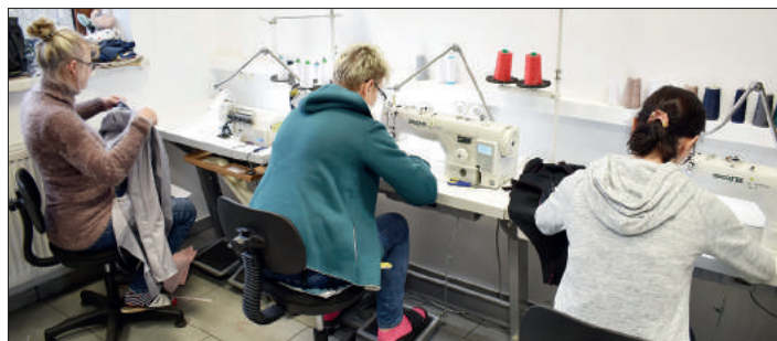
Mieszkańcy gminy mogą skorzystać również z usług działającej w CIS pracowni krawieckiej

Od listopada 2019 r. Centrum Integracji Społecznej w Godowie, które ma swoją siedzibę w Gołkowicach, realizuje projekt aktywizacji zawodowej „CIS dla powiatu wodzisławskiego”. Przy współpracy z Gminą Godów oraz Gminnym Ośrodkiem Pomocy Społecznej w Godowie do Centrum kierowane są osoby, które skorzystają z oferty nauki zawodu w pracowniach CIS, warsztatów, szkoleń oraz kursów zawodowych. Dzięki temu CIS wyszkolił m.in. certyfikowane opiekunki seniorów i osób niepełnosprawnych. Z ich pomocy może skorzystać każdy mieszkaniec gminy Godów.