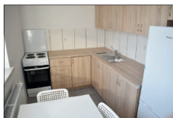
Mieszkania zostały kompleksowo wyposażone