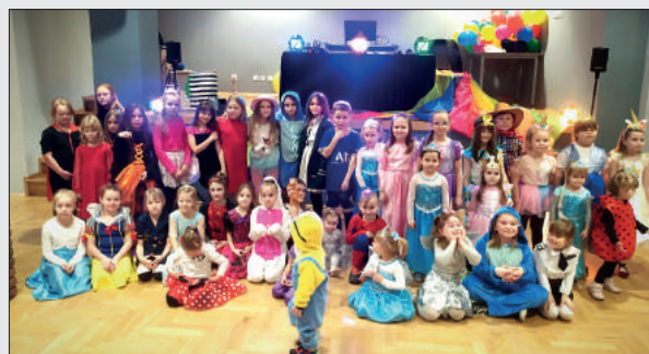
Balik karnawałowy w Ośrodku Kultury w Godowie, rok 2022