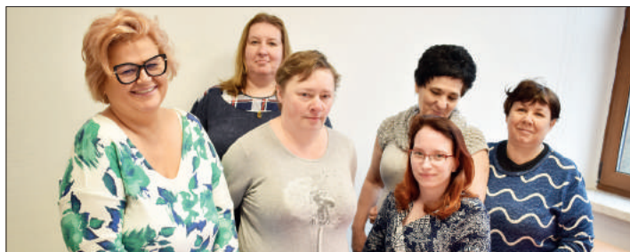
Uczestniczki pracowni opiekuńczo-asystenckiej posiadają stosowne certyfikaty, potwierdzające ich doświadczenie w opiece nad seniorami i osobami niepełnosprawnymi