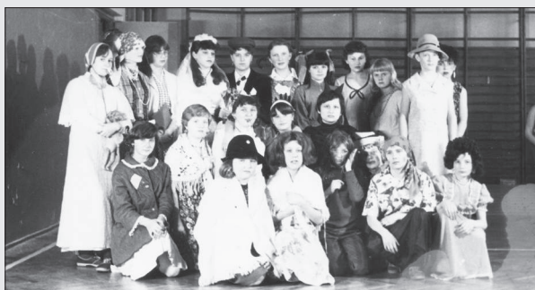
Bal przebierańców w SP Gołkowice. Lata 80.