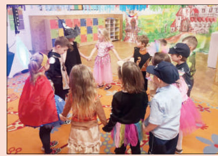
FOT. PRZEDSZKOLE PUBLICZNE „BAJKOWE WZGÓRZE” W SKRZYSZOWIE (2)