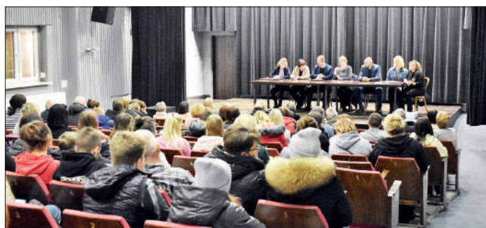
10 marca w Ośrodku Kultury w Gołkowicach odbyło się spotkanie informacyjno-integracyjne, zorganizowane przez Gminę Godów dla uchodźców

Od 18 marca w Urzędzie Gminy Godów rozpoczęło się nadawanie uchodźcom numerów PESEL i Profili Zaufanych niezbędnych do tego, by mogli oni