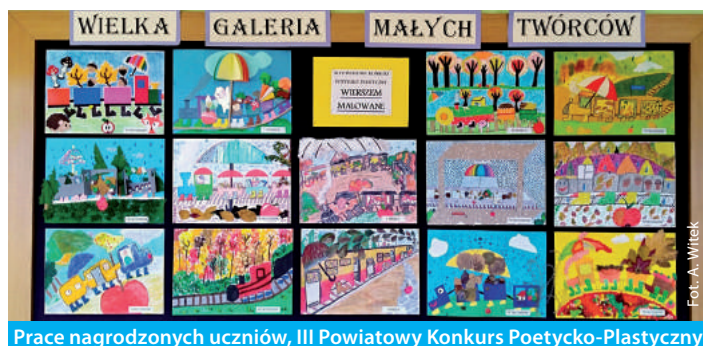
Prace nagrodzonych uczniów, III Powiatowy Konkurs Poetycko-Plastyczny