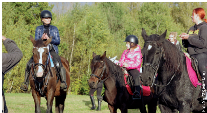
Hubertus, 16.10.2021 r.

W sobotę 16 października członkowie Stowarzyszenia Hodowców i Miłośników Koni „Mustang” zorganizowali gonitwę za lisem, czyli Hubertus. Jest to święto myśliwych, leśników i jeźdźców, organizowane na zakończenie sezonu. Wśród jeźdźców urządzana jest gonitwa, podczas której konno ściga się tzw. lisa, jeźdźca z ogonem przypiętym do lewego ramienia. Ten, kto go zerwie, ma prawo wykonać rundę honorową wokół miejsca pogoni i za rok sam ucieka jako lis.