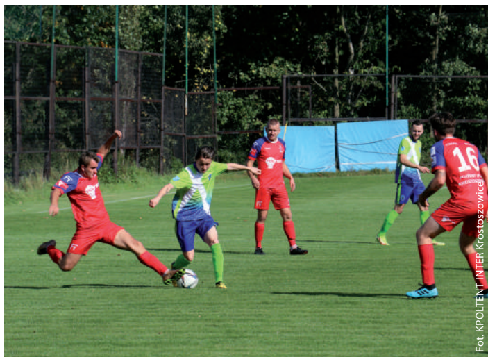
Piłkarskie święto w Krostoszowicach, 03.10.2021 r.