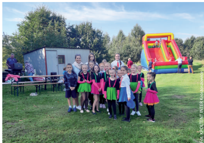
Taneczny występ zespołu Anava podczas piłkarskiego spotkania w Krostoszowicach, 03.10.2021 r.