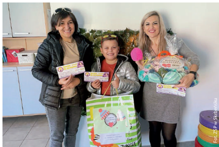
Akcja „Czapeczka dla wczesniaka”