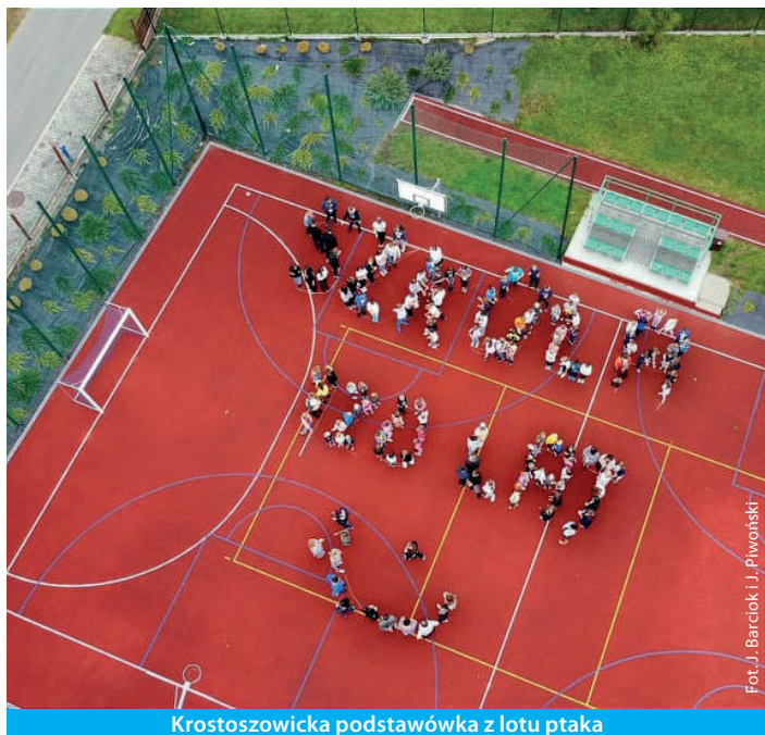
Krostoszowicka podstawówka z lotu ptaka