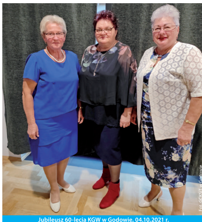
Jubileusz 60-lecia KGW w Godowie, 04.10.2021 r.