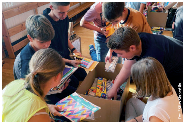
Kredkobranie w ZSP w Skrbeńsku