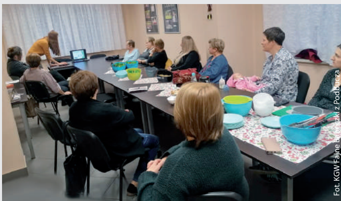
Warsztaty kulinarne Koła Gospodyń Wiejskich Fajne Babeczki z Podbucza z dietetykiem Godowskiego Centrum Aktywności Lokalnej, 27.10.2021 r.