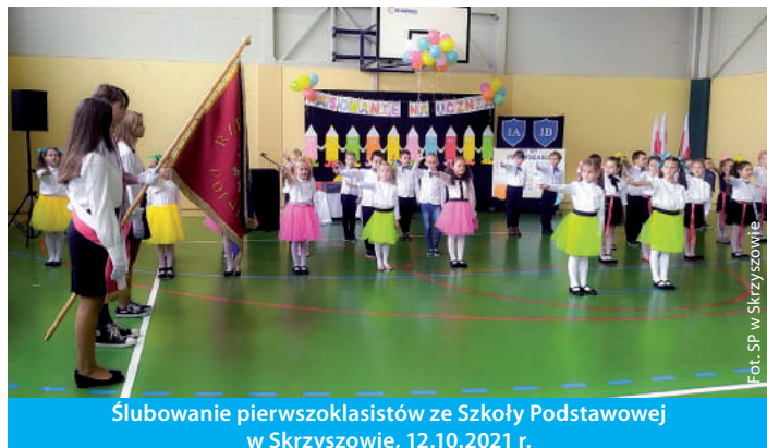
Ślubowanie pierwszoklasistów ze Szkoły Podstawowej w Skrzyszowie, 12.10.2021 r.