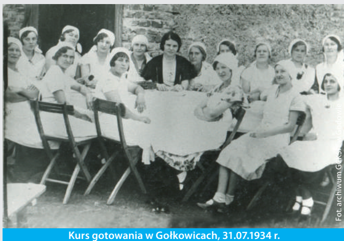
Kurs gotowania w Gołkowicach, 31.07.1934 r.