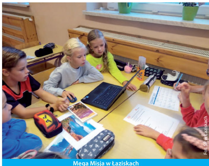
Mega Misja w Łaziskach

Stowarzyszenie Lokalna Grupa Działania „Wspólny Rozwój” w partnerstwie z Gminą Godów realizuje projekt dofinansowany ze środków Europejskiego Funduszu Społecznego pt. „RAZEM MOŻEMY WSZYSTKO – Program aktywności lokalnej”