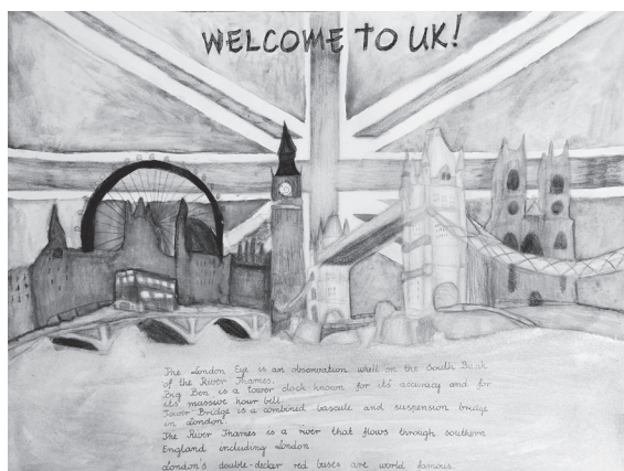
Praca Poli Krziżok