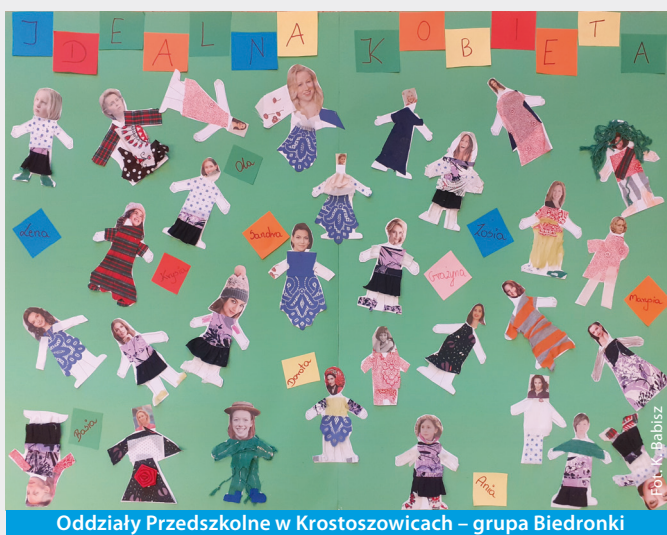
Oddziały Przedszkolne w Krostoszowicach – grupa Biedronki

PRZYCHODNIA OVIKOR MEDICAL CLINIC OF SILESIA