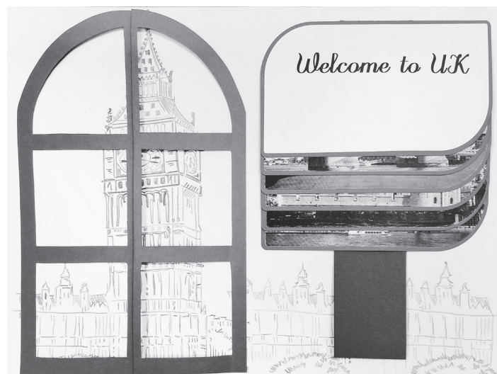
Praca Zuzanny Tomali

Gratulujemy zwycięzcom oraz dziękujemy wszystkim uczestnikom za udział w konkursie i zapraszamy do udziału w kolejnych edycjach konkursu!