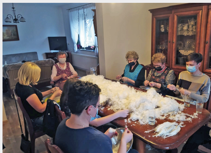
Szkubaczki. Gołkowice, 2021 r.