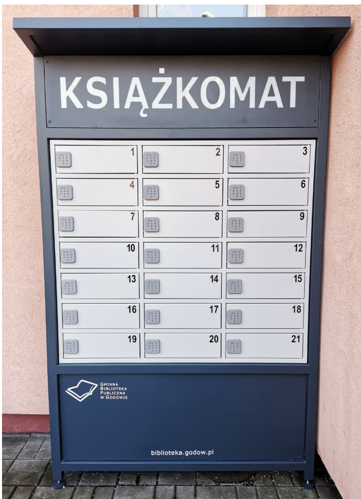
Książkomat przy GBP w Godowie