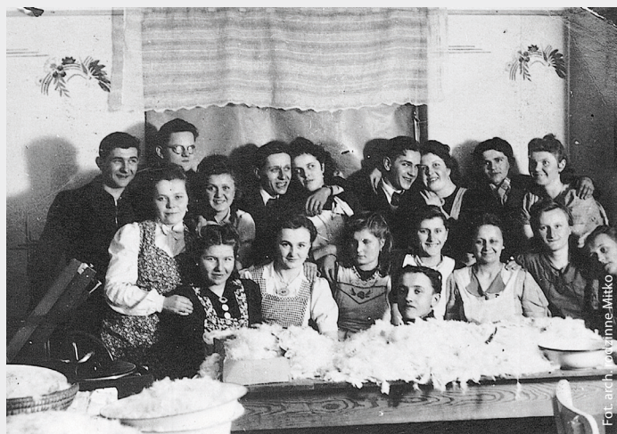
Szkubaczki. Gołkowice, lata 40. XX wieku