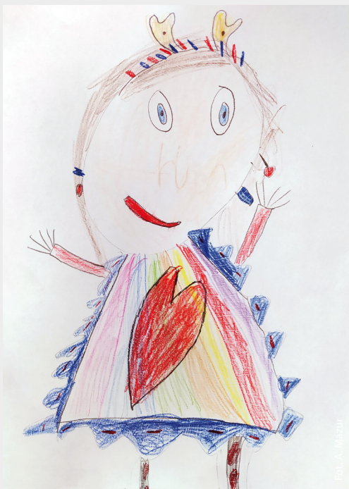
Zespół Szkolno-Przedszkolny w Godowie – grupa Misie