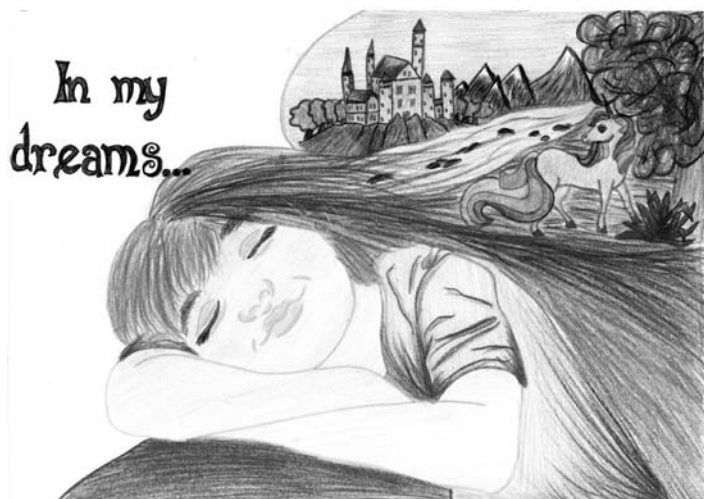
Plakat międzynarodowego projektu eTwinning „In my dreams” wykonany przez uczniów SP Łaziska