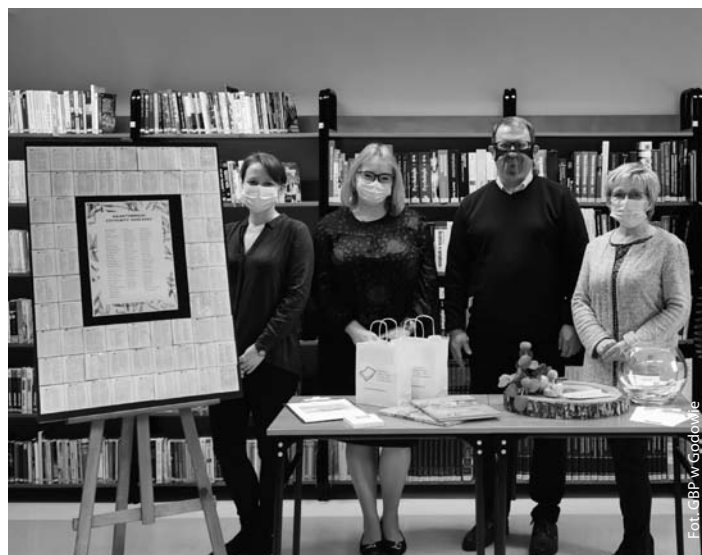
„Przeczytam 52 książki w 2020 roku”

Zapraszamy wszystkich miłośników czytania do udziału w tegorocznej akcji „Przeczytam 52 książki w 2021 roku”.