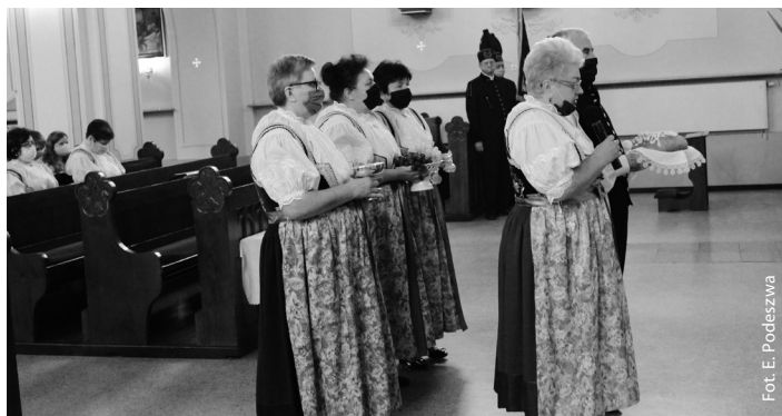
Msza dziękczynna. Godów, 31.08.2020 r.