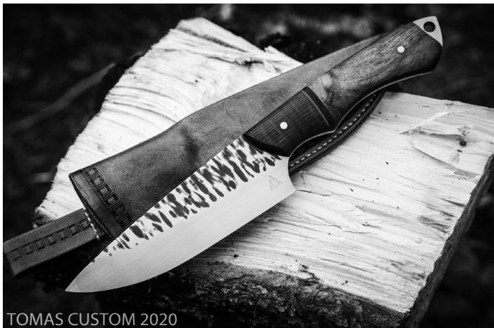
TOMAS CUSTOM 2020

Zebra. Trzymilimetrowa stal 4H13 o twardości 56HRC, na rękojeści orzech amerykański + dąb brunatny + wenge i G10, pochwa ze skóry naturalnej. 260 mm całości, 140 mm ostrza