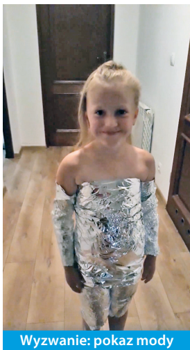
Wyzwanie: pokaz mody