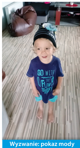
Wyzwanie: pokaz mody