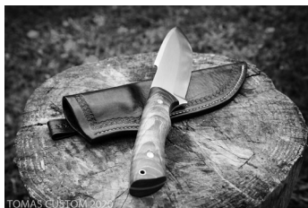
Ultraviolet. Trzymilimetrowa stal X46Cr13 nierdzewna, hartowana do 58 HRC, na rękojeści barwiony i stabilizowany jesion oraz piny mozaikowe. 250 mm całości, 125 mm ostrza