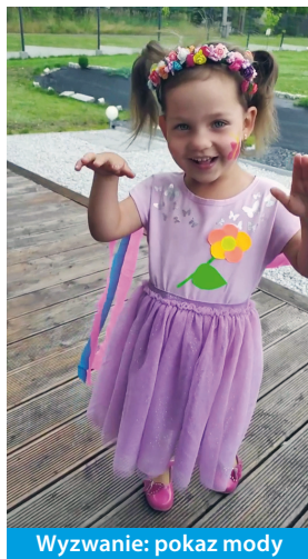
Wyzwanie: pokaz mody