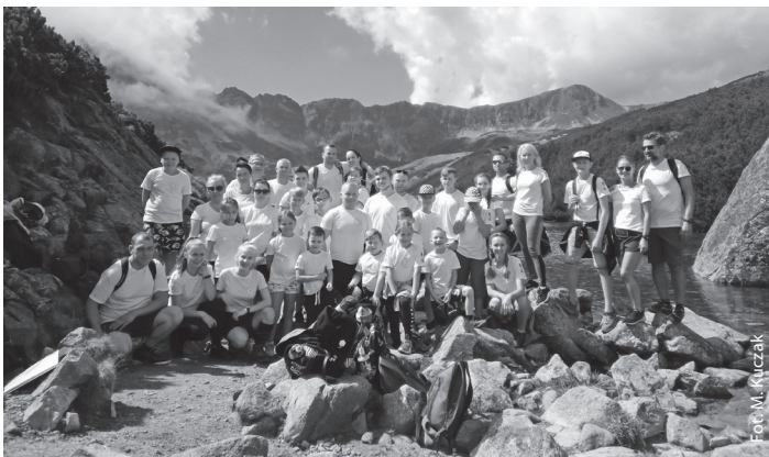
Dolina Pięciu Stawów