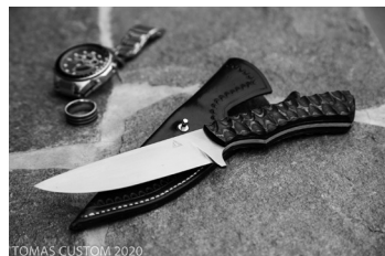
The Blue. Trzymilimetrowa stal X46Cr13 hartowana, na rękojeści fornir orzecha amerykańskiego barwiony i stabilizowany, pochwa ze skóry naturalnej barwionej. 245 mm całości, 125 mm ostrza

Zdarzało mi się wykonywać noże absolutnie niepraktyczne, ale tylko dlatego, że odbiorca dostarczył taki, a nie inny przygotowany wzór. Staram się w takich wypadkach tłumaczyć pewne zasady funkcjonalności, ażeby nie było rozczarowania przy finalnym wyrobie.