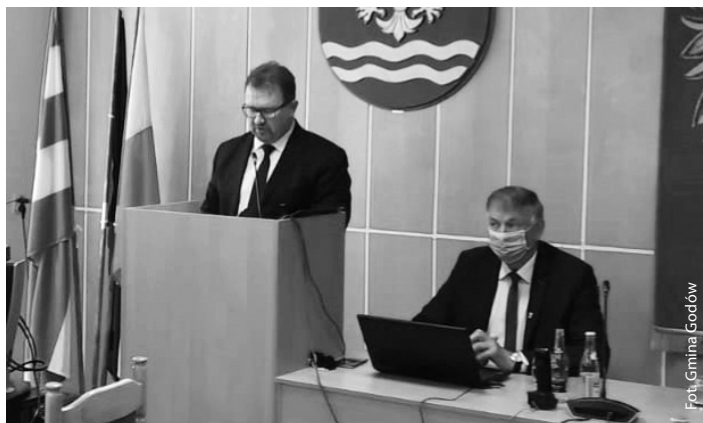
Sesja Rady Gminy. Godów, 27.08.2020 r.