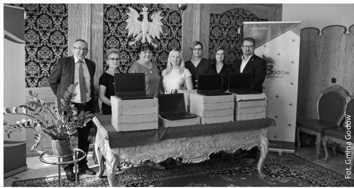
Przekazanie laptopów w ramach projektu „Zdalna Szkoła+”