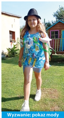
Wyzwanie: pokaz mody