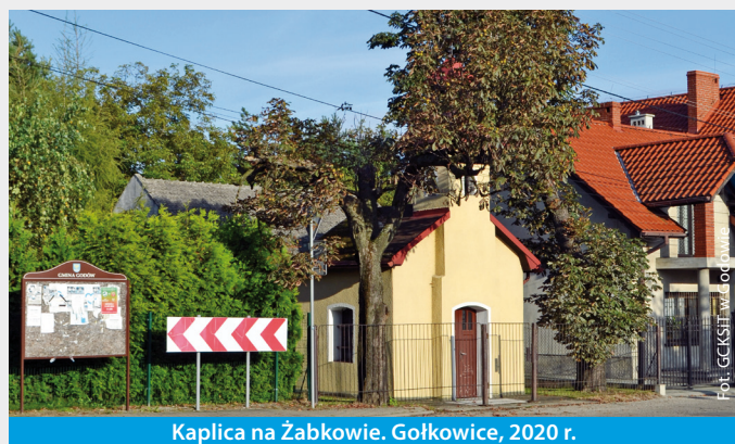
Kaplica na Żabkowie. Gołkowice, 2020 r.