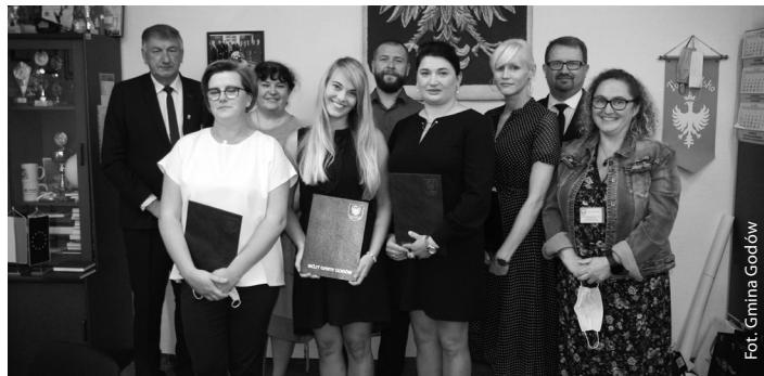
Awanse nauczycieli. Godów, 27.08.2020 r.