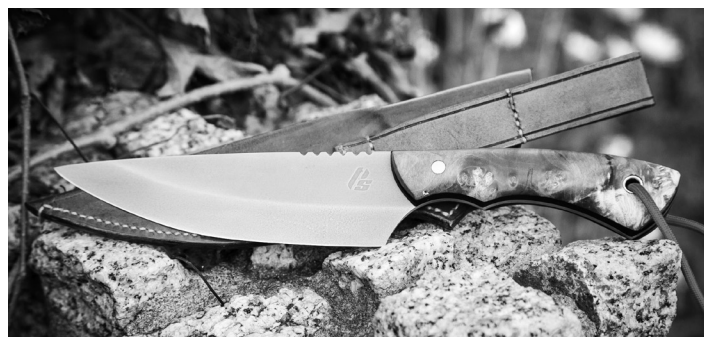
The Red. Trzymilimetrowa stal X46Cr13 piaskowana po hartowaniu, na rękojeści kombinacja wenge i stabilizowanego klonu, pochwa z naturalnej skóry. 270 mm całości, 150 mm ostrza