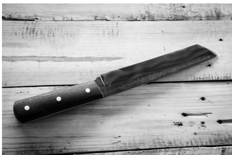
Nóż ze starej piły tarczowej, zahartowany selektywnie, oprawiony w czarny dąb i G10. 305 mm całości, 185 mm ostrza