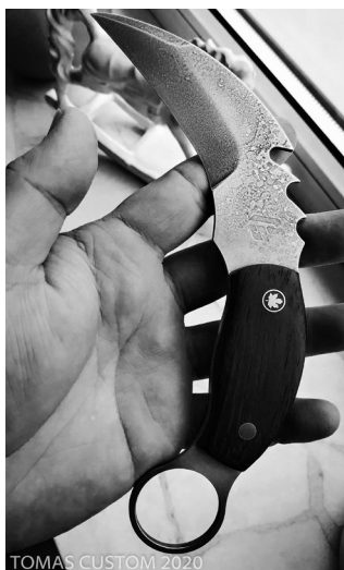
TOMAS CUSTOM 2020

Scandinavian Spirit. Kuta stal 100Cr6, na rękojeści mosiądz, skóra, czarny dąb i w dominującej części egzotyczna jatoba, pochwa ze skóry naturalnej. 215 mm całości, 100 mm ostrza