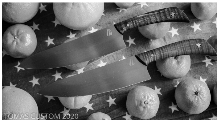
Noże z nierdzewnej stali 4H13 w oprawie klonu płomienistego stabilizowanego i barwionego w masie