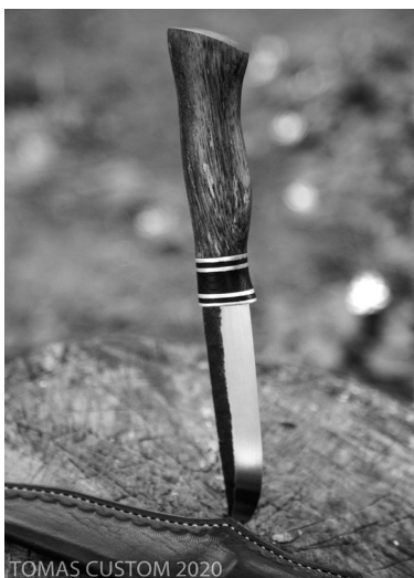
TOMAS CUSTOM 2020

To jest trudne pytanie. Znam ludzi, którzy twierdzą, że wystarczy talent, inni mówią, że tylko praca i systematyka przynosi efekty. Na pewno na początek konieczne jest minimum wiedzy. Nie da się wziąć do ręki kawałka stali, młotka, pilnika i już. Nie, to tak nie działa. Nie trze-