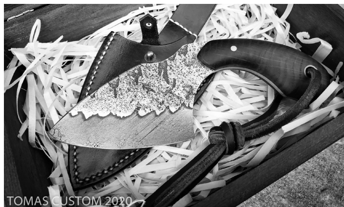
The Legend. Stal NCV1 hartowana i trawiona warstwowo, rękojeść z dębu brunatnego, pochwa z naturalnej skóry