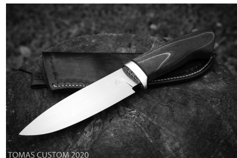
Jesień. Stal 2,8 mm Bohler M310, na rękojeści drewno amazaque z zielonym akcentem włókna szklanego, pochwa ze skóry. 240mm całości, 130 mm ostrza