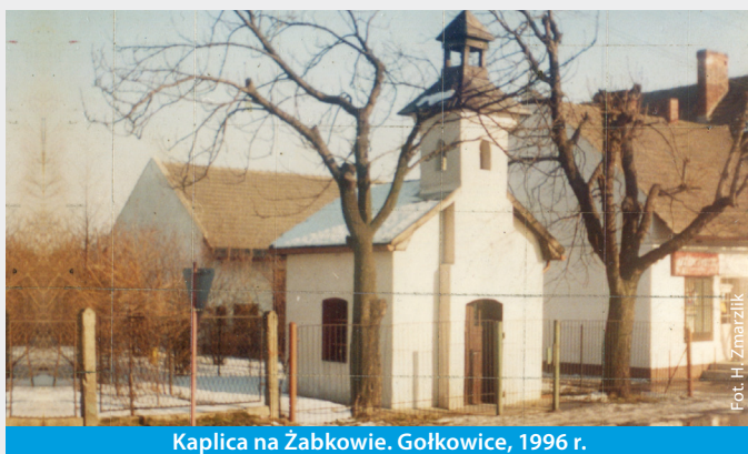
Kaplica na Żabkowie. Gołkowice, 1996 r.