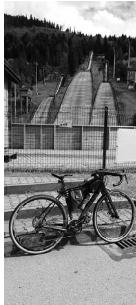
Tour de Silesia special editon in Norrbotten, Solo