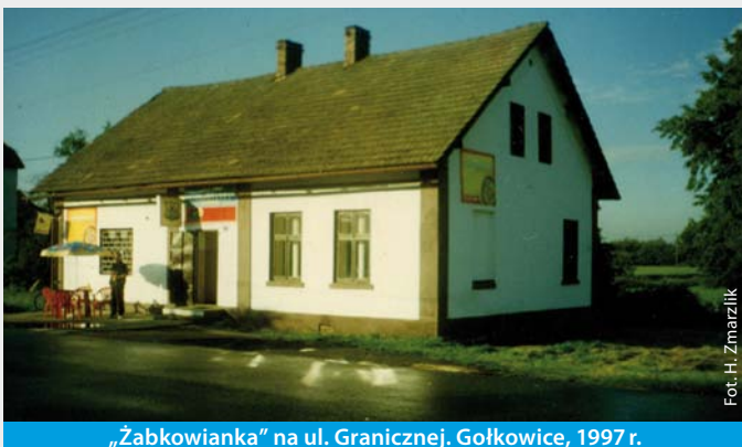
„Zabkowianka” na ul. Granicznej. Gołkowice, 1997 r.