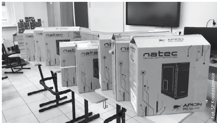
Nowoczesny sprzęt komputerowy w SP Krostoszowice