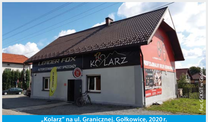
„Kolarz” na ul. Granicznej. Gołkowice, 2020 r.