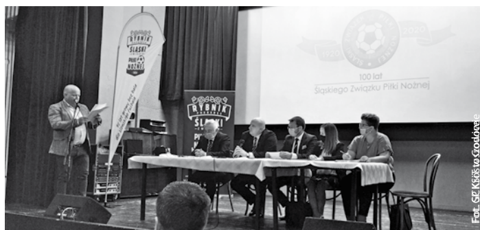
Zebranie Klubów Podokręgu Rybnik. OK Gołkowice, 19.06.2020 r.

W szkołach na terenie gminy Godów do egzaminu przystąpiło 138 uczniów. Z powodu przebywania na kwarantannie egzaminów tych nie mogło zdawać 8 osób (3 – SP Gołkowice, 2 – SP Skrzyszów, 1 – SP Krostoszowice, 1 – SP Godów, 1 – SP Skrbeńsko). Dla tych uczniów zaplanowano dodatkowy termin. Podeszli oni do egzaminów 7, 8 i 9 lipca.