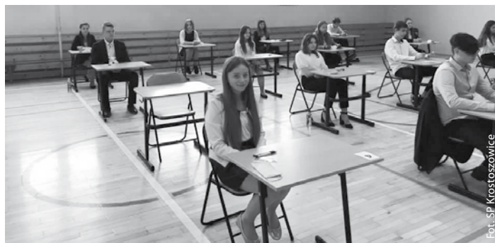
Egzamin ósmoklasisty w SP Krostoszowice

18 czerwca zakończyły się egzaminy ósmoklasistów. W pierwszej kolejności uczniowie ostatnich klas szkół podstawowych pisali egzamin z języka polskiego, następnie z matematyki, a na końcu z języka obcego.