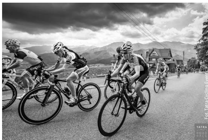
Tatra Road Race 2019

Marzeń mam wiele, bo – tak jak wspomniałam – jest to niezwykle rozwojowy sport, ale na pewno chciałabym zaistnieć w czasówkach, ponieważ wiem, że góry mi służą, a te czasówki gdzieś tam kuleją ze wzglę-