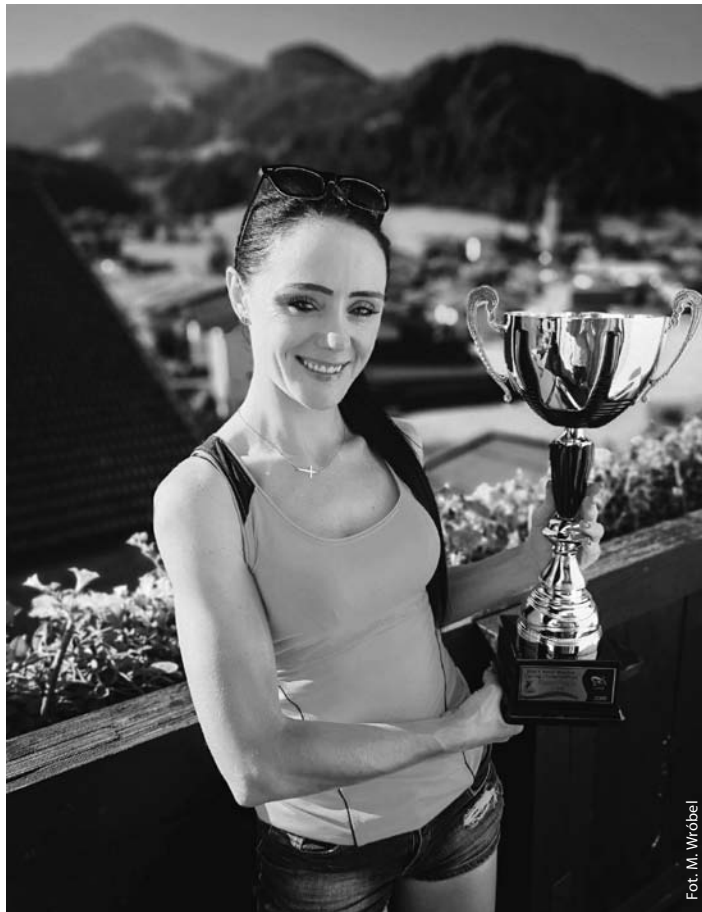
Puchar Świata 2019 – World Cup Hill Climb w Austrii

Do zespołu dołączyłam od początku sezonu 2016, wcześniej przez jakiś czas trenowałam w Czechach, a z kontuzją borykałam się przez trzy sezony. Kiedyś częściej jeździło się za południową granicę na za-