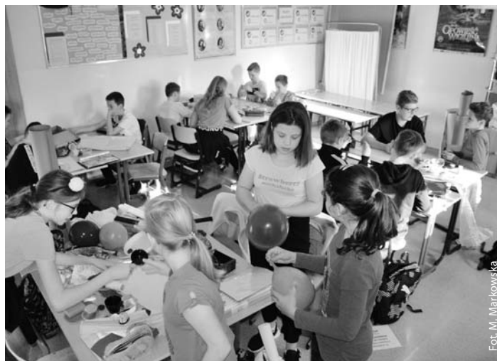
Lekcje z emocjami, Szkoła Podstawowa w Skrzyszowie