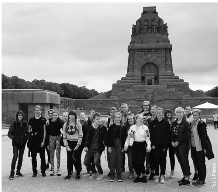
Uczniowie polsko-niemieckiej wymiany szkolnej pod pomnikiem Bitwy Narodów w Lipsku