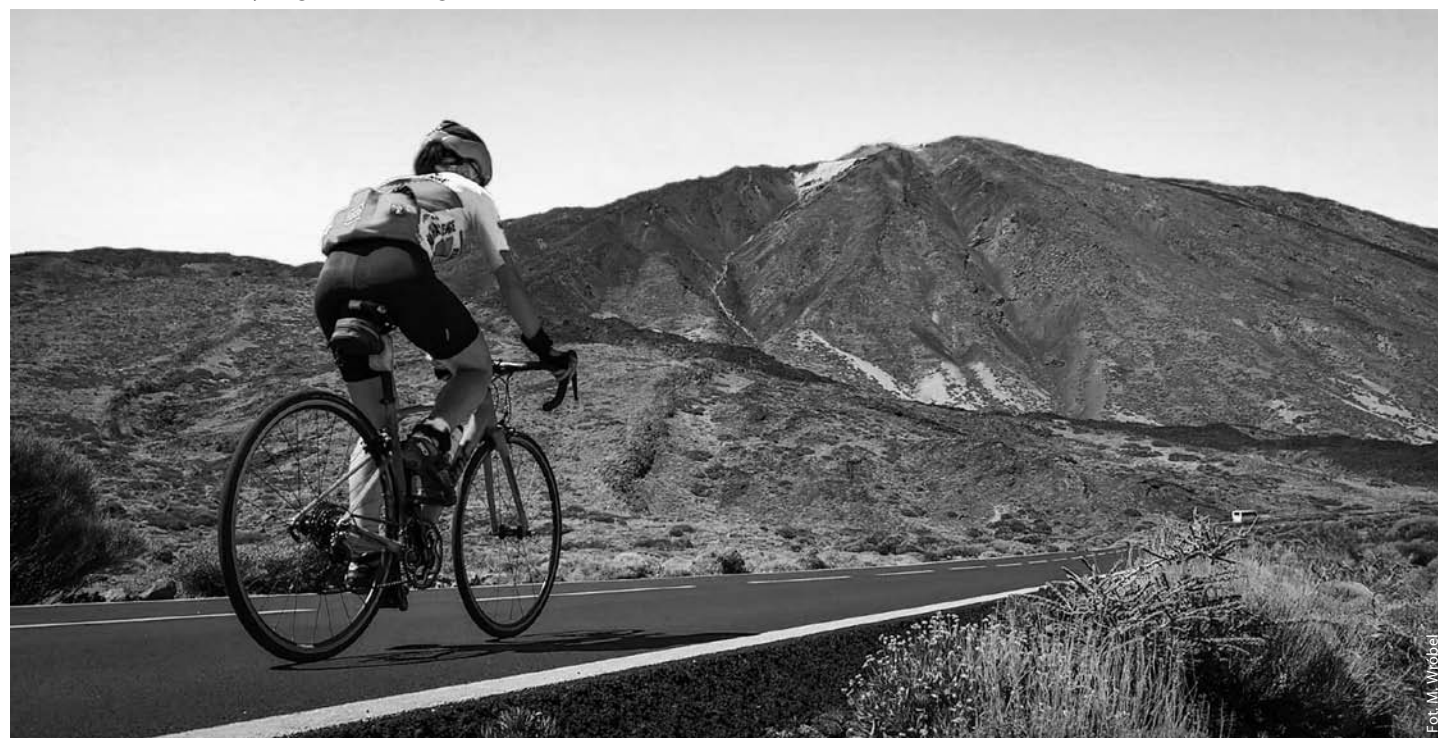
Obóz przygotowawczy na Teneryfie

szych i najpiękniejszych klasyków cyklu World Tour – przyp. red.]. Ten start naprawdę mnie wzmocnił, przede wszystkim duchowo, bo nie wiedziałam, że jestem w stanie tak dobrze pojechać w tak trudnym terenie, na drogach szutrowych, na dodatek w ulewie i przy temperaturze 7°C. Po tym wyścigu kilka dni dochodziłam do siebie. Na finiszu doszło do kraksy, w której niespodziewanie uczestniczyłam – podciął mnie lecący rower, a ja nie zdążyłam nawet zareagować. Ostatecznie linię mety przekroczyłam jako zwyciężczyni, ze stratą tylko 2 sekund do pierwszego mężczyzny, co jest dla mnie ogromnym osiągnięciem.