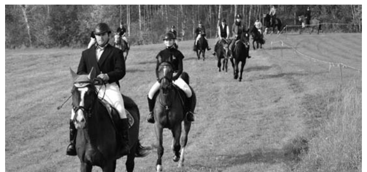
Hubertus, Krostoszowice 19.10.2019 r.