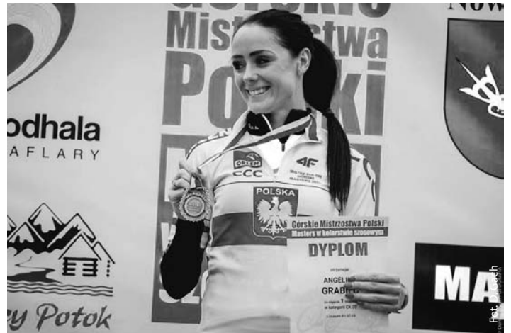
Górska Mistrzyni Polski 2017

wody, bo w Polsce było ich niewiele. W końcu u nas również zaczęto organizować wyścigi na dobrym poziomie, dlatego postanowiłam wrócić do ścigania. Napisałam do prezesa JAS-KÓŁKI, czy zabraliby mnie na zawody. Odezwał się niemal natychmiast. Pierwszy sezon był bardzo ciężki, niezmiennie odczuwałam ból w nodze, ale dzięki współpracy z fizjoterapeutami już w sezonie 2017 poczułam poprawę.