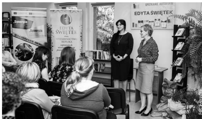
O literaturze bez granic w Gminnej Bibliotece Publicznej, Godów 18.10.2018 r.