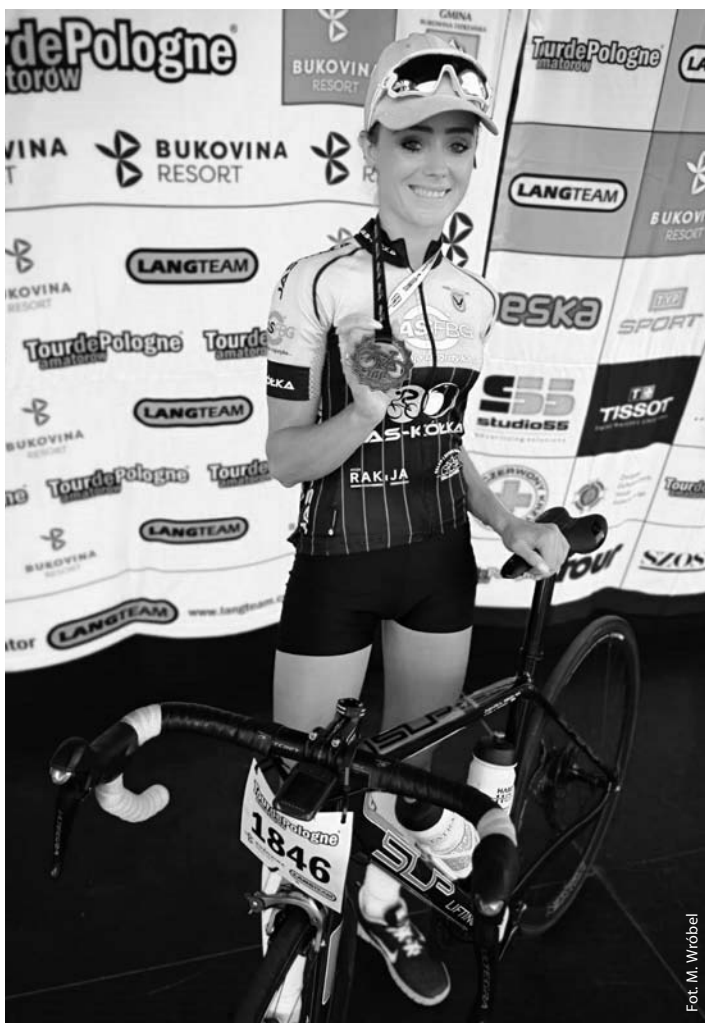
Tour de Pologne Amatorów 2019

ję taki wyjazd, powtórka już w marcu przyszłego roku!