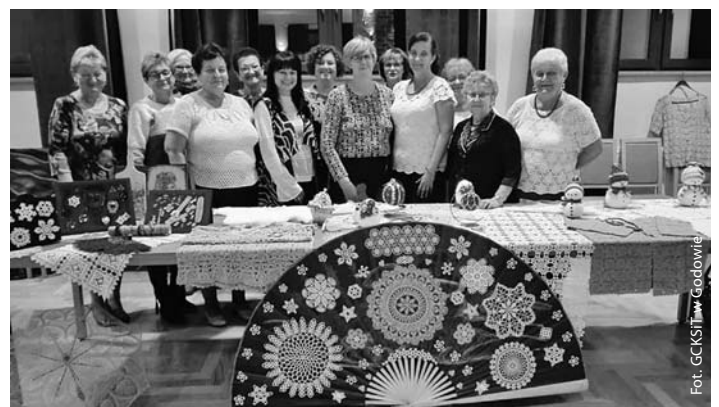
Artystyczne Wiesiady, Godów 23.10.2019 r.

Wiesiady były także okazją do obejrzenia odnowionej pracowni Art-Pompownia i zapoznania się z bogatą ofertą kulturalno-warsztatową, jaką oferuje OK w Godowie. Zapraszamy wszystkich chętnych na warsztaty ceramiczne oraz grudniowe warsztaty rękodzieła, podczas których