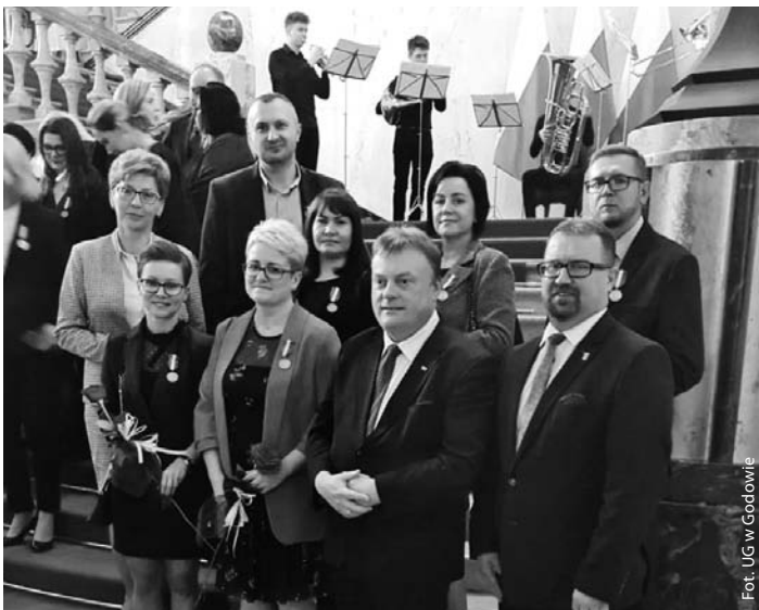
Uhonorowani Medalami za Długoletnią Służbę, Katowice 21.10.2019 r.

Medale za Długoletnią Służbę przyznawane są przez Prezydenta RP za wzorowe, wyjątkowo sumienne wykonywanie obowiązków wynikających z pracy zawodowej w służbie Państwa.