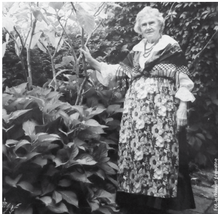
Pożegnanie z Gospodynkami, 12.03.2007 r.