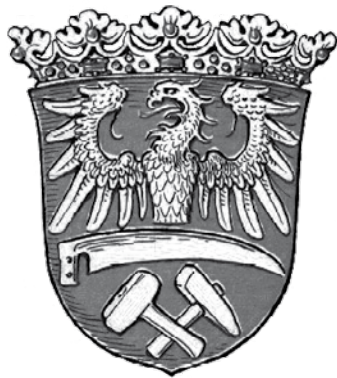
Herb prowincji górnośląskiej