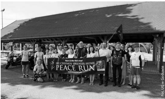
Sztafeta Biegu Pokoju – Peace Run, Godów 19.06.2019 r.