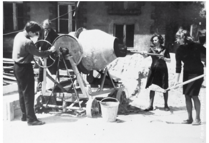
Budowa szkoły, 1964 r.

Niecałe 2 miesiące po otwarciu szkoły miało miejsce wydarzenie szczególne. Komitet Rodzicielski postanowił urządzić zabawę sylwestrową, na którą każdy uczestnik musiał przyjść w... papuciach. Nie mogliśmy przecież zarysować naszego lśniącego parkietu! Panie dobra-