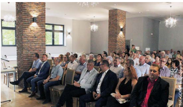
Uroczyste otwarcie Ośrodka Kultury w Godowie, 2.07.2019 r.