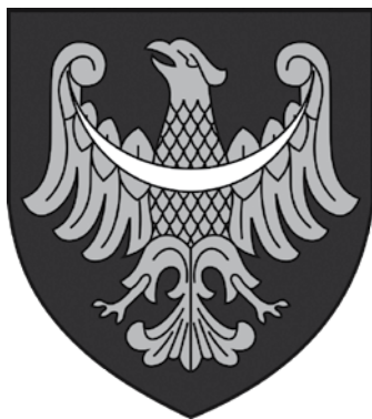
Herb woj. śląskiego