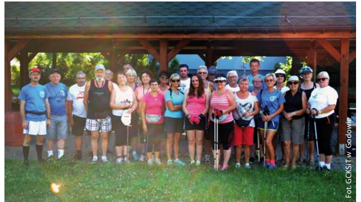
Bieg Po Zdrowie, Łaziska 27.06.2019 r.