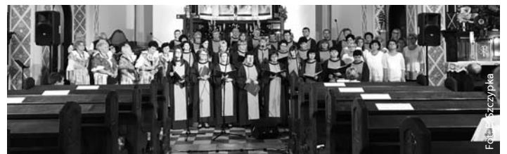
Koncert Papieski, Skrzyszów 2.06.2019 r.