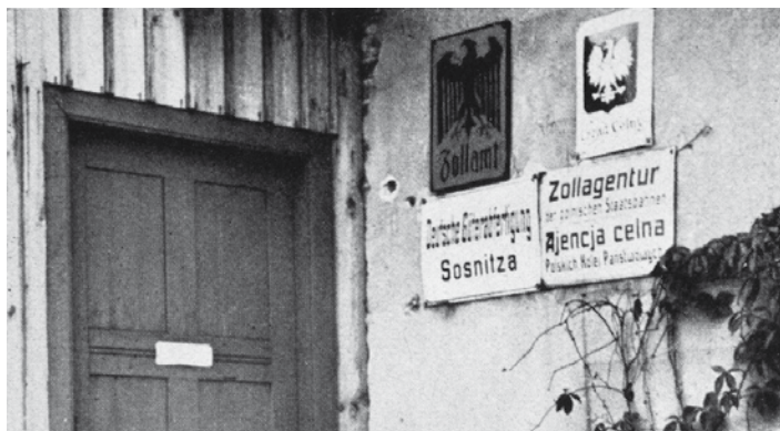
Agencja celna w Sośniczy

Nowa granica przebiegała w gęsto zaludnionym terenie Górnego Śląska nieraz dość kuriozalnie. Dzieliła drogi, obejścia, a niekiedy nawet budynki mieszkalne. Na granicy powstał cały system przejść granicznych (pieszych, drogowych oraz tramwajowych), aby umożliwić mieszkańcom swobodny dostęp do zakładów pracy czy rodzin. Mieszkańcy Górnego Śląska posiadali kartę cyrkulacyjną umożliwiającą tzw. mały ruch graniczny. Sprzyjało to bardzo przemytowi towarów i rozwojowi czarnego rynku, co najbardziej widoczne było w latach 30. XX wieku w czasie Wielkiego Kryzysu. Wybuch wojny w roku 1939 spowodował kolejne zmiany, z terenów dawnego Województwa Śląskiego Niemcy utworzyli Rejencję Katowicką, funkcjonującą w ramach hitlerowskiej III Rzeszy. Rozpoczęły się aresztowania, brutalne przesłuchania, wywózki do obozów koncentracyjnych. Hitlerowcy, posługując się listami proskrypcyjnymi, metodycznie eliminowali powstań-