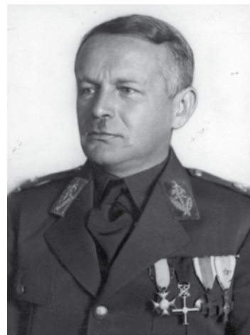
Wojewoda Michał Grażyński