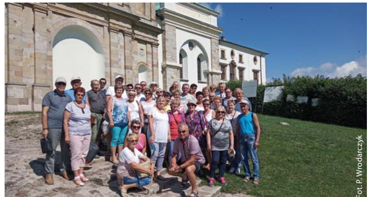
Wycieczka Koła Emerytów z Gołkowic, Góry Świętokrzyskie 27.06.2019 r.