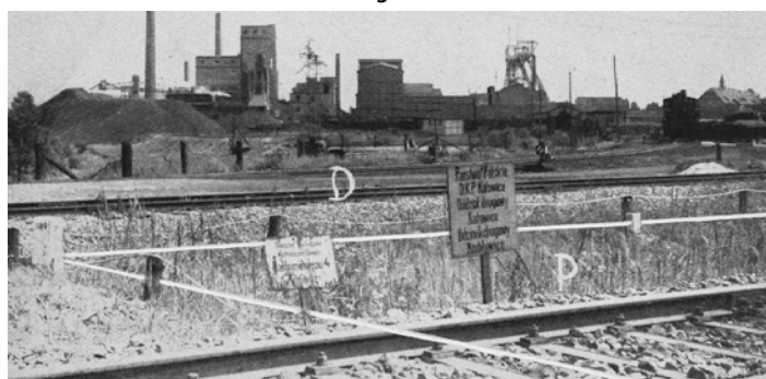
Granica na Górnym Śląsku

ców śląskich, urzędników, nauczycieli, wojskowych, aby zmienić społeczeństwo na bardziej „aryjskie”. Kolejną tragiczną datą jest rok 1945, gdy wkraczająca na teren Górnego Śląska Armia Czerwona traktowała region jako niemiecki. Morderstwa, rabunki i gwałty były na porządku dziennym, aresztowanych górników wysyłano pociągami w głąb ZSRR, do kopalń węgla. Ostatni, którym udało się przeżyć, wrócili na Górny Śląsk pod koniec lat 50. XX wieku. Jednak wielu ze Ślązaków nie potrafiło odnaleźć się w komunistycznej rzeczywistości PRL.