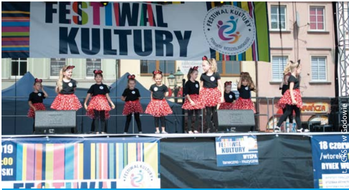
Zespół Rytmix ze Skrzyszowa na Festiwalu Kultury, Wodzisław Śląski 18.06.2019 r.