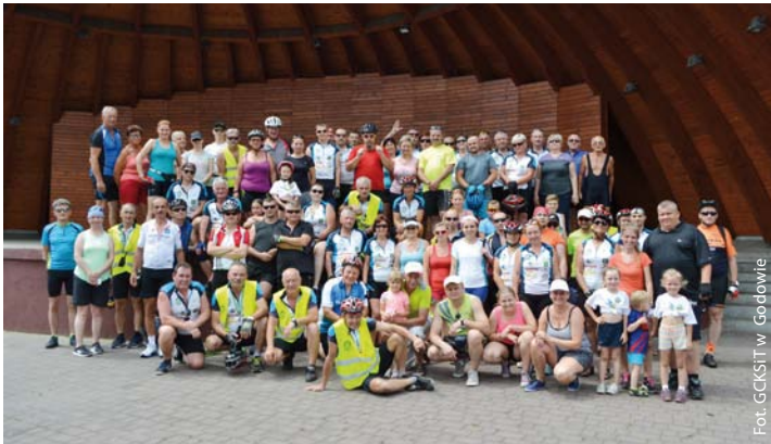
VII Rodzinny Rajd Rowerowy, Godów 15.06.2019 r.