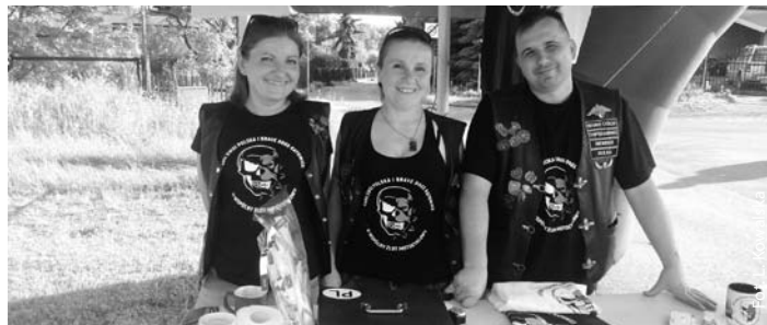
Zlot Motocyklowy Grupy Sami Swoi i Brave Dogs, Krostosowice 2.06.2019 r.