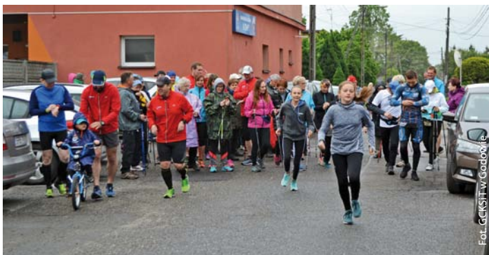
Bieg po Zdrowie, Gołkowie 30.05.2019 r.