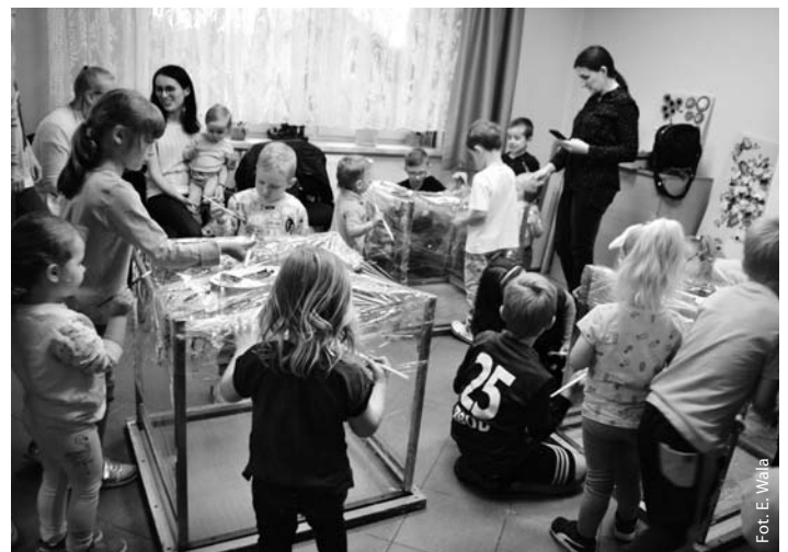
Dzień Dziecka i Matki w Podbuczu, 22.05.2019 r.