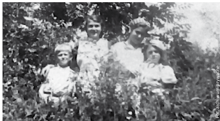
Na landjahrze, Skoczów 1941 r.