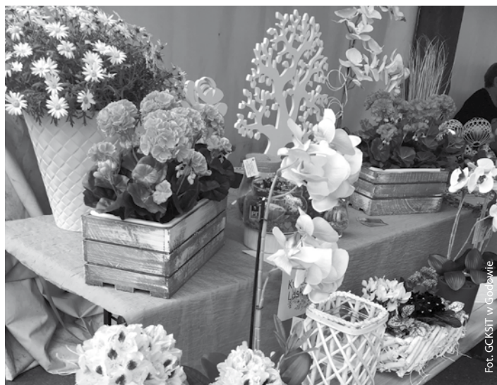
Wystawa Kwiatów i Rękodzieła „Wspólne Pasje”, Gołkowice 26.05.2019 r.

Wspaniałe rękodzieła naszych lokalnych wystawców oraz piękne kwiaty po raz kolejny można było podziwiać 26 maja br. podczas Wystawy Kwiatów i Rękodzieła „WSPÓLNE PASJE” na Transgranicznej Strefie Aktywności w Gołkowicach. Dziergane serwetki, kolorowe maskotki, ręcznie zdobione wazon, biżuteria, kwitnące storczyki, rododendrony, ogrody w szkle i wiele innych przepięknych rzeczy cieszyło oczy przybyłych na wystawę. Ponadto można było przyjrzeć się, jak powstają rękodzieła. Dziękujemy wystawcom za zaangażowanie.