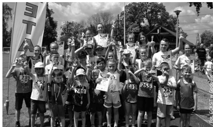
Miting lekkoatletyczny „Czekoladowe Kolce”, Godów 2.05.2019 r.