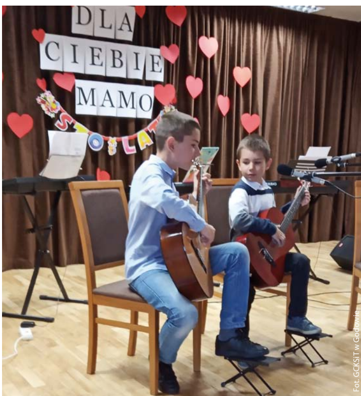
Wiosenny Koncert dla Mam, Skrzyszów 28.05.2019 r.