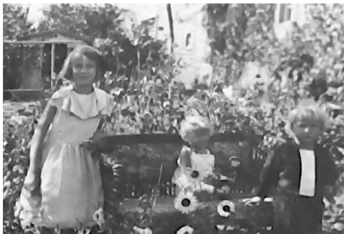
Ogród Państwa Orszulików, Szczekowice 1933 r.

Tak, w momencie gdy w Cieszynie otwarto gimnazjum. Trzeba jednak było dotrzeć tam pieszo. Skoczów był po wojnie tak samo zniszczony jak Wodzisław. Rodzice czy dziadkowie mogą pani opowiedzieć, jak wyglądał Wodzisław po froncie, jakich zniszczeń dokonała radziecka ofensywa. Tak też rozbity był Skoczów – nie było dworca, nie było kolei, nie było rynku, nie było samochodów, nie było niczego... Oprócz ruin. Przez 2,5 miesiąca musiałam dziennie pokonywać 30 km drogi do szkoły, żeby zaliczyć 4. klasę i tym samym ukończyć gimnazjum. Udało się. Od 15 września 1945 roku zaczęłam uczęszczać do liceum pedagogicznego w Cieszynie. Tam też poznałam mojego męża.