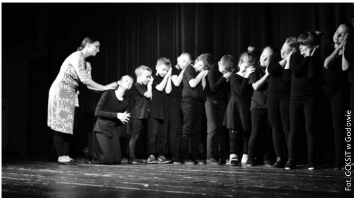
Jubileusz Teatru Naszej Wyobraźni i grup tanecznych ANAVA, Gołkowice 26.05.2019 r.