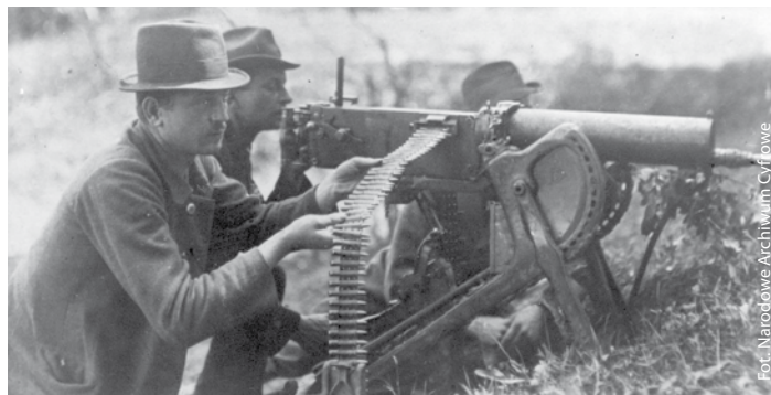
III powstanie śląskie - powstańcy ciężki karabin maszynowy Maxim wz. 1908 na podstawie saneczkowej w akcji nad Odrą