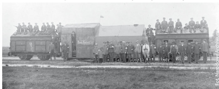
III powstanie śląskie - powstańcy pociąg pancerny "Kabciz". W skład pociągu wchodzi beztendrowy parowóz T37 opancerzony oraz dwa wagony 2-osiove, węglarki żelazne