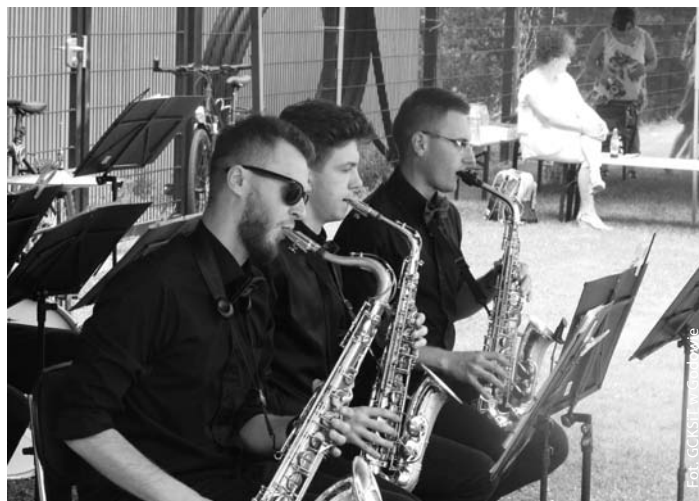
Koncert Orkiestr Dętych w Skrbeńsku, 09.06.2018 r.

9 czerwca 2018 r. na boisku sportowym w Skrbeńsku odbył się Festyn Rodzinny, połączony z koncertem orkiestr dętych, których muzyka umilała wszystkim zebranych w to popołudnie.