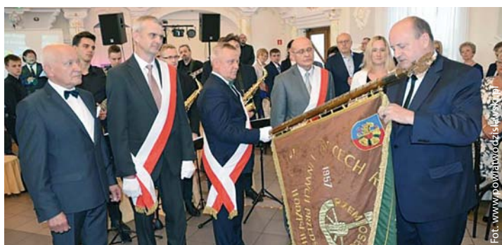
Honorowa Złota Odznaka dla sztandaru Cechu Rzemieślników i Innych Przedsiębiorców w Wodzisławiu Śląskim, 11.05.2018 r.