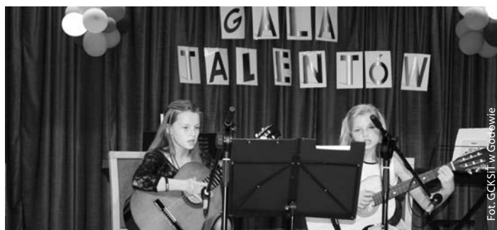
Gala talentów w Ośrodku Kultury w Skrzyszowie, 19.06.2018 r.