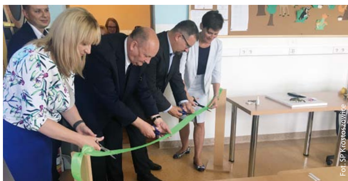
Uroczyste otwarcie Zielonej Pracowni w Krostoszowicach, 22.05.2018 r.