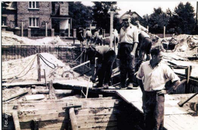
Budowa basenu przy SP w Skrzyszowie, lata 60. XX w.