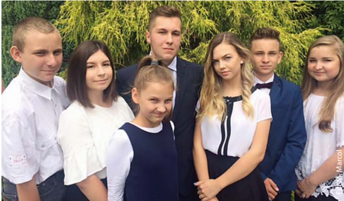
Skrzyszowscy laureaci konkursów polonistycznych