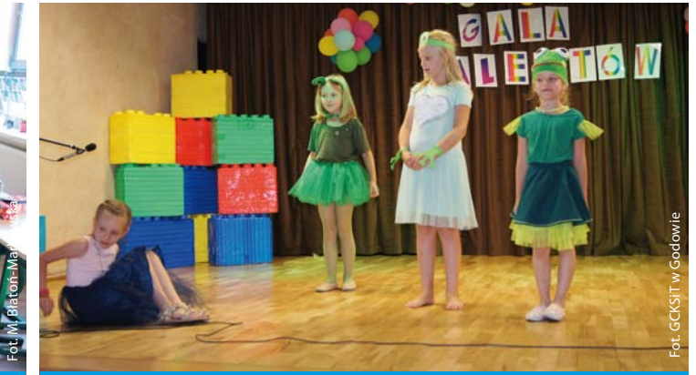
Gala talentów w OK w Skrzyszowie, 19.06.2018 r.