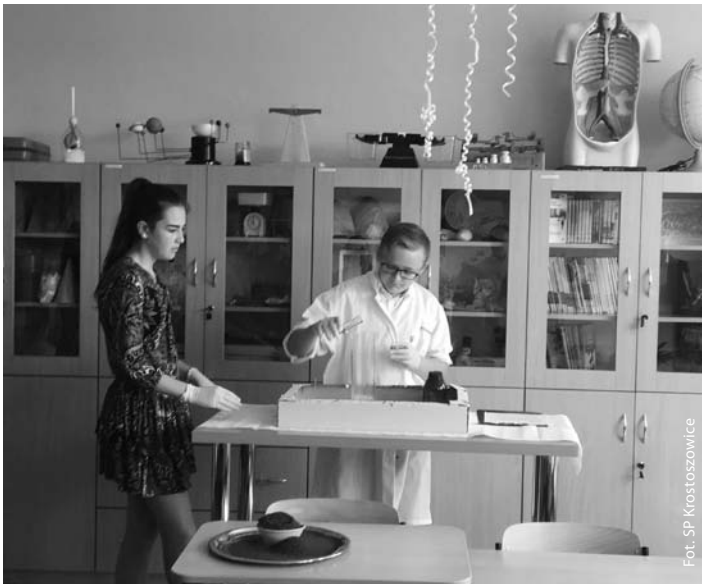
Zielona pracownia w Krostoszowicach

22 maja br. w Szkole Podstawowej w Krostoszowicach odbyło się oficjalne otwarcie Zielonej Pracowni. Przypomnijmy, że w 2017 roku szkoła ta jako jedyna w powiecie wodzisławskim, biorąc udział w konkursie „Zielona Pracownia 2017” otrzymała wsparcie z WFOŚiGW w Katowicach w kwocie 32 488,00 zł.