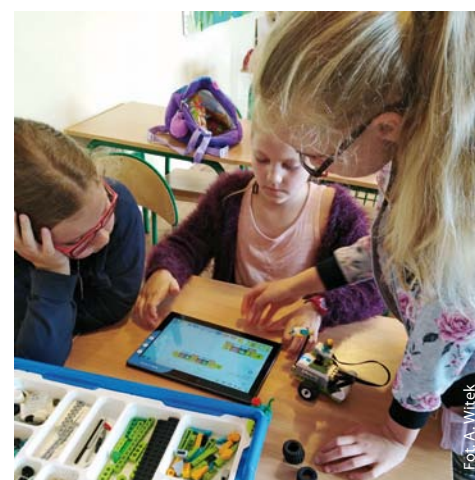
Programowanie uczniów z IIIb z SP Skrzyszów z zestawami LEGO WeDo 2