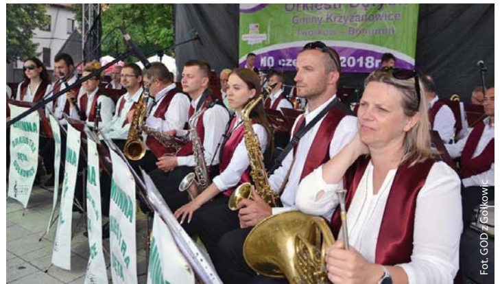
Sukces Gminnej Orkiestry Dętej z Gołkowic, 10.06.2018 r.