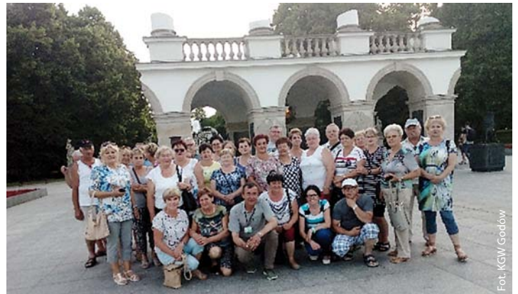
Koło Gospodyń Wiejskich z Godowa w Warszawie