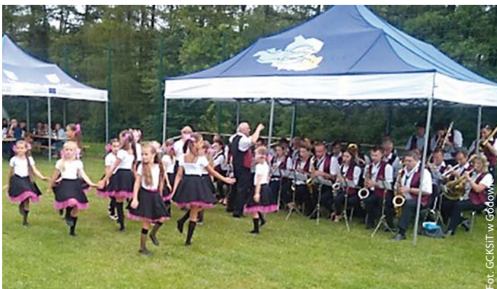
Koncert Orkiestr Dętych w Skrbeńsku, 09.06.2018 r.