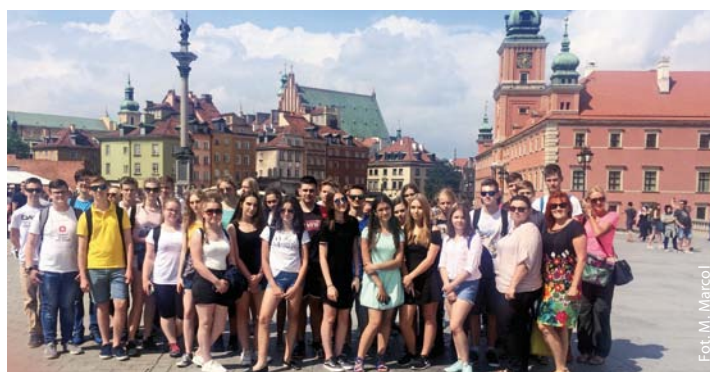
Prymusi na Placu Zamkowym w Warszawie