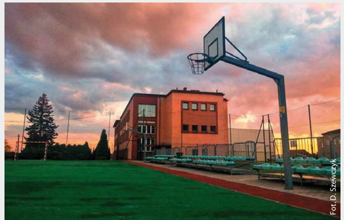
Boisko szkolne przy SP w Skrzyszowie, 2018 r.