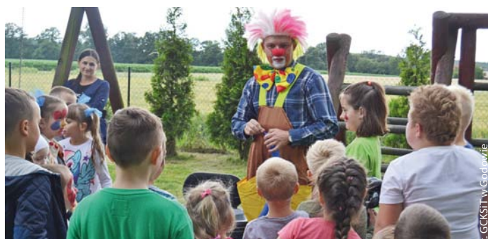
Piknik Rodzinny w Podbuczu, 30.06.2018 r.