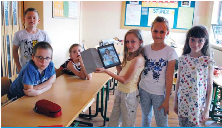
Skrzyszowska MegaMisja z Psotnikiem zakończona