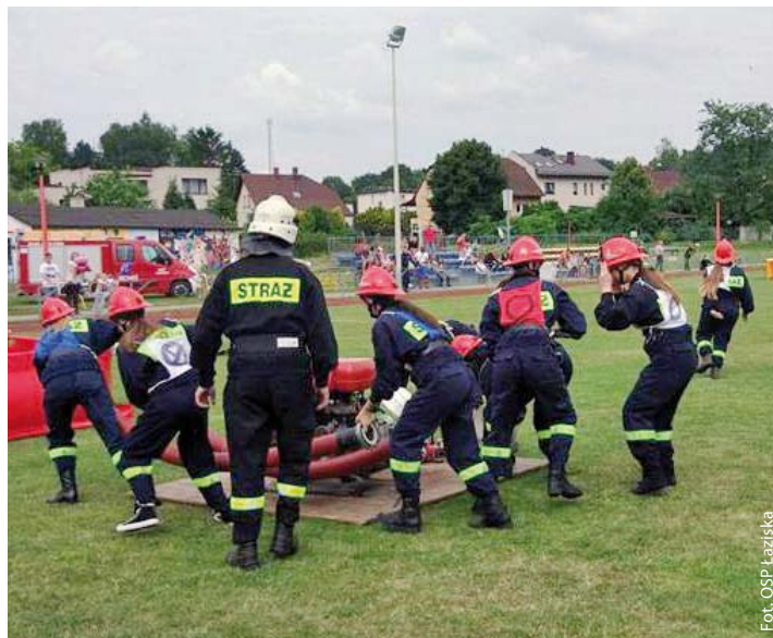
Gminne zawody strażacko-pożarnicze w Godowie, 16.06.2018 r.