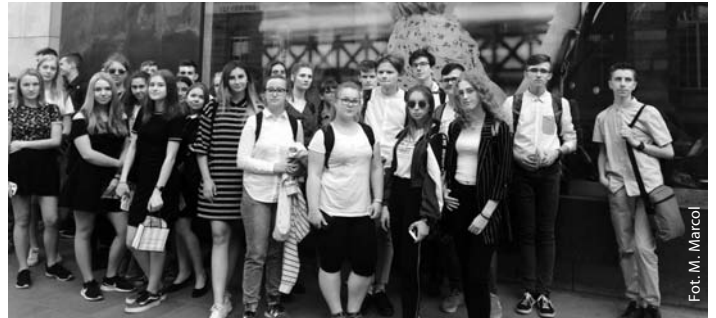
Prymusi w Warszawie w oczekiwaniu na punkt kulminacyjny wycieczki