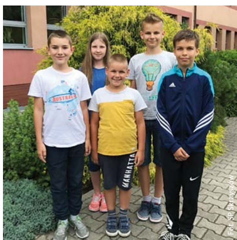
Matematyczne sukcesy uczniów ze Szkoły Podstawowej w Skrzyszowie