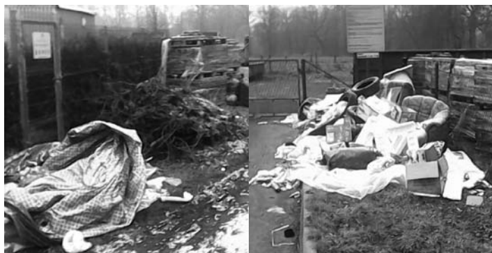
Przykłady karygodnego porzucenia odpadów pod bramą PSZOK

Referat Inwestycji, Ochrony Środowiska i Gospodarki Komunalnej