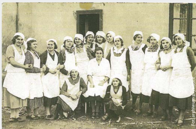
Koło Gospodyń Wiejskich z Gołkowic, lata 30. XX w.