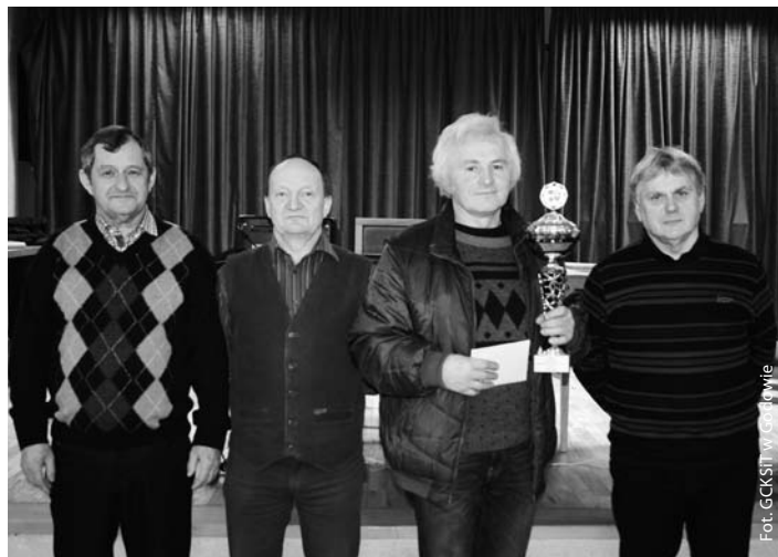
Turniej skatowy o puchar Ośrodka Kultury w Skrzyszowie, 4.03.2018 r.