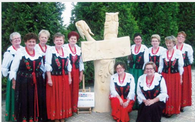
Koło Gospodyń Wiejskich z Gołkowic w nowych strojach ufundowanych przez Radę Sołecką oraz sołtysa Gołkowic, 2017 r.