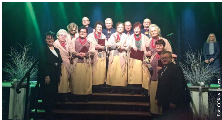
Zespół Familijo ze Skrzyszowa na Wojewódzkim Przeglądzie Kolęd – Suszec 2018