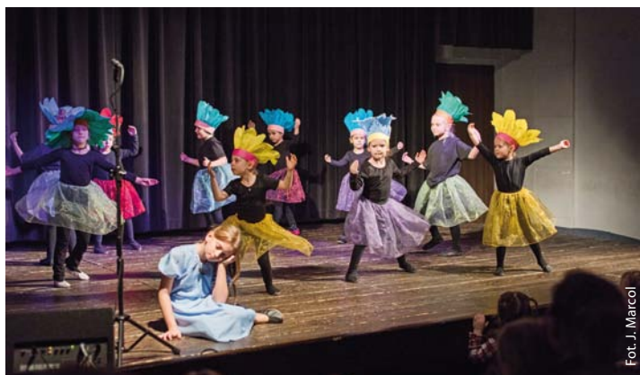
Spektakl „Królowa Śniegu” w Ośrodku Kultury w Gołkowicach, 23.02.2018 r.