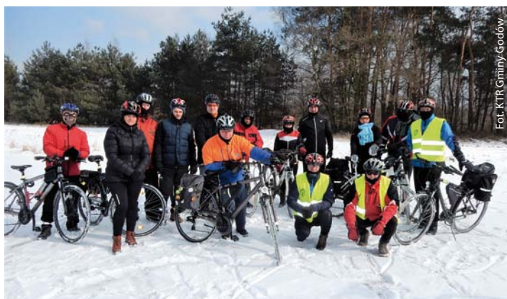
Rowerowy Rajd Bałwana z okazji 10-lecia Koła Turystyki Rowerowej Gminy Godów, 25.02.2018 r.