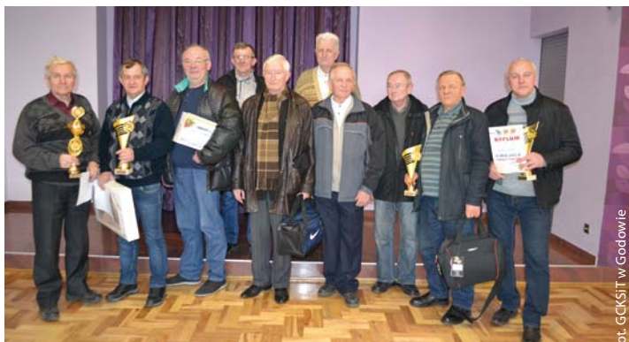
Gminny Turniej Skata w Gołkowicach, 3.03.2018 r.