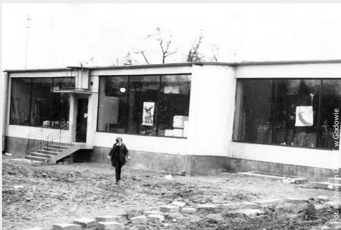
Budynek Gminnej Spółdzielni w Skrzyszowie ul Wyzwolenia, 1968 r.