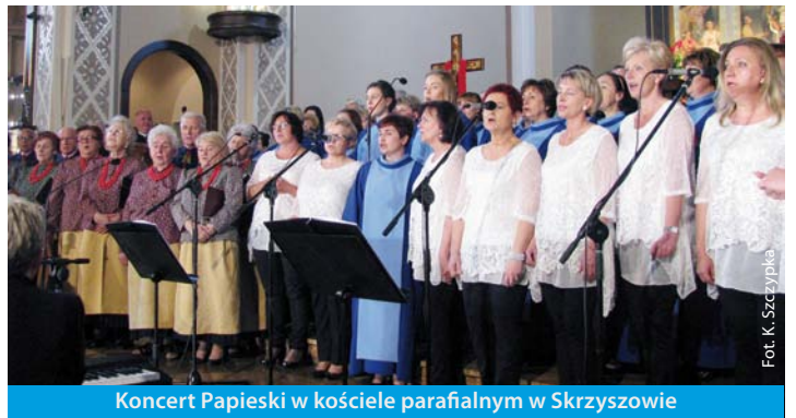
Koncert Papieski w kościele parafialnym w Skrzyszowie