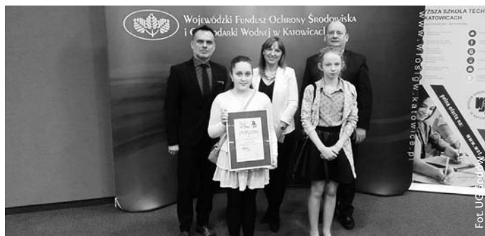
SP w Krostoszowicach finalistą trzeciej edycji „Zielona Pracownia 2017”

Referat Funduszy Zewnętrznych i Zamówień Publicznych