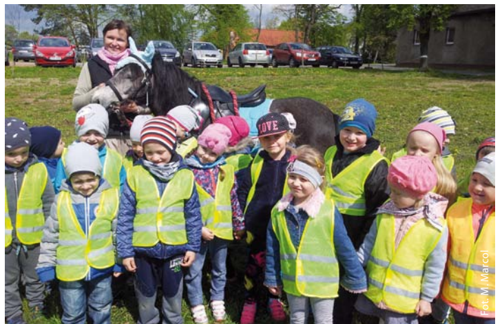
Przedszkolaki z Godowa na spotkaniu z kucykiem