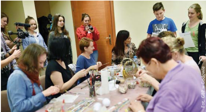
Warsztaty młodzieżowego projektu „Fest fajny quest”, realizowanego przez GBP w Godowie