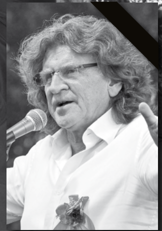
ZBIGNIEW WODECKI † 22.05.2017 r.