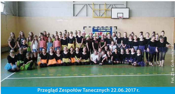
Przeгляд Zespołów Tanecznych 22.06.2017 r.