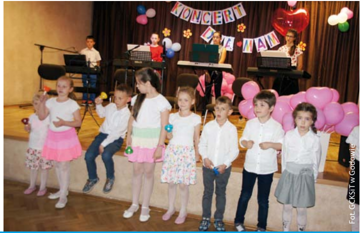
Koncert dla mam w skrzyszowskim Ośrodku Kultury