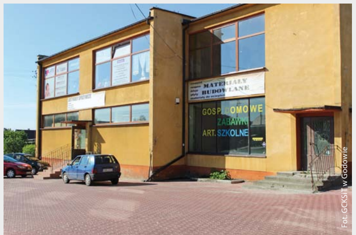
Budynek Gminnej Spółdzielni, 2017 r.