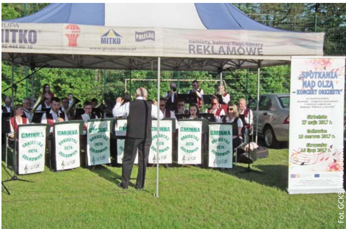
Występ Gminnej Orkiestry Dętej podczas festynu rodzinnego w Skrzebsku