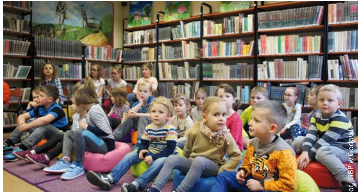
Mali widzowie na spektaklu „Zaczarowany młynek” w GBP w Godowie