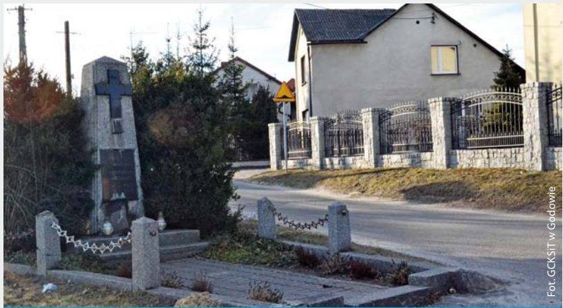
Pomnik „Poległym za wolność” – luty 2017 r.