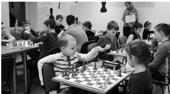
Biblioteczny turniej szachowy