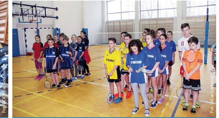
Gminny Turniej Badmintona w Godowie