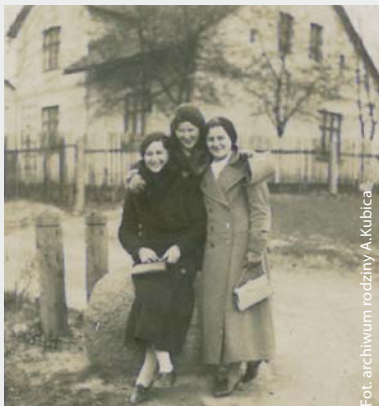
Młode mieszkanki Gołkowic na ul. 1 Maja. 1936 r.