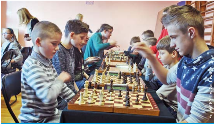
Gminny Turniej Szachowy im. Pastora Marcina Lukasa w Skrbeńsku