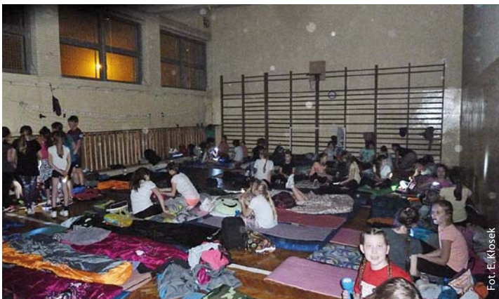
Noc pełna wrażeń w Zespole Szkół w Gołkowicach