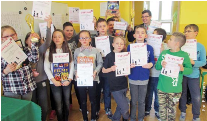
Turniej Szachowy w Godowie zrealizowany z inicjatywy Ochotniczej Straży Pożarnej w Godowie