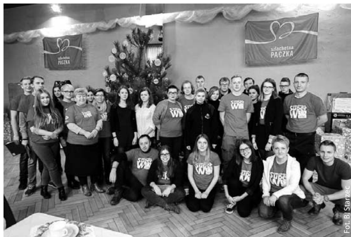
Wolontariusze Rejonu Wodzisław Śląski

Lider Rejonu Szlachetna Paczka Wodzisław Śląski Zachód