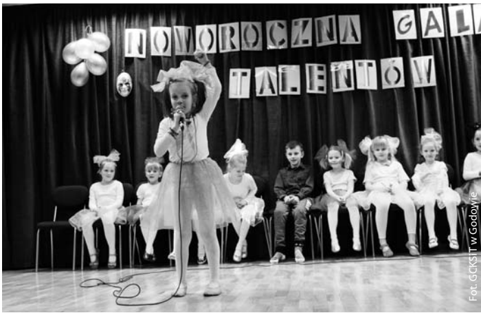
Występy małych uczestników zajęć w Skrzyszowie

Ośrodek Kultury w Skrzyszowie organizuje wiele zajęć dla dzieci i młodzieży. Spotykają się co tydzień, pracując nad techniką, umiejętnościami, układem... I jest taki dzień, w którym efekty tej pracy możemy uroczystie podziwiać. W bieżącym roku tym dniem była środa 11 stycznia – Noworoczna Gala Talentów – niejako święto twórczości artystycznej naszych podopiecznych. Scenę naszego ośrodka wypełniali uczestnicy tzw. zajęć stałych. Zaprezentowali się instrumentalni, grając na gitarze i keyboardzie, wystąpiła grupa teatralna Kreatywna Zgraja oraz grupa taneczna Rytmix. Prace uczestników zajęć w pracowni ceramicznej podziwialiśmy w korytarzu, gdzie były eksponowane ich dzieła. Noworoczna Gala Talentów skrzyszowskiego ośrodka miała w tym roku drugą edycję i myślę że wszyscy możemy być dumni z efektów pracy uczestników jak i instruktorów.