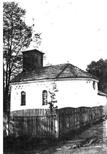
Kaplica ok. 1952 r.