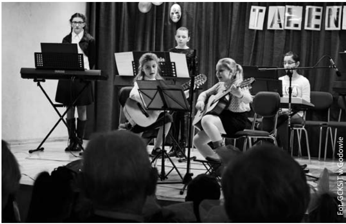
II Noworoczna Gala Talentów w Ośrodku Kultury w Skrzyszowie