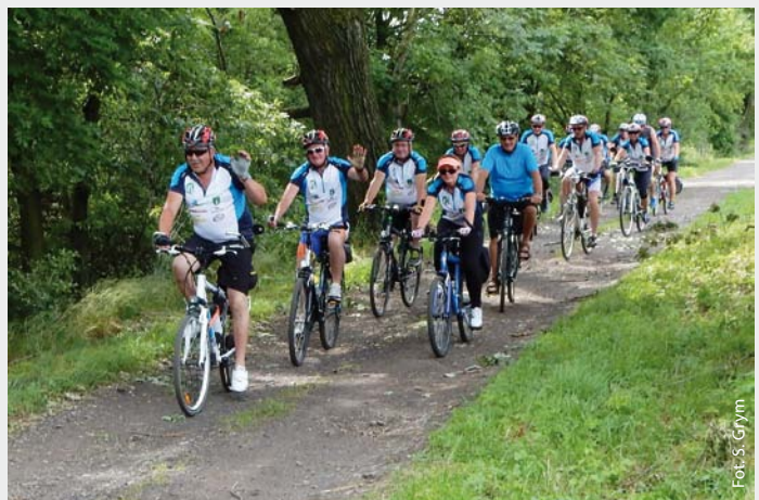
Na rowery i do Piotrowic. Skrbeńsko 1937 r.