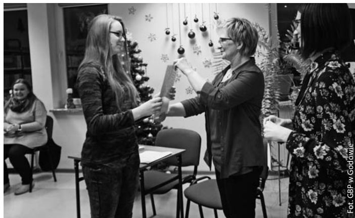
Laureatka pierwszego miejsca w konkursie „Szok twórczości kolędowej”