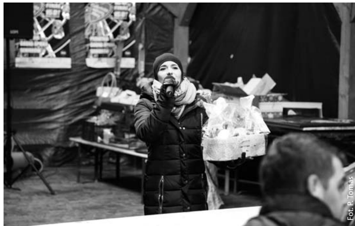
WOŚP w Godowie

P.S. Więcej zdjęć i informacji na naszym fanpage’u na Facebooku: www.facebook.com/wospgodow/