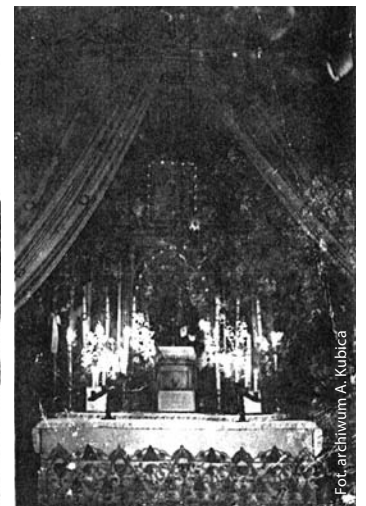
Wnętrze kaplicy w Skrbeńsku