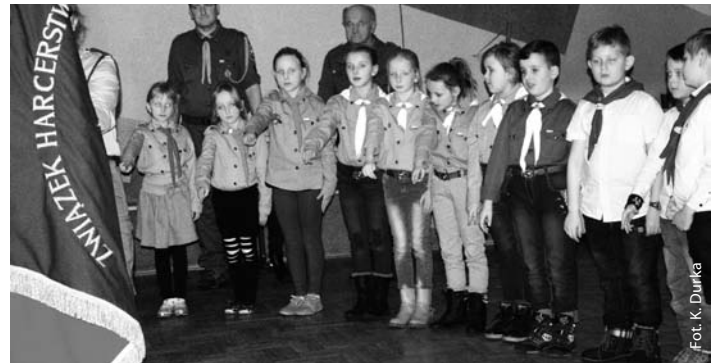
Kołędowanie Gromady Zuchowej „Przyjaciele Lasu”