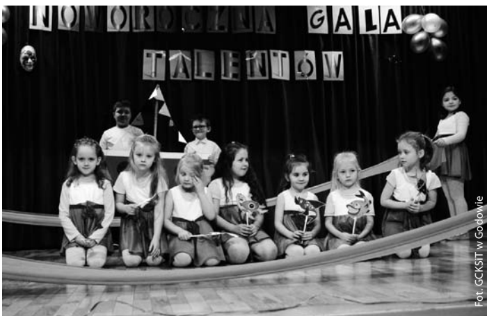
II Noworoczna Gala Talentów w Ośrodku Kultury w Skrzyszowie