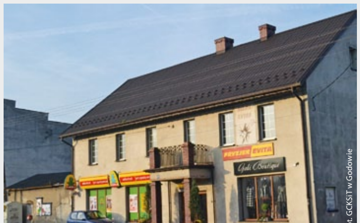
Godów, budynek obecnie