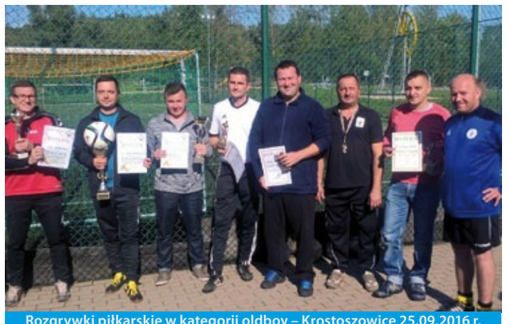
Rozgrywki piłkarskie w kategorii oldboy – Krostoszowice 25.09.2016 r. (więcej na str. 4)