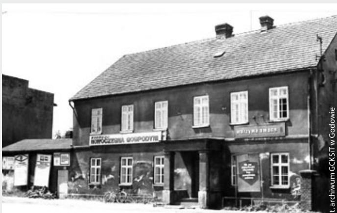
Godów, budynek przy ulicy 1 Maja, lata 70.