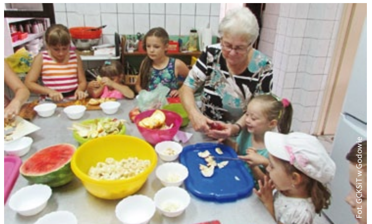
Wakacyjne zajęcia w OK Skrbeńsko