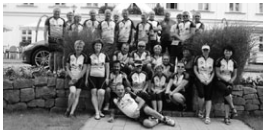
Wycieczka rowerowa Koła Turystyki Rowerowej gminy Godów ścieżkami pogranicza Polski i Czech