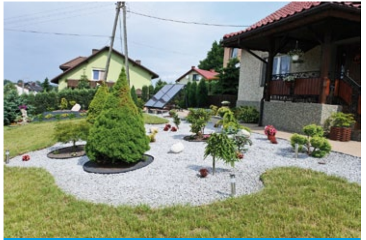
Ogród Janiny Potysz z Godowa – II miejsce w konkursie gminnym (więcej na str. 4)