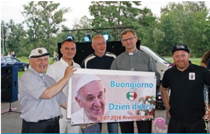
Świątowe Dni Młodzieży w Krostoszowicach (więcej na str. 5)