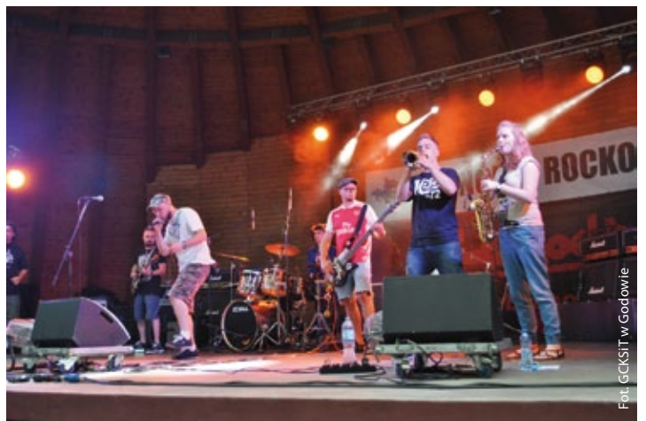
Koncert Rockowy w Godowie – Zespół Drenkrom (więcej na str. 5)