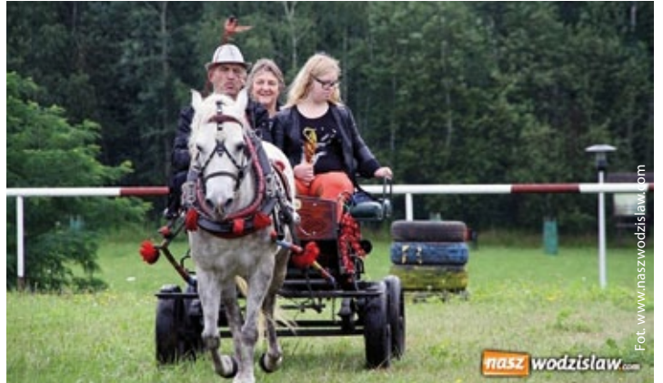
IX Pokaz Konia Śląskiego (więcej na str. 5)