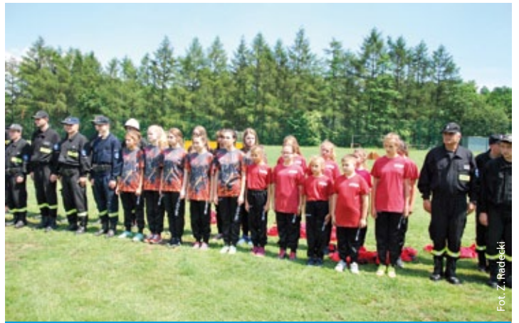
Gminne zawody pożarnicze w Skrbeńsku (więcej na str. 5)