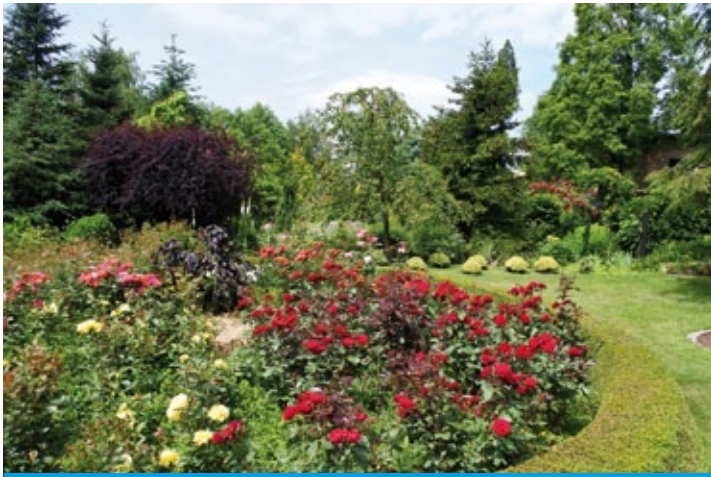
Ogród Jana Szczepanka z Łazisk – I miejsce w konkursie gminnym (więcej na str. 4)