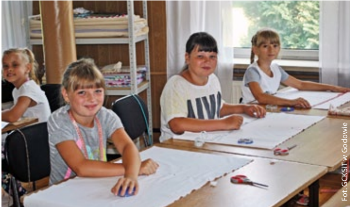
Wakacje w OK w Godowie. Zajęcia w ramach projektu Malowana tkanina