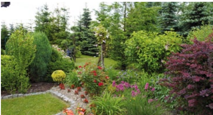
Ogród Bogusławy Kaszta z Gołkowic – III miejsce w konkursie gminnym (więcej na str. 4)