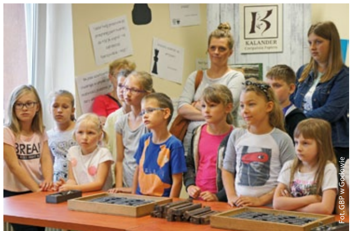
Warsztaty drukarskie (więcej na str. 4)