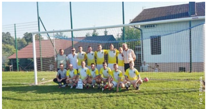
LKS Polonia Łaziska – zwycięska drużyna Gminnego Turnieju Piłki Nożnej Seniorów (więcej na str. 5)