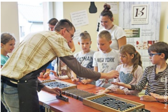
Warsztaty drukarskie (więcej na str. 4)