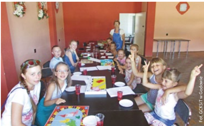
Wakacje w OK Skrbeńsko