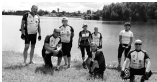
Wycieczka rowerowa Koła Turystyki Rowerowej gminy Godów ścieżkami granicznych Meandrów Odry