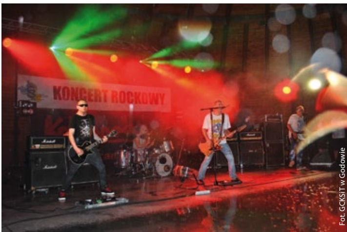
Koncert Rockowy w Godowie – Zespół Kobranocka (więcej na str. 5)