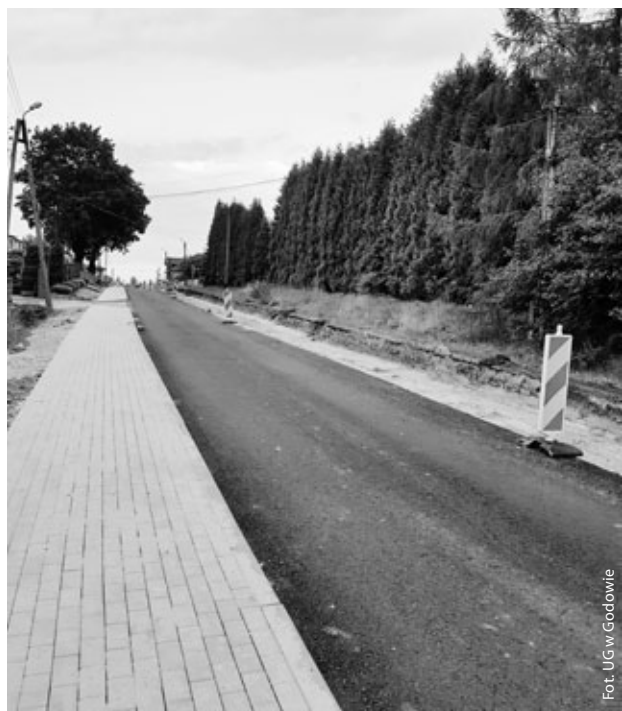
Drogi na pierwszym planie

Trwają oczekiwane remonty dróg w Skrzyszowie. Stan dróg i uzupełniającej infrastruktury ul. 1 Maja oraz ul. Wyzwolenia od dawna wymagał interwencji. Gmina Godów wraz z Powiatem Wodzisławskim podjęły wspólne starania o dofinansowanie realizowanych obecnie inwestycji z rządowego programu rozwoju gminnej i powiatowej infrastruktury drogowej na lata 2016-2019. Pomimo dużej konkurencji wspólnie samorządom udało się pozyskać fundusze i dzięki temu możliwa jest nie tylko wymiana nawierzchni, ale również przebudowa kanalizacji burzowej, chodników, budowa miejsc postojowych, zatoczek autobusowych oraz wprowadzenie rozwiązań zwiększających bezpieczeństwo użytkowników dróg. Całość robót ma zostać zakończona w IV kwartale 2016 r.