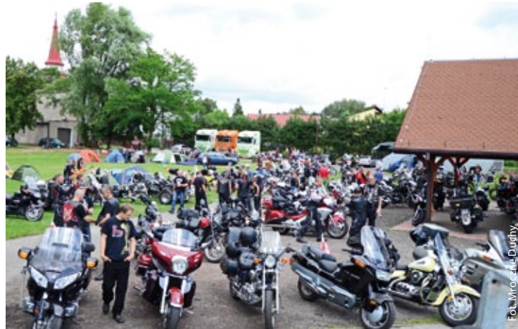
Mroczny Zlot Motocyklowy w Godowie (więcej na str. 4)

Organizatorzy Dożynek Gminnych w Godowie zapraszają do wzięcia udziału w konkursie na najładniej przystrojona pryczepe biorącą udział w korowodzie dożynkowym