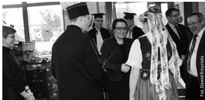
Powitanie w progach gimnazjum

5 lutego w Gimnazjum w Gołkowicach miało miejsce wyjątkowe wydarzenie – wizyta Minister Edukacji Narodowej – Anny Zalewskiej.