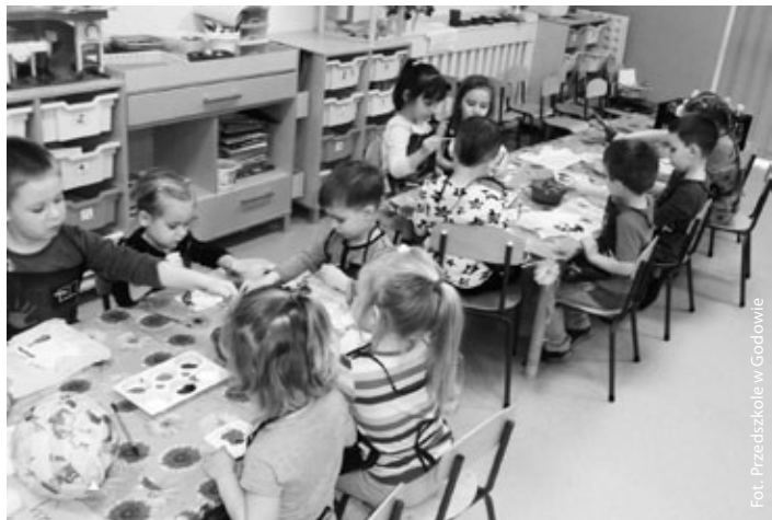
Mali Artysty w przedszkolu w Godowie