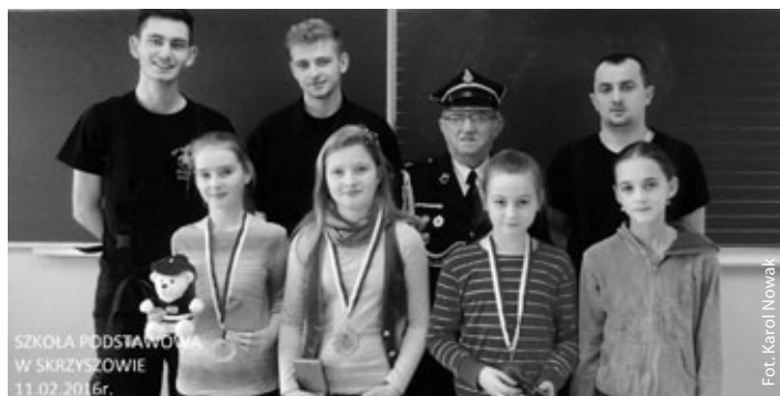
Turniej wiedzy pożarniczej