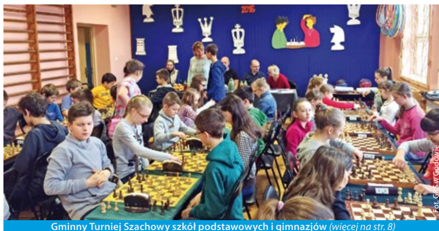
Gminny Turniej Szachowy szkół podstawowych i gimnazjów (więcej na str. 8)