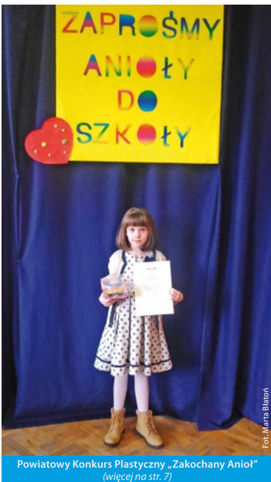
Powiatowy Konkurs Plastyczny „Zakochany Anioł” (więcej na str. 7)