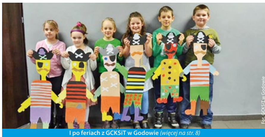
I po feriach z GCKSiT w Godowie (więcej na str. 8)