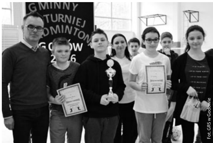
Gminny Turniej Badmintonu