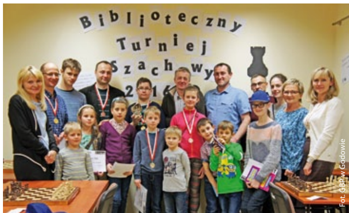
Wszyscy uczestnicy BTS