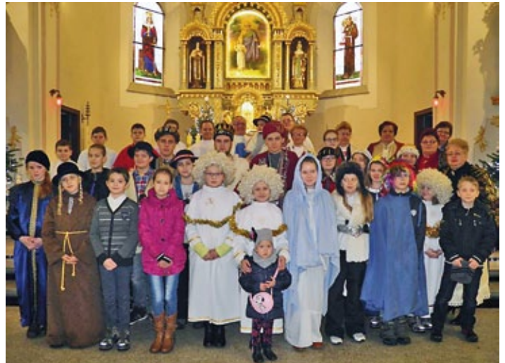
Uczestnicy orszaku Trzech Króli