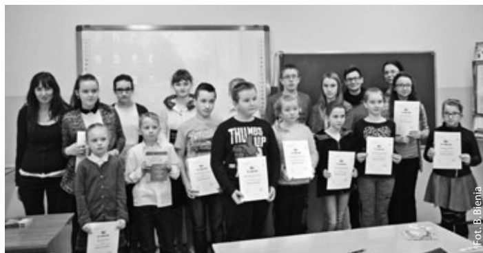
Wszyscy uczestnicy konkursu ortograficznego