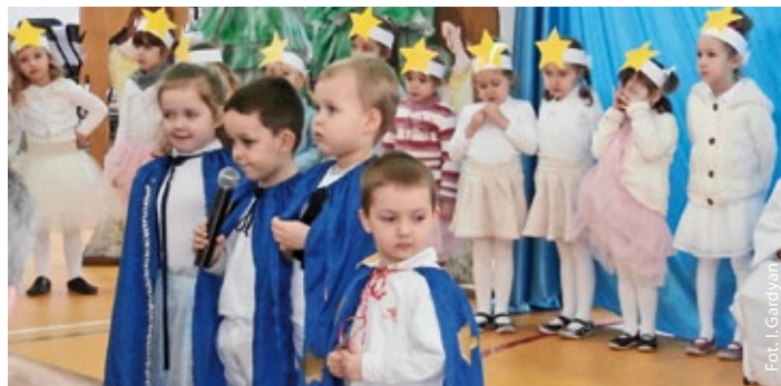
Krasnoludki w czasie występu

W Przedszkolu Publicznym w Godowie zapraszanie babć i dziadków na uroczystość z okazji ich święta jest tradycją na stałe wpisaną w repertuar imprez przedszkolnych. Są to dni niezwykle, nie tylko dla dzieci, ale przede wszystkim dla zaproszonych gości, gdyż Babcia i Dziadek to bardzo ważne osoby w życiu każdego dziecka. To dni pełne uśmiechów, wzruszeń, dumy, łez i radości.