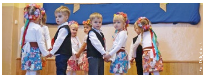
Występ Serduszek z okazji Dni Babci i Dziadka