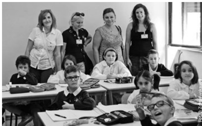
Uczestniczki szkolenia w Rzymie

W celu poznania funkcjonowania włoskich szkół od podstawki, nauczycielki zawitały również do rzymskiej szkoły podstawowej oraz do