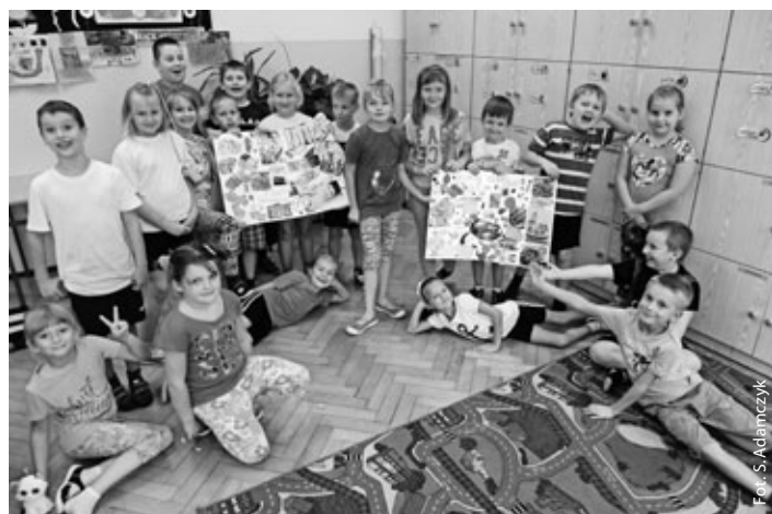
Plakaty klasy 2B