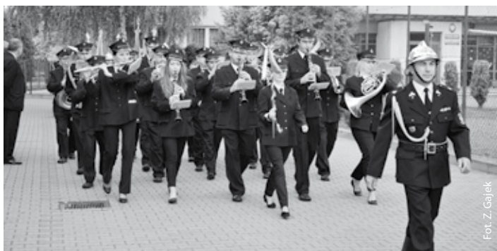
Prowadzący kolumnę strażaków