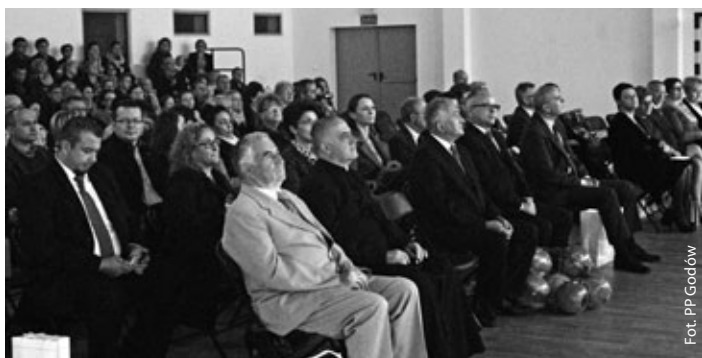
Goście na otwarciu przedszkola