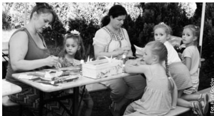
Atrakcje dla dzieci