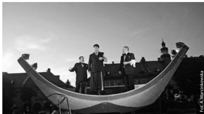
Teatr Wodzislawskiej Ulicy i fontanna w roli tratwy