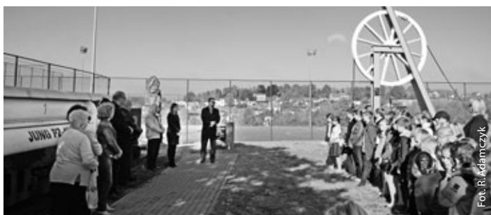
Na miejscu tragedii sprzed lat

W poniedziałek, 28 września br., w krostoszowickiej szkole obchodzona była 46. rocznica tragicznej śmierci górników w VII szybie byłej KWK 1 Maja usytuowanym niegdyś przy krostoszowickim kompleksie rekreacyjno-sportowym Orlik.