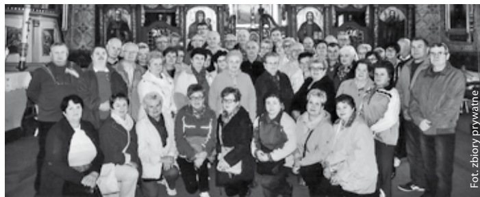
Emeryci ze Skrzyszowa w dawnej cerkwi w Szczawniku

Pośród górskich dolin Beskidu Sądeckiego, niczym w niecce, skryta jest miejscowość Krynica-Zdrój (potocznie zwana Krynica), którą w dniach 2-8.09 br. odwiedzili skrzyszowscy emeryci.