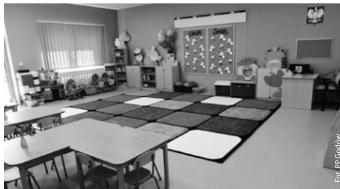
Sala w nowym przedszkolu