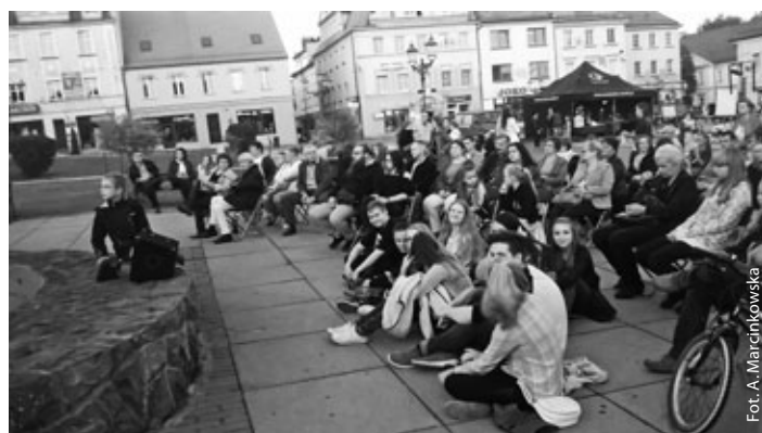
Młodzież w oczekiwaniu na spektakl „Na pełnym morzu”