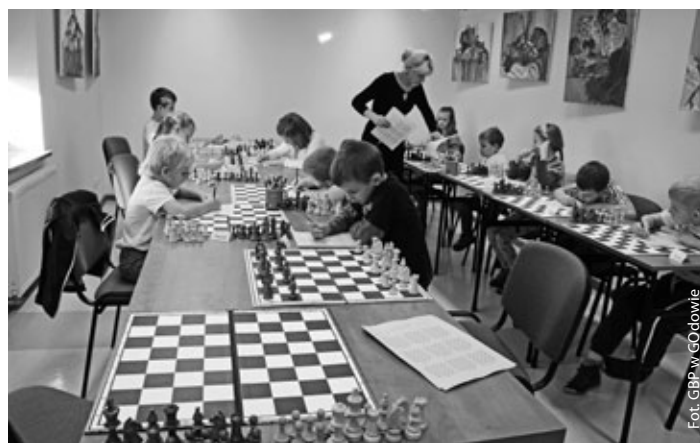
Nauka gry królewskiej