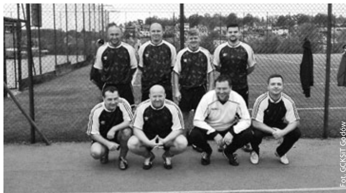
Oldboje – drużyna gospodarzy