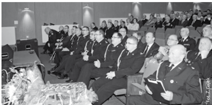
Strażacy i ich goście na części oficjalnej