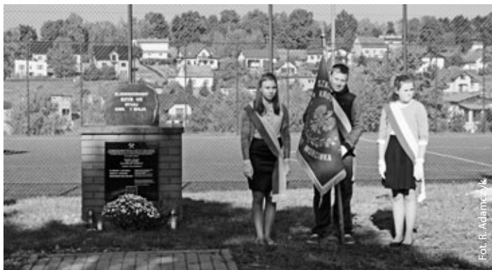
W hołdzie zmarłym górnikom