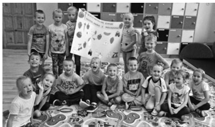
Plakaty klasy 1C