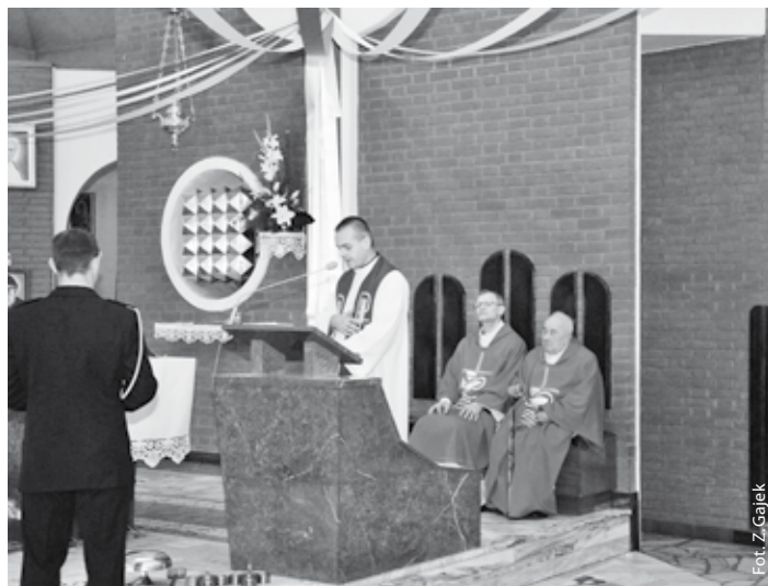
Msza św. w intencji strażaków