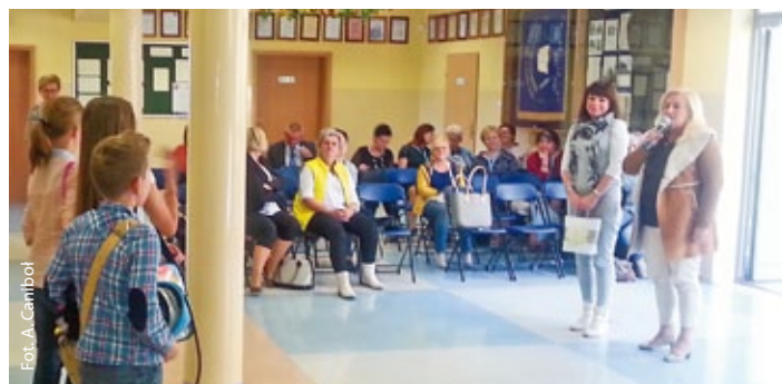
Wystąpienie gości ze Starego Miasta