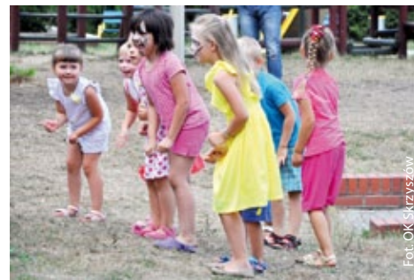
Klimat dla dziewczynek

W upalnym 9 dniu sierpnia odbyła się kolejna impreza z cyklu Muzyczne Niedziele na Kręgu . Na scenie wystąpiła czeska orkiestra Malá černá hudba z Karwiny. Panie z Klubu Kobiet w Piotrowicach przygotowały regionalne knedle z mięsem i kapustą, były też czeskie kołoczki i ptysie. Wszystko przyrządzone według oryginalnych czeskich przepisów. Mocnym punktem imprezy był pokaz tań-