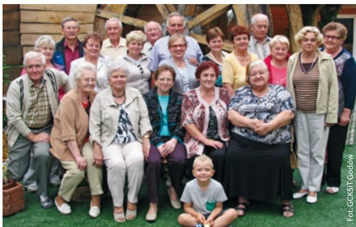
Przed Starą Wędzarnią