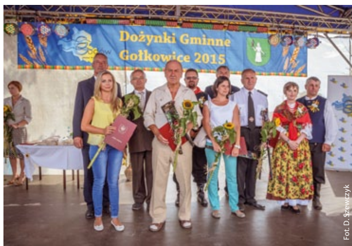
Fot. D. Szewczyk