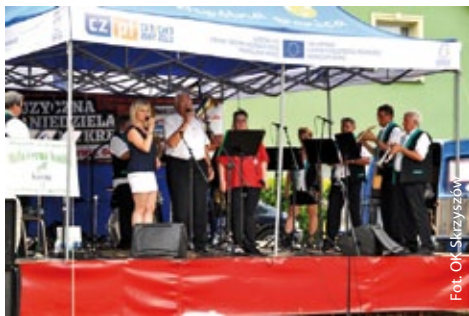
Malá černá hudba