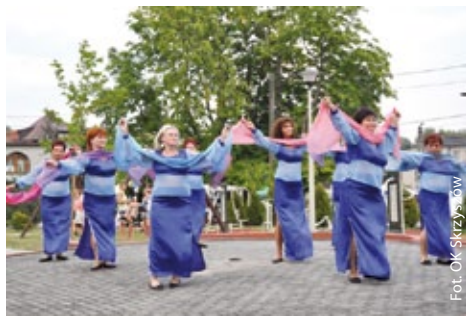
Taniec w wykonaniu Zuchwałych Małżonek