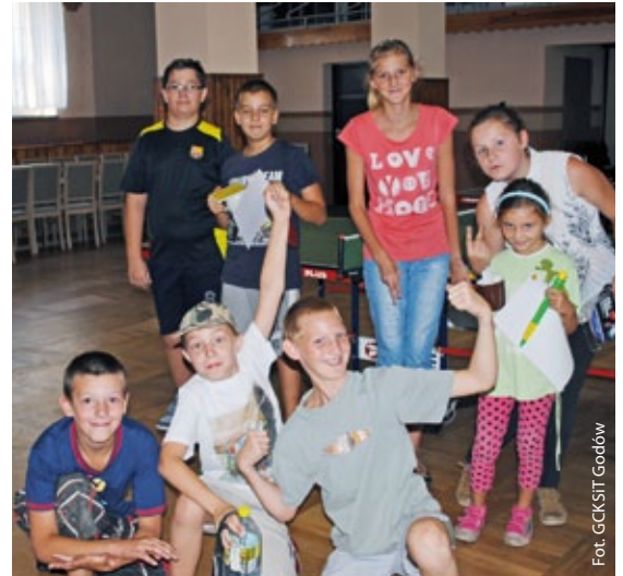
Po turnieju tenisa stołowego

Z wakacjami bywa tak, że zawsze są za krótkie. Niestety. A te, wyjątkowo upalne, obfitowały w mnóstwo atrakcji, które zorganizowało Gminne Centrum Kultury, Sportu i Turystyki w Godowiu.