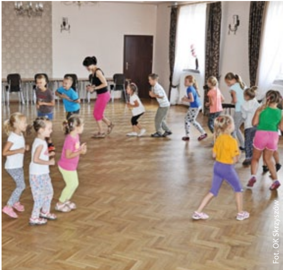
Zajęcia z aerobiku w Skrzyszowie