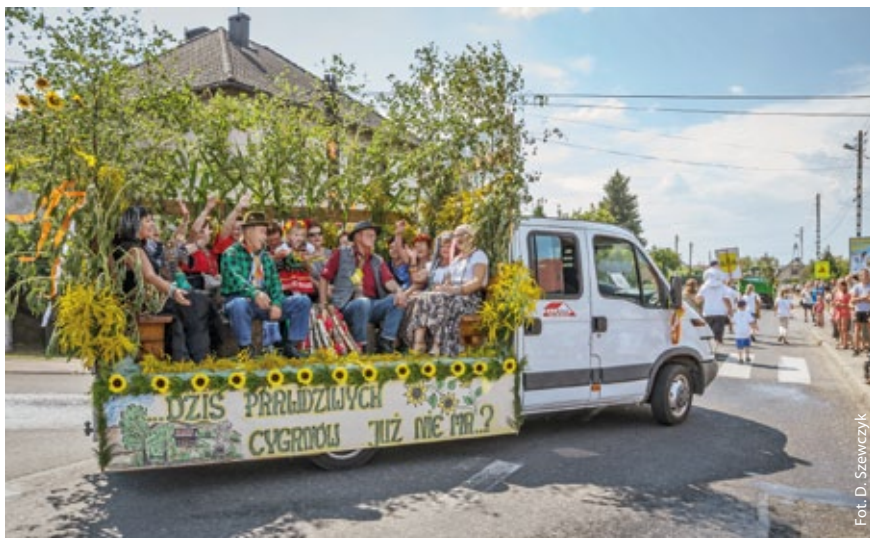
Fot. D. Szewczyk