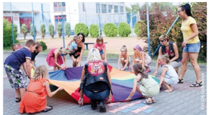
Festynik w Gołkowicach

W Skrzyszowie dla najbardziej aktywnych fizycznie był aerobik, a dla tych, którzy uwielbiają prace manualne, odbywały się twórcze poranki oraz muzyczne festyny na kręgu, które z roku na rok cieszą się coraz większym zainteresowaniem. W Gołkowicach wiele działo się na deskach teatralnych. Kto znalazł w sobie odwagę, mógł uczestniczyć w próbach teatralnych albo dać się ponieść emocjom na warsztatach tanecznych. Dla pozostałych były bajki w kinie albo tworzenie plastycznych cudów. Godów w tym roku to było królestwo gier, zabaw i konkursów. Miłośnicy tańców i prac rękodzielniczych także znaleźli tu coś dla siebie. Zaś Ośrodek Kultury w Skrzeńsku był w tym roku bardzo roztańczony i plastyczny. Dzieci mogły też wziąć udział w turniejach, a podsumowanie wakacji odbyło się podczas pikniku. Również na Podbuczu odbywały się dla najmłodszych zajęcia świetlicowe.