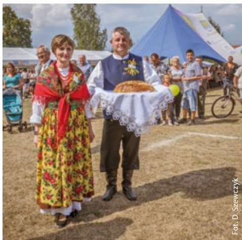
Fot. D. Szewczyk