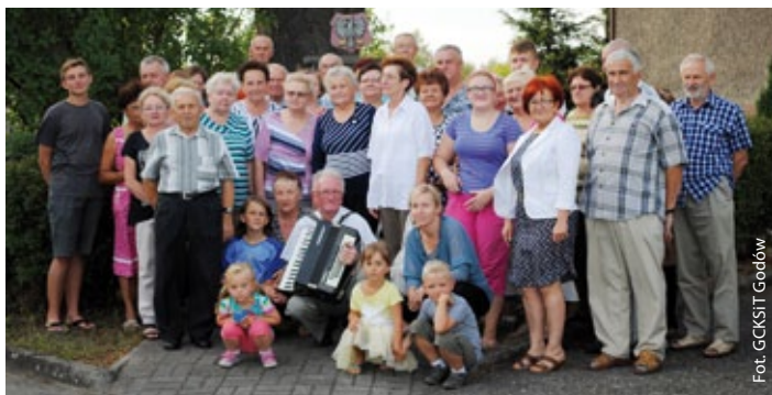
Uczestnicy spotkania przy pomniku