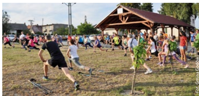
Rozgrzewka przed biegiem