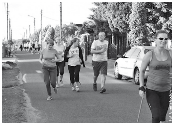
Najważniejsze to dobry humor i kondycja