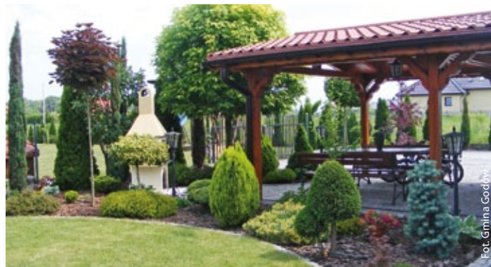
Ogród K. Łukszy

Referat Inwestycji, Ochrony Środowiska i Gospodarki Komunalnej