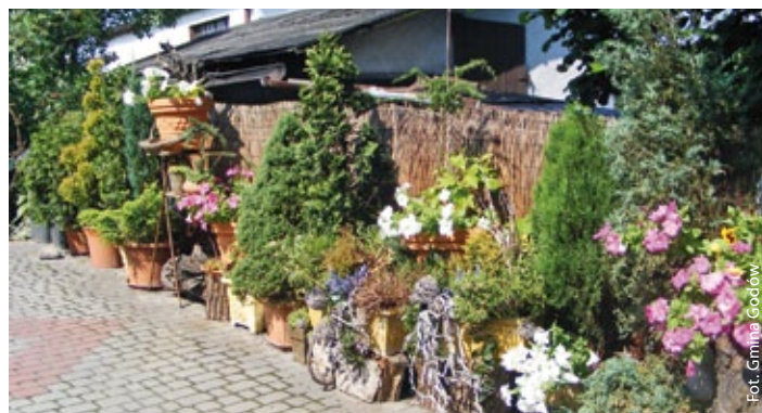
Ogród G. Wójtowicz