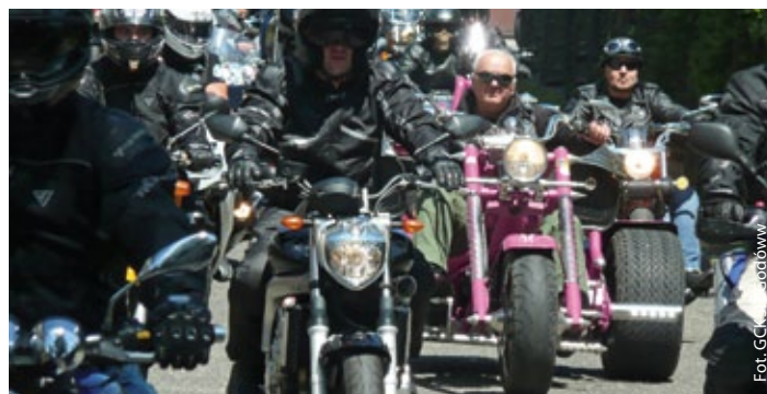
Podziw i strach w jednym

Gośćmi honorowymi tegorocznego Święta Plonów będą: