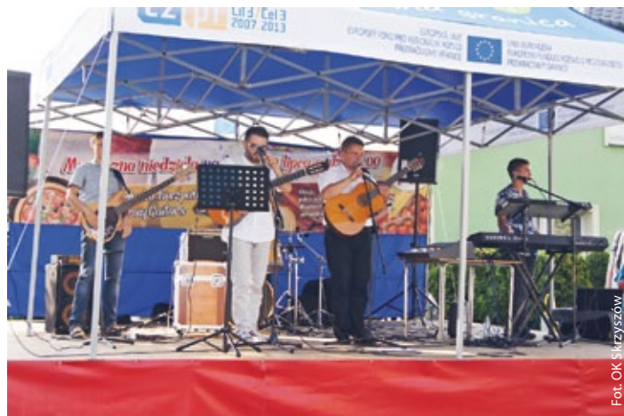
Hiszpańskie Gitary w akcji