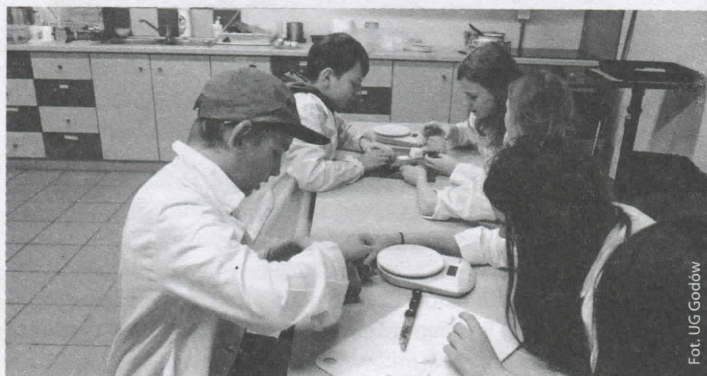
Uczestnicy warsztatów w humanitarium

W maju 2015 roku w szkołach podstawowych zakończył się projekt „Przygoda z edukacją”. Uczestniczyło w nim 346 uczniów z klas I-VI. Podczas jego realizacji zapewniono uczniom szereg warsztatów rozwijających kluczowe kompetencje matematyczno-przyrodnicze, naukowo-techniczne, posługiwania się językiem ojczystym i obcym, ekspresji kulturalnej i historycznej w formie zajęć przyrodniczych i społeczno-obywatelskich. W zajęciach z kształcenia kompetencji kluczowych uczestniczyło 249 uczniów. Uczniowie poznali tam zjawiska przyrodnicze, zapoznali się z historią naszego regionu, składali modele, poznali różne techniki tańca oraz tajniki aktorstwa. Z kolei podczas zajęć pedagogiczno – psychologicznych uczniowie rozwijali umiejętności porozumiewania się, komunikowania oraz poczucia przynależności do grupy. Natomiast w trakcie zajęć dydaktyczno-wyrównawczych nabyli umiejętności, które przyczynią się do osiągnięcia przez nich sukcesów szkolnych. W ramach projektu uczniowie nie tylko nabyli teoretyczną wiedzę, ale również zdobyli umiejętności praktyczne z wykorzystaniem zakupionego w ramach projektu sprzętu. Prowadzący wszelkiego typu zajęcia nauczyciele i pedagodzy mieli zapewnione różnorodne pomoce dydaktyczne odpowiednie do stworzonych przez nich programów. Co należy podkreślić, wszystkie szkoły zostały wyposażone w materiały, pomoce i sprzęt multimedialny.