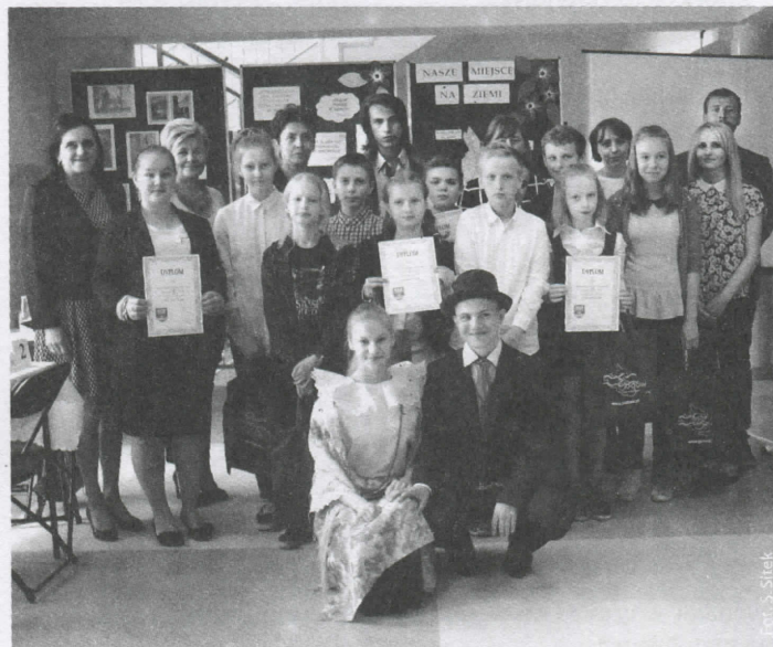
Wszyscy uczestnicy konkursu