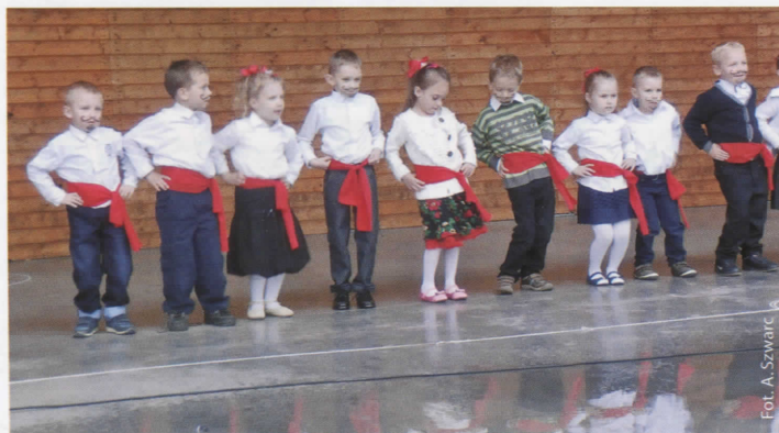
Dzielne Smerfy na festynie