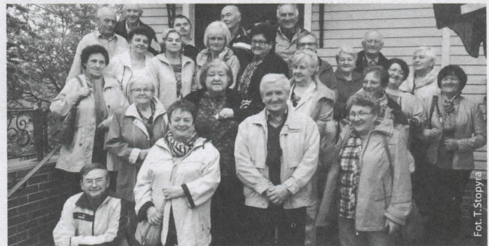
Familijo w Mosznej