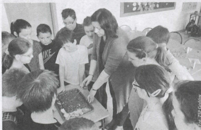
Prezentacja czekoladowych ułamków