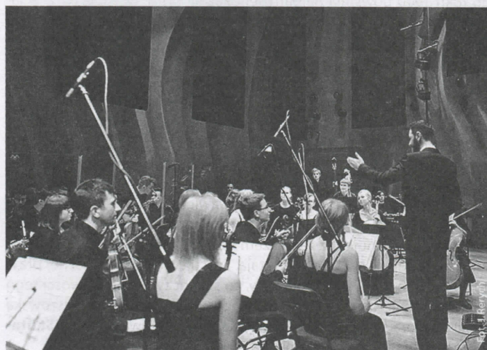
Koncert w siedzibie Narodowej Orkiestry Symfonicznej Polskiego Radia