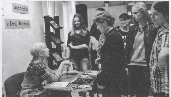
Rozmowa nie tylko o literaturze

W ramach Tygodnia Bibliotek 14 maja Gminna Biblioteka Publiczna w Godowie zaprosiła uczniów na spotkanie autorskie z mistrzynią słowa, autorką popularnych książek dla młodzieży – Ewą Nowak . Gimnazjaliści wcześniej nie tylko przeczytali książki pani Ewy, ale również przygotowali pytania, które chcieli zadać pisarce. Żywiołowość, wielka energia i ogromne poczucie humoru Pisarki towarzyszyły od samego początku spotkaniu, które dodatkowo okazało się nie tylko opowieścią o twórcy i literaturze, ale i niecodzienną lekcją życia.