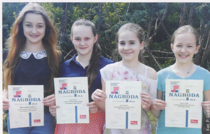
Laureatki Wojewódzkiego Młodzieżowego Festiwalu Muzycznego