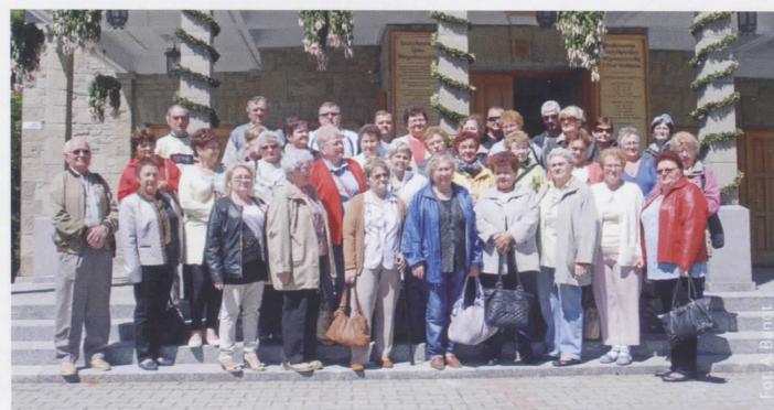
Przed wejściem do sanktuarium