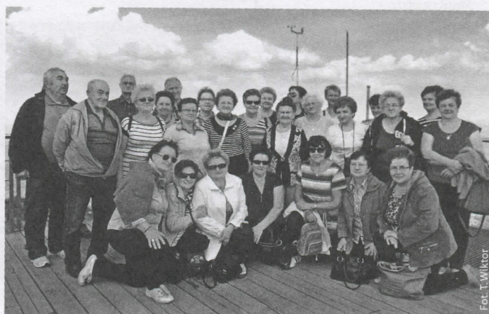
Na tarasie widokowym w Szczyrku