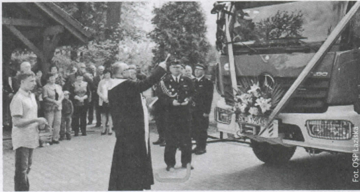
Uroczystość poświęcenia nowego wozu