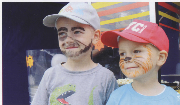
Pomalowane twarze wizytówką najmłodszych

W sobotę, 30 maja, tuż przed Dniem Dziecka odbył się bardzo wyjątkowy festyn rodzinny. Jego wyjątkowość polegała m.in. na niezwykle kapryśnej pogodzie, bogatej ofercie artystycznej i do końca wiernej publiczności. Na scenie można było podziwiać umiejętności uczniów skrzyszowskich szkół w przeróżnych formach artystycznych – od piosenek przez taniec, muzykę instrumentalną aż po turnieje i wyroby biżuterii. Wielką atrakcją imprezy były darmowe zjeżdżalnie, oblegane nieustannie przez dzieci, oraz pokaz ratownictwa drogowego przez OSP Skrzyszów. Festyn zakończył się zabawą taneczną w późnych godzinach nocnych. Jego organizacją zajęły się połączone szeregi dwóch instytucji: Zespołu Szkół w Skrzyszowie i jego Rady Rodziców oraz Ośrodka Kultury w Skrzyszowie.