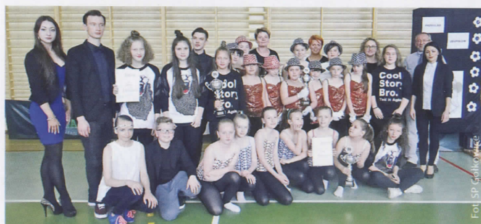
Uczestnicy GPZT w Gołkowicach