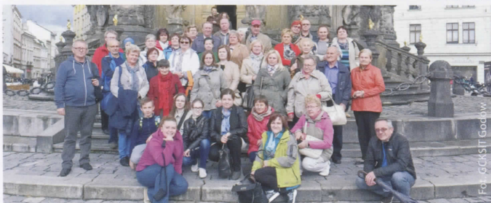
Przed kolumną Trójcy Przenajświętszej