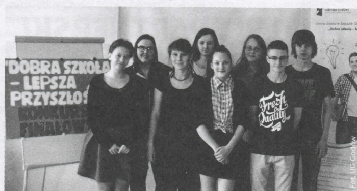
Uczestnicy konkursu z projektu „Dobra szkoła – lepsza przyszłość”

Na zakończenie projektu dla uczniów, którzy byli najbardziej aktywni na zajęciach, przewidziano wycieczki. Pierwsza wycieczka odbyła się 18 marca do Wrocławia. We Wrocławiu uczniowie najpierw zwiedzali ZOO, gdzie mogli podziwiać liczne akwaria, zbiorniki wodne oraz baseny, a w nich m.in. rafę koralową Morza Czerwonego, hipopotamy oraz ryby słodkowodne. Dodatkową atrakcją były pokazy karmienia zwierząt. Kolejnym etapem wycieczki były warsztaty zajęciowe w Ogrodach Doświadczeń – Humanitarium. W laboratorium uczniowie wytworzyli własne mydełka, które później zabrali do domu. Drugą wycieczkę zorganizowano do JuraParku w Krasiejowie, miejsca pełnego niespodzianek. Odkryte tam złoża skamieniałości triasowych płazów i gadów należą do najbogatszych w Europie. Zwiedzanie Ju-