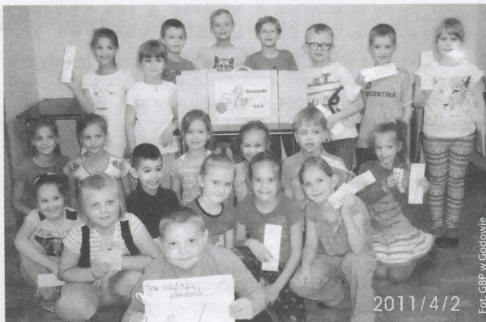
Uczniowie ze Skrzeńska po przedstawieniu Groszków

Wielką gratką dla młodzieży gimnazjalnej z Gołkowic i Skrzyszowa było spotkanie z Ewą Nowak , polską pisarką, której książki cechuje