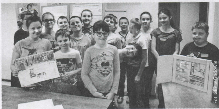
Uczniowie z Godowa