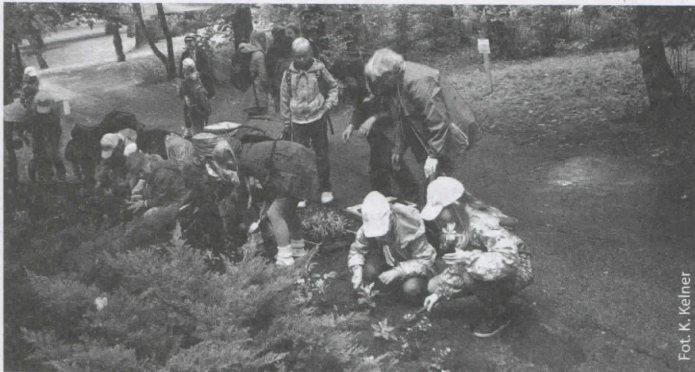
Zuchy podczas sadzenia kwiatów