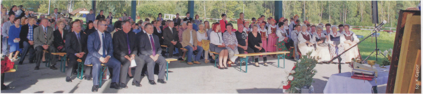
Uczestnicy uroczystej mszy św.