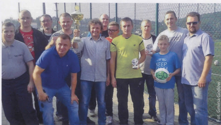
Zwycięska drużyna ze Skrbeńska

spół z Podbuczka osiągnął spory sukces, uzyskując wyróżnienie jury. W Przeglądzie wzięło udział również zespół śpiewaczy Melodia ze Skrbeńska.