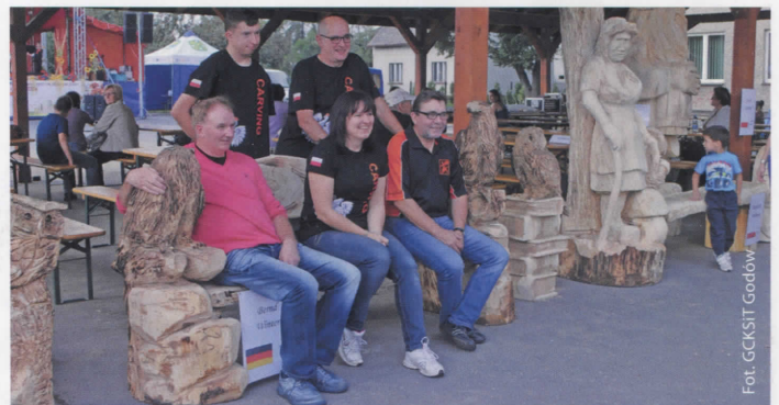
Uczestnicy I MPR w Skrzyszowie