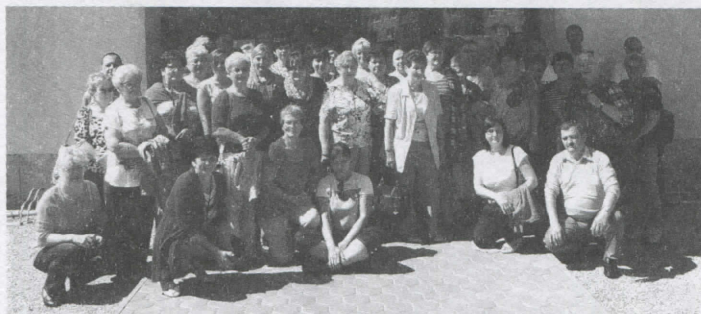
Uczestnicy wyjazdu na Słowację