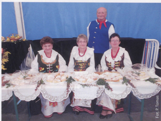
Przedstawicielki KGW z Gołkowic