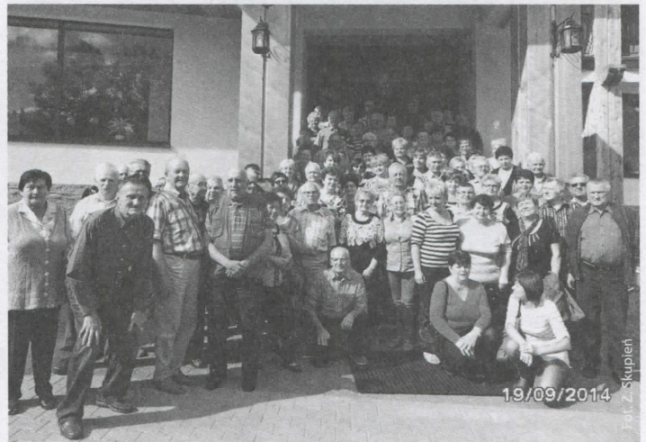
Skrzyszowscy emeryci w Zakopanem

14 września dwa autokary (110 osób) wyjechały ze Skrzyszowa, aby zawiązać emerytów na wypoczynek do nowego hotelu Tatra na Cyrhli w Zakopanem. Wyjazd był bardzo dobrze zorganizowany – każdy mógł wybrać coś dla siebie. Były więc spacerunki tatrzańskimi dolinami, podziwianie skoczni, korzystanie z hotelowego basenu i wód termalnych w Szaflarach, wreszcie zdobycie Łomnicy po słowackiej stronie Tatr. Dla amatorów niższych partii gór były wycieczki objazdowe, aby zwiedzić Ludźmierz, Bachledówkę czy Ząb. Nie obyło się też bez wycieczki do Morskiego Oka i dojazdu do Doliny Pięciu Stawów Polskich oraz najwyższego wodospadu w Polsce – Siklawy. Chętni mogli zwiedzić sanktuarium Matki Boskiej Królowej Tatr na Wiktorówkach. Tradycyjnie skrzyszowscy turyści zaliczyli Krupówki, zwłaszcza lokale handlowe i gastronomiczne.