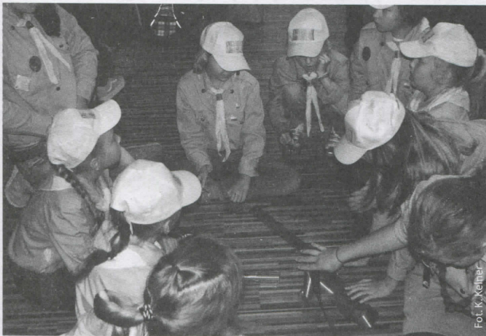
Podpisywanie wstążki obecności

W sobotę 20 września zuchy gołkowickiej gromady wczesnym raniem wyruszyły do Parku Śląskiego w Chorzowie, aby uczestniczyć w Zuchowym Złocie 100 – lecia pn. „Śladami Antka Cwaniaka”. Złot został zorganizowany przez Referat Zuchowy Chorągwi Śląskiej w Katowicach. Wzięło w nim udział 586 zuchów wraz ze swymi wodzami.