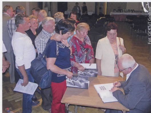
Podpisywanie książek przez Autora