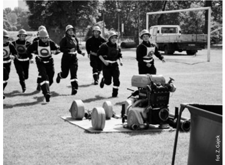
Kobieca Drużyna Pożarnicza w akcji