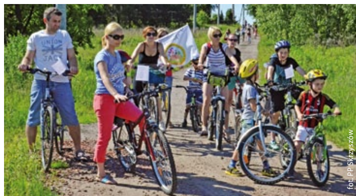
Wspólny rajd rowerowy