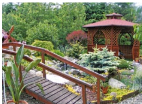
Ogród I. i A. Sosnow