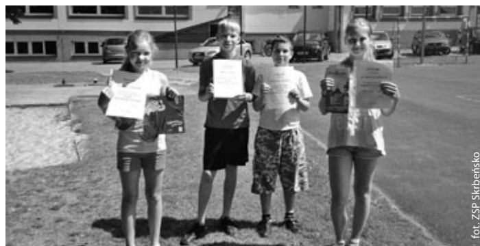
Laureaci ze Skrbeńska