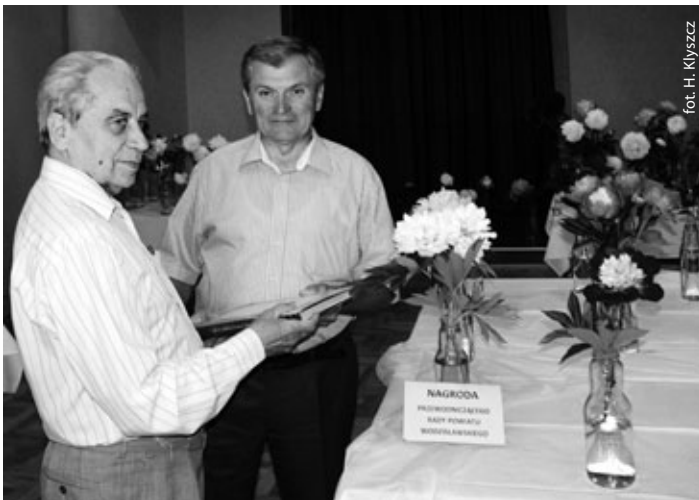
Różne odmiany piwonii