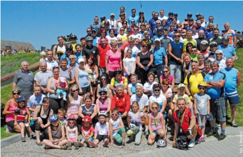
Uczestnicy II Rodzinnego Rajdu Rowerowego

7 czerwca odbył się II RODZINNY RAJD ROWEROWY PO ŚCIEŻKACH MORAWSKICH WRÓT, zorganizowany przez GCKSiT w Godowie oraz Koło Turystyki Rowerowej z Gołkowic. W rajdzie wzięło udział prawie 150 osób. Nie zabrakło rowerzystów z Zebrzydowic i Czech.