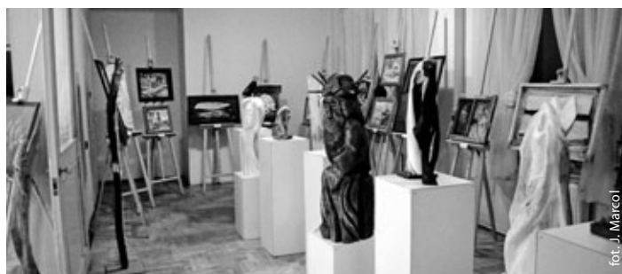
Wystawa rzeźbiarsko-malarska w Skrbeńsku