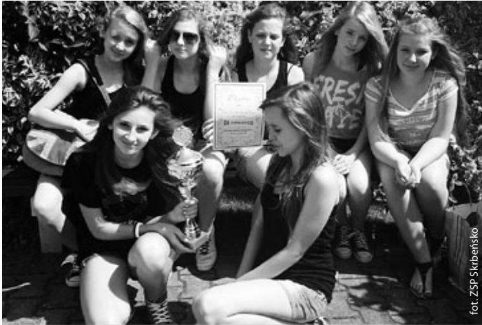
Tancerki ze Skrbeńska