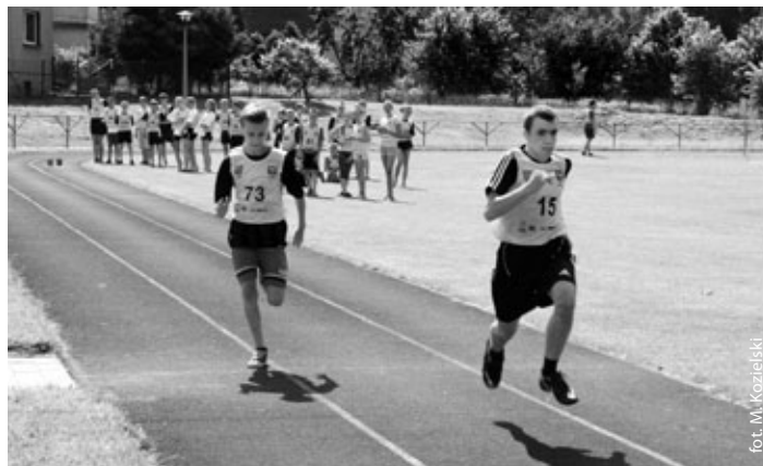
Rywalizacja w biegu