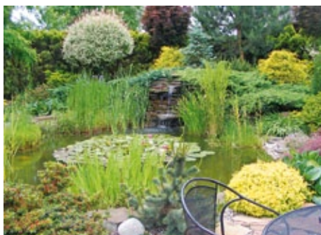
Ogród T. i W. Szewczyków