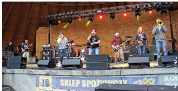
Występ zespołu Drenkrom

Najpierw na scenie pojawił się Klaun Hary, wciągając najmłodszych do wspólnej zabawy. Po nim swoimi umiejętnościami pochwalili się szermierze z Towarzystwa Szermierzy „Górnik Radlin”. Następnie przedstawiciele Fundacji Ochrony Zdrowia i Pomocy Społecznej z Jastrzębia-Zdroju wręczyli honorowemu obywatelowi naszej gmi-