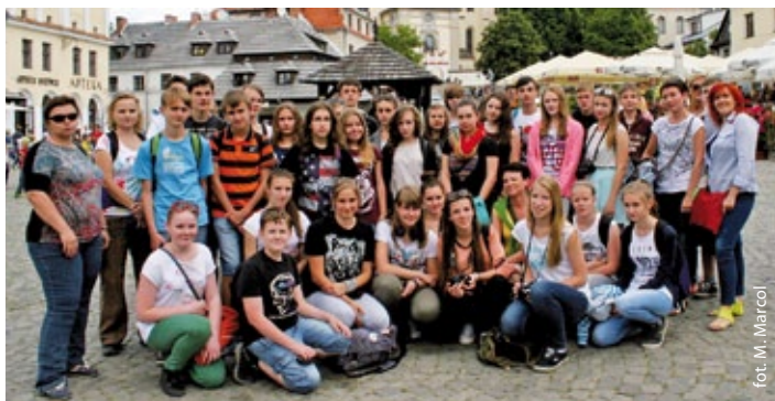
Gimnazjaliści w Kazimierzu