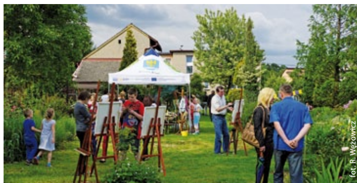
Biblioteka w ogrodzie