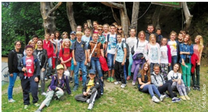
Uczestnicy wycieczki do Złotego Stoku

24 czerwca odbyła się wycieczka dla najlepszych uczniów szkół podstawowych gminy Godów do kopalni złota w Złotym Stoku.