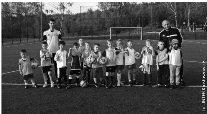
Rocznik 2007 i 2008