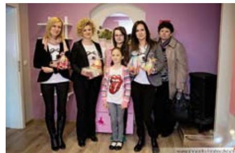
Wspólne świętowanie radości dziewcząt