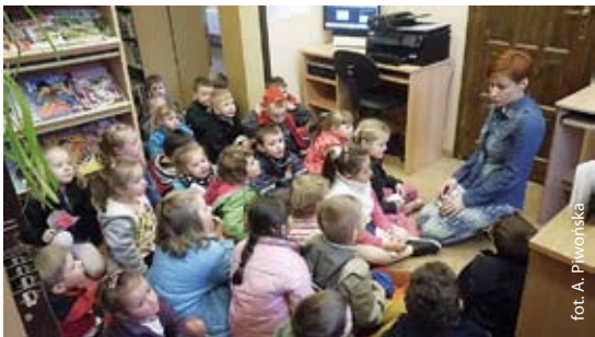
Przedszkolaki podczas słuchania bajek Andersena

Wszystkie dzieci uwielbiają bajki, krostoszowickie przedszkolaki także, dlatego też podczas zajęć bardzo często słuchają bajek i poznają losy bajkowych bohaterów. Jednak nie tylko czytanie bajek, ale również wizyta w miejscu, gdzie każdy znajdzie bajkę lub książkę dla siebie, sprawia im wielką frajdę.