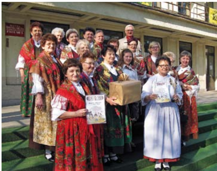
Zespół Kalina w Świętochłowicach

Zespół łażiskiej Kaliny wybrał się na VI Otwarty Przegląd Zespołów Folklorystycznych, Kapel Podwórkowych i Ludowych Regionu Śląskiego, który odbył się 12 kwietnia w Świętochłowicach. Jego organizatorem było tamtejsze Centrum Kultury Śląskiej, a celem – wspieranie oraz promocja tradycyjnej twórczości artystycznej – folkloru. Każdy zespół miał 20 minut na przedstawienie swojego programu. Kalina przedstawiła opowieść „Jak to starzyk i starka downij zolycyli”. Opowieść tak spodobała się komisji oceniającej, że jej wykonawcom przyznała nagrodę Grand Prix. Jest to największe z dotychczasowych osiągnięć Kaliny, co daje zespołowi nie tylko powód do radości, ale i motywację do dalszego działania.