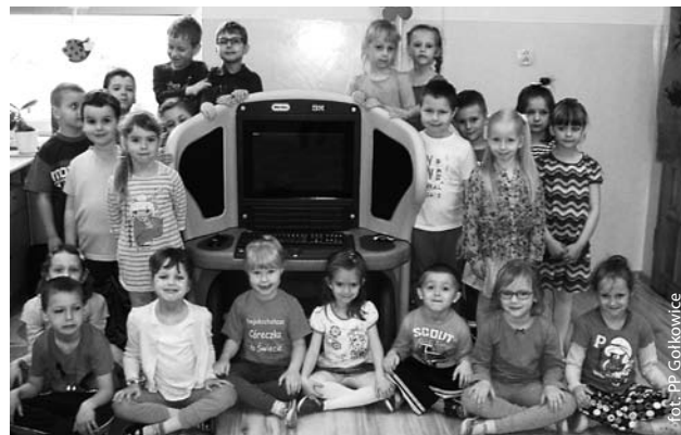
Przedszkolaki z KidSmartem

W dniach 13-14 czerwca 2014 r. na kompleksie sportowo – rekreacyjnym w Godowie odbędą się