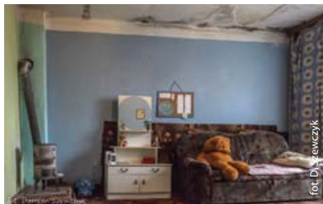
Pokój przed remontem i tuż po