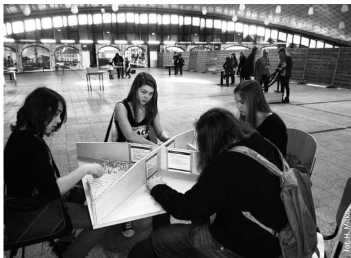
W objęciach królowej nauk