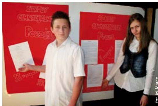
Laureaci i nagrodzone teksty