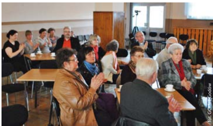
Goście wieczoru wspomnień