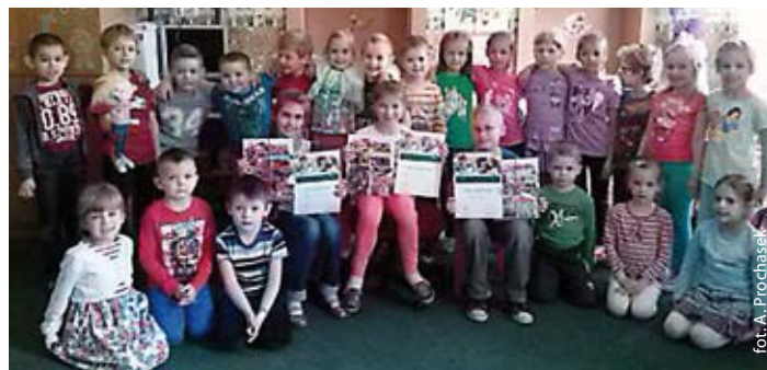
Przedszkolaki i uczniowie kl.III