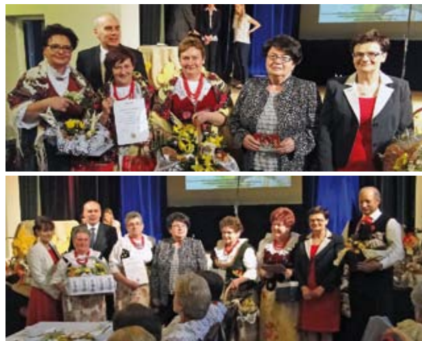
Laureaci Śląskiego Spotkania Wielkanocnego

Wyróżnienia w konkursie otrzymały: KGW z Jastrzębia-Moszczeni- cy, Bzia i Jastrzębia Górnego, Markłowic, Połomi, Czyżowic, Radlina II