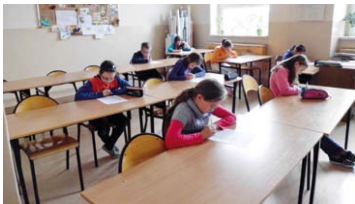
Zmagania z ortograficznymi pułapkami