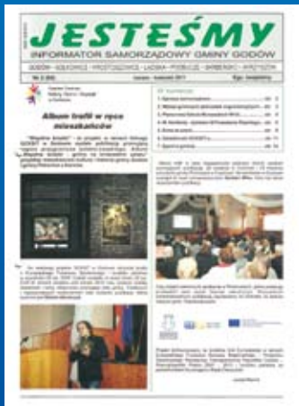
Nr 2(84) MARZEC-KWIECIEŃ 2011