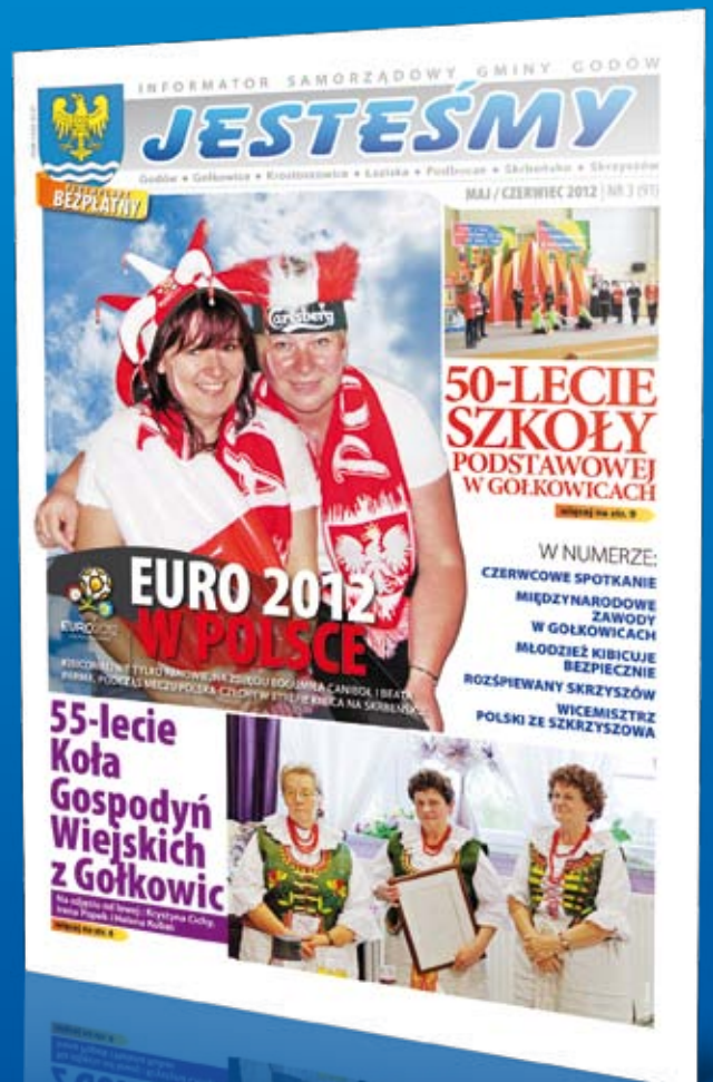
Nr 3(91) MAJ-CZERWIEC 2012

Tak prezentuje się aktualna szata graficzna czasopisma