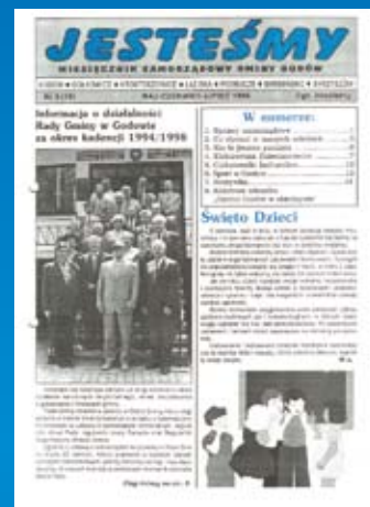
Nr 3(19) MAJ-CZERWIEC-LIPIEC 1998