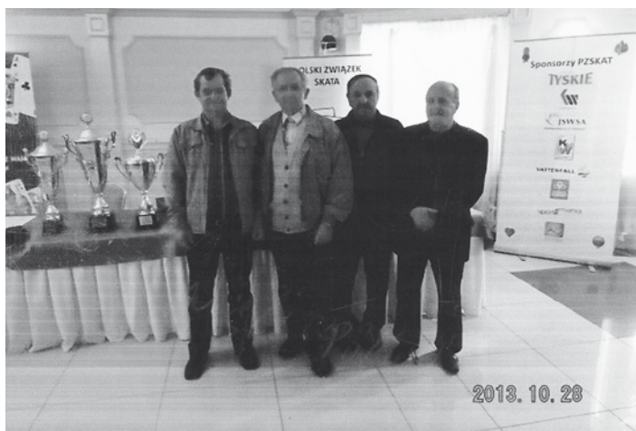
Skrzyszowska drużyna skaterów

Skrzyszowscy skaterzy odnieśli spory sukces w rozgrywkach Pucharu Polski 2013. W fazie eliminacyjnej Okręgu Śląsk Południe zajęli 4. miejsce. Jeszcze lepiej poszło naszej drużynie w półfinale. Na 60 startujących drużyn zajęli 5. miejsce, awansując do finałowej szesnastki.