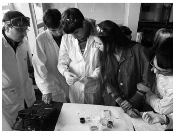
Wyznaczanie pH wybranych produktów spożywczych