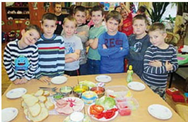
Propozycja zdrowego śniadania