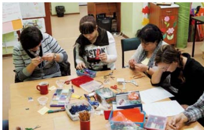
Efekty pracy z igłą, nitką, sznurkiem sutaszowym i koralikami