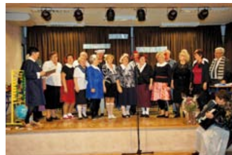
Familijo w szkole