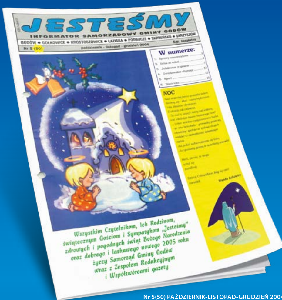
Nr 5(50) PAŹDZIERNIK-LISTOPAD-GRUDZIEŃ 2004