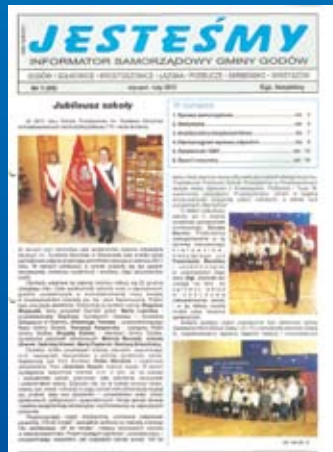
Nr 1(89) STYCZEŃ-LUTY 2012