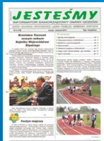
Nr 2(79) MARZEC-KWIECIEŃ 2010