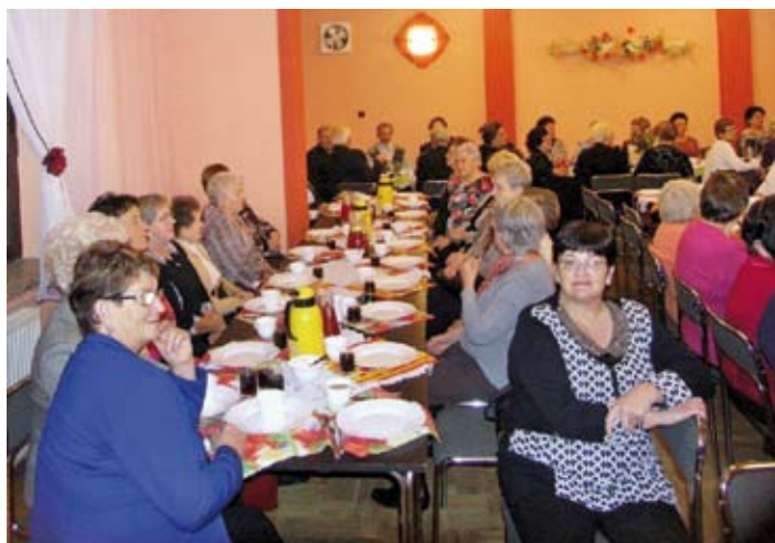
Uczestnicy spotkania integracyjnego