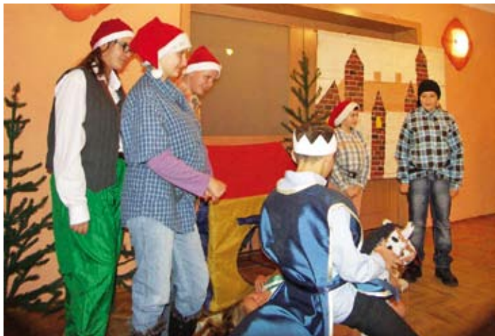
Królowna Śnieżka w wykonaniu uczniów miejscowej szkoły