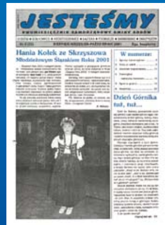
Nr 4(33) SIERPIEŃ-PAŹDZIERNIK 2001