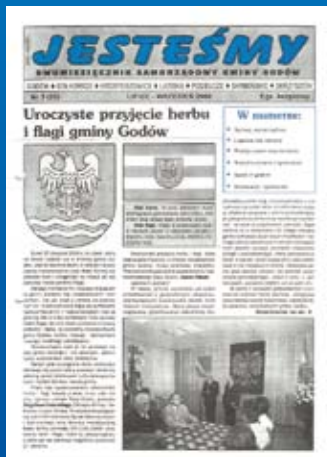
Nr 3(28) LIPIEC-WRZESIEŃ 2000

Warto też przypomnieć, że 1. numer był bezpłatny, 2. kosztował 0,70 zł, a za numery 3-8 zapłaciłmy 0,50 zł. Od numeru 9. aż do dzisiaj wszystkie są bezpłatne. Za to składamy podziękowania poprzednim i obecnym Władzom Samorządowym.