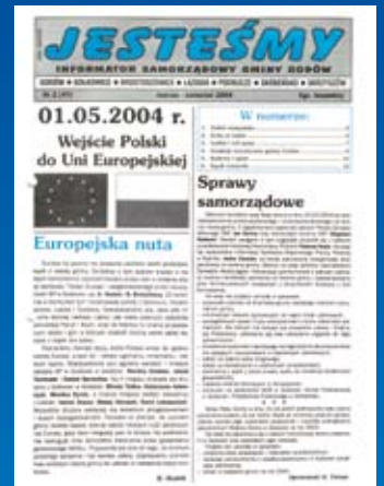
Nr 2(47) MARZEC-KWIECIEŃ 2004