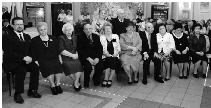
Zarząd skrzyszowskiego koła PZERil z gośćmi