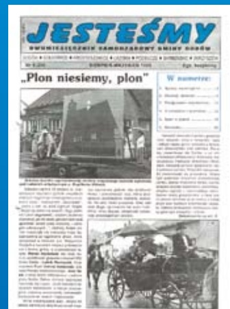
Nr 4(24) SIERPIEŃ-WRZESIEŃ 1999