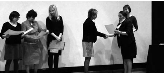
Odbieranie nagrody w Bibliotece Śląskiej za III miejsce

Gminna Biblioteka Publiczna w Godowie zajęła III miejsce w Konkursie „Gminne Koalicje (Partnerstwa) na rzecz Rozwoju Bibliotek 2013” organizowanym przez Bibliotekę Śląską w Katowicach. Konkurs skierowany był do wszystkich bibliotek uczestniczących w Programie Rozwoju Bibliotek oraz tych, które nie były uczestnikami Programu, ale znajdowały się w grupie docelowej PRB (biblioteki gminne, miejsko-gminne oraz z miast do 20 tys. mieszkańców), które stworzyły lokalne partnerstwo o dowolnym charakterze. Celem tego konkursu było promowanie wydarzeń kulturalno – społecznych, zrealizowanych przez biblioteki wspólnie z partnerami lokalnymi, dzielenie się doświadczeniami z budowania partnerstw i prezentowania „dobrych praktyk” w tym zakresie oraz integracja bibliotek publicznych ze środowiskiem lokalnym. Do konkursu można było zgłaszać projekty i przedsięwzięcia, które zawierały innowacyjne działania, mogące być inspiracją dla innych bibliotek publicznych, a zrealizowane we współpracy z lokalnymi partnerami.