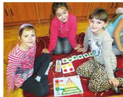
Piramida zdrowego żywienia