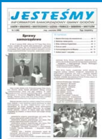
Nr 3(68) MAJ-CZERWIEC 2008