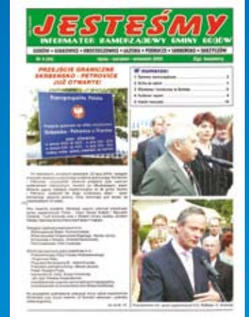
Nr 4(54) LIPIEC-WRZESIEŃ 2005