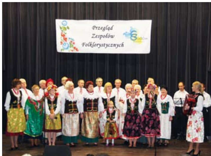
Zdobywcy 1. miejsca – zespół Gorzycanie

Beata Wala Referat Funduszy Zewnętrznych i Zamówień Publicznych