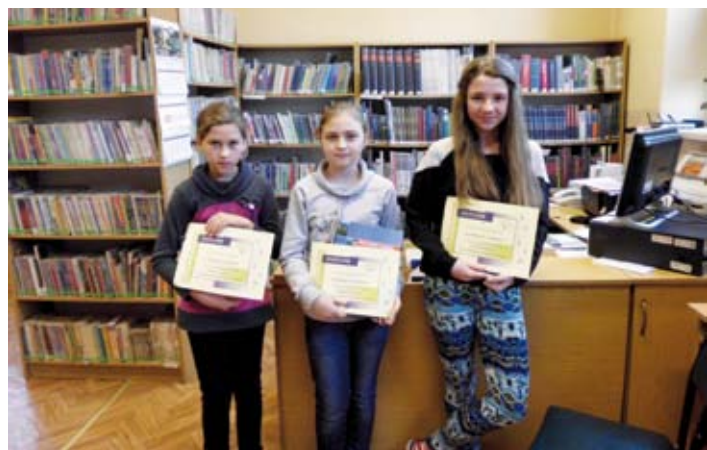
Zwycięzczynie Dyktanda 2013