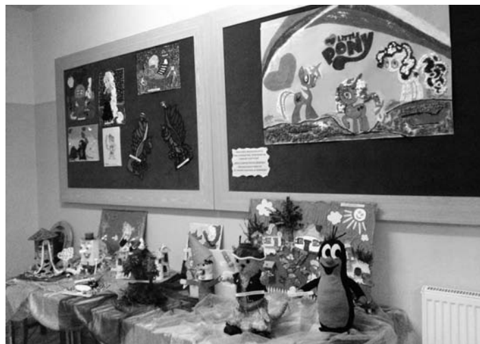
Moja ulubiona postać bajkowa-wystawa prac konkursowych