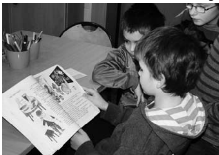
Na zajęciach świetlicowych

W czasach kultury, w której dominuje obraz, duże grono dorosłych, jak również dzieci, nie czuje potrzeby kontaktu z książką. Czytanie jest dla dzieci i młodzieży czynnością nieciekawą, która przegrywa z niewymagającymi wysiłku telewizją i komputerem. Te jednak, wykorzystywane w nadmiarze i bez ograniczeń, są szkodliwe, bo wywołują u dzieci lęki, niepokoje, znieczulają na przemoc i agresję.