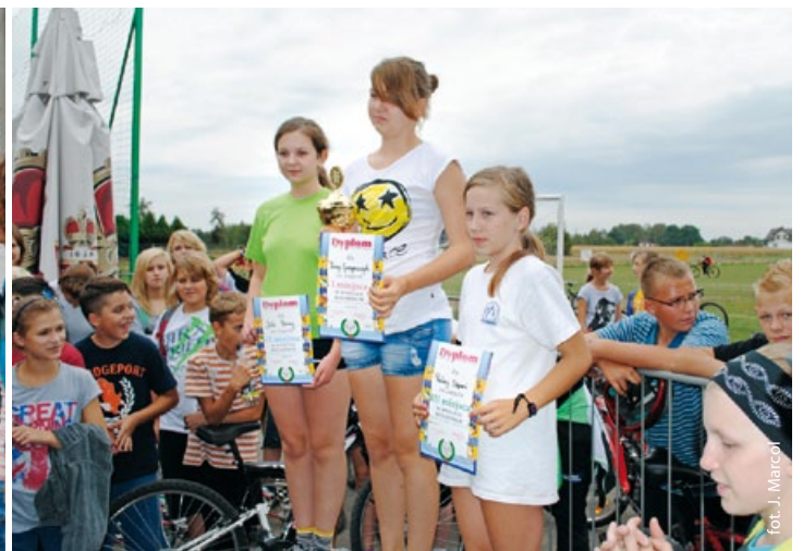
Wyścig kolarski – na podium dziewczyny z kl. VI