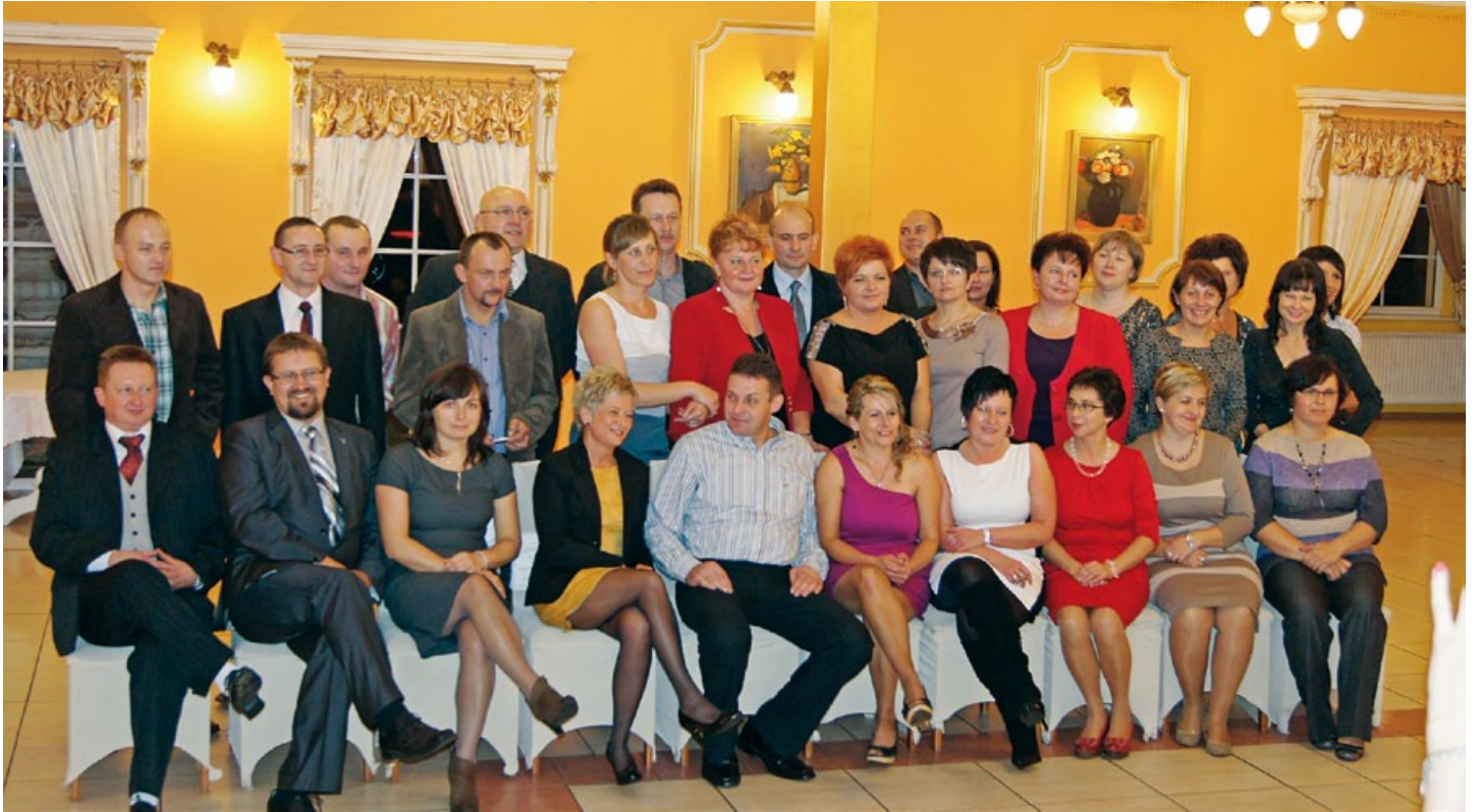
Spotkanie rocznika 1972 w Gołkowicach