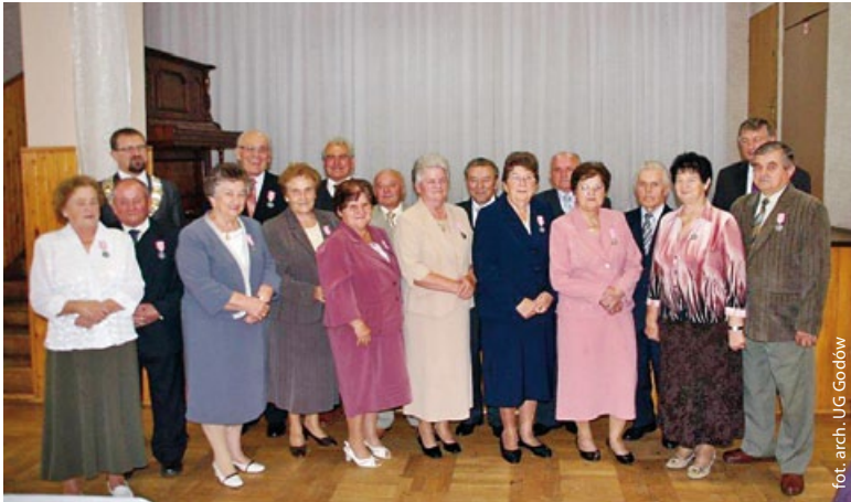
Jubilaci Złotych Godów