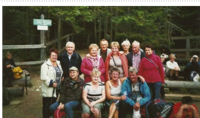
Nad Smreczyńskim Stawem