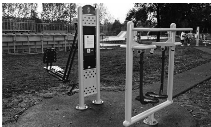
Część nowego wyposażenia w Godowie

Referat Funduszy Zewnętrznych i Zamówień Publicznych