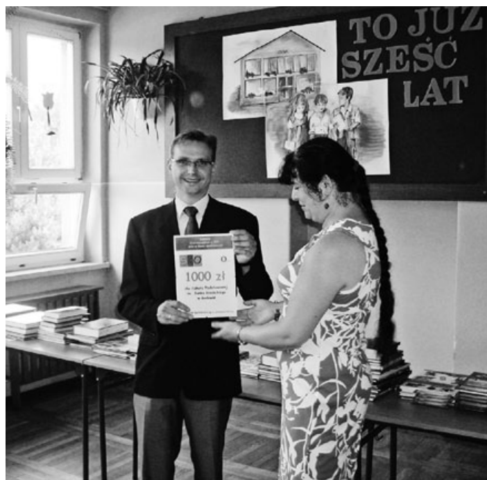
Wręczenie nagrody Dyrektor szkoły

Jesteśmy bardzo dumni z naszych uczniów i gratulujemy im sukcesu oraz życzymy wytrwałości w dalszym gromadzeniu środków finansowych i dużo radości w ich wydawaniu.