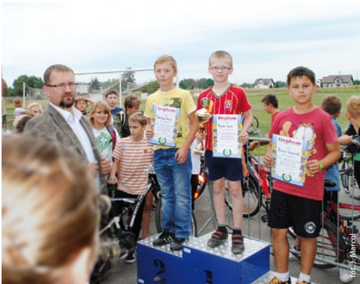
Wyścig kolarski – na podium chłopcy z kl. V