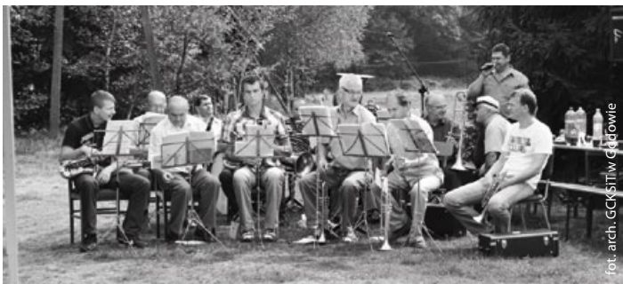
Wspólne biesiadowanie umilała Gminna Orkiestra Dęta z Gołkowic

Na początku września w Bierach odbył się GMINNY PRZEGLĄD ZESPOŁÓW ŚPIEWACZYCH i CHÓRÓW. Tradycyjnie spotkanie rozpoczęło się Mszą św. w intencji uczestników i ich rodzin. Po Mszy wszyscy udali się do miejscowego ośrodka harcerskiego, gdzie czekał na nich poczęstunek w postaci pysznej grochówki.