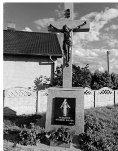
Gdzie znajduje się ten krzyż i jaką niesie historię?