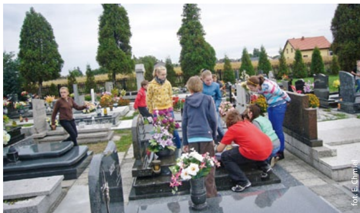
Na cmentarzu katolickim