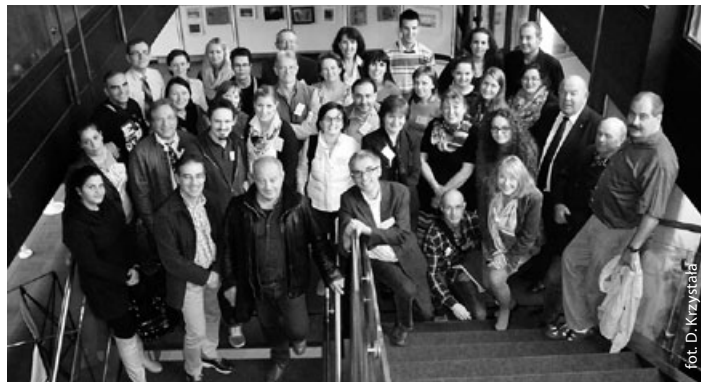
Wszyscy uczestnicy Projektu Comenius podczas wizyty u Burmistrza Frechen w ratuszu

W drugiej połowie września odbyło się już pierwsze z siedmiu za-