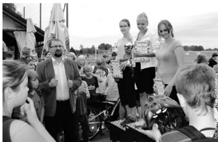
Dziewczyny – kl. II gimnazjum