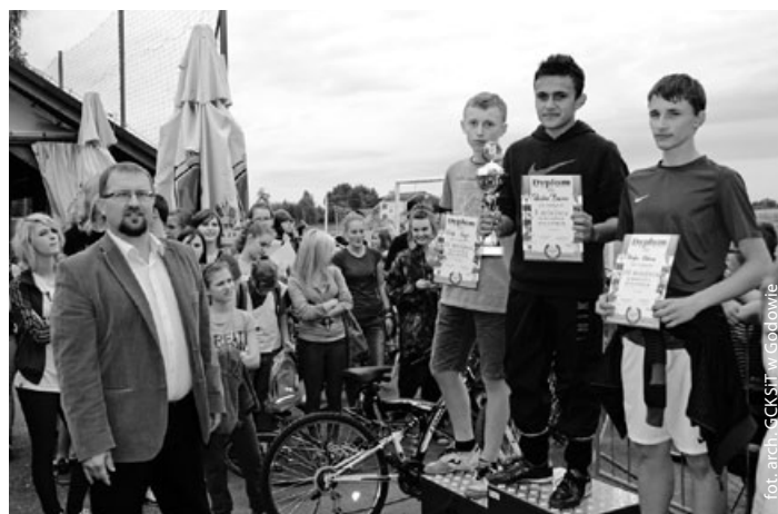
Chłopcy – kl. II gimnazjum