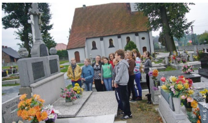
Na cmentarzu ewangelickim