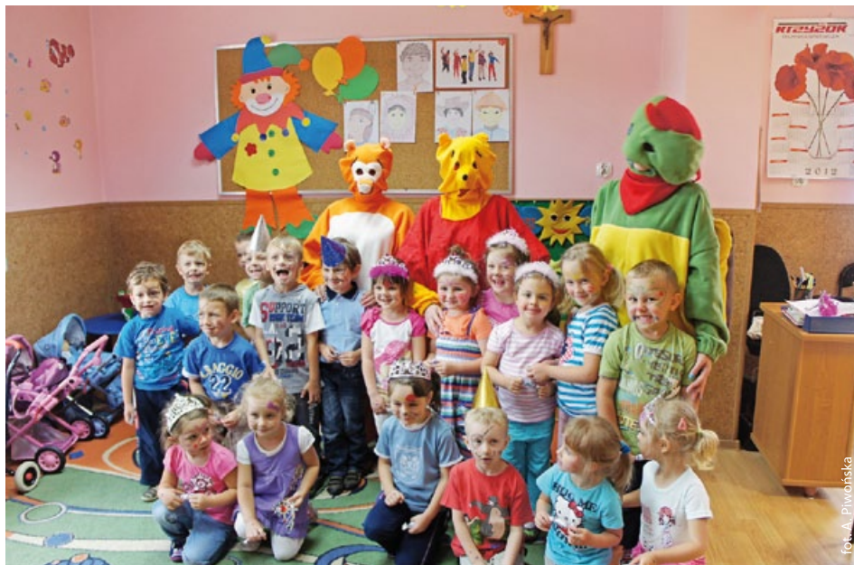
Przedшкоlaki z Godowa z Tygrysiem, Kubusiem Puchatkiem i Franklinem.