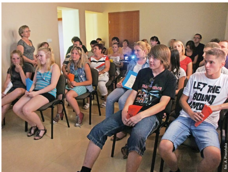
Uczestnicy podczas warsztatów filmowych w Gminnej Bibliotece Publicznej w Godowie