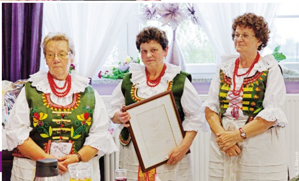
fol. J. Marcol