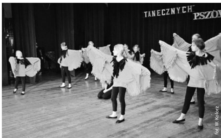
ISKIERKI podczas nagrodzonego występu