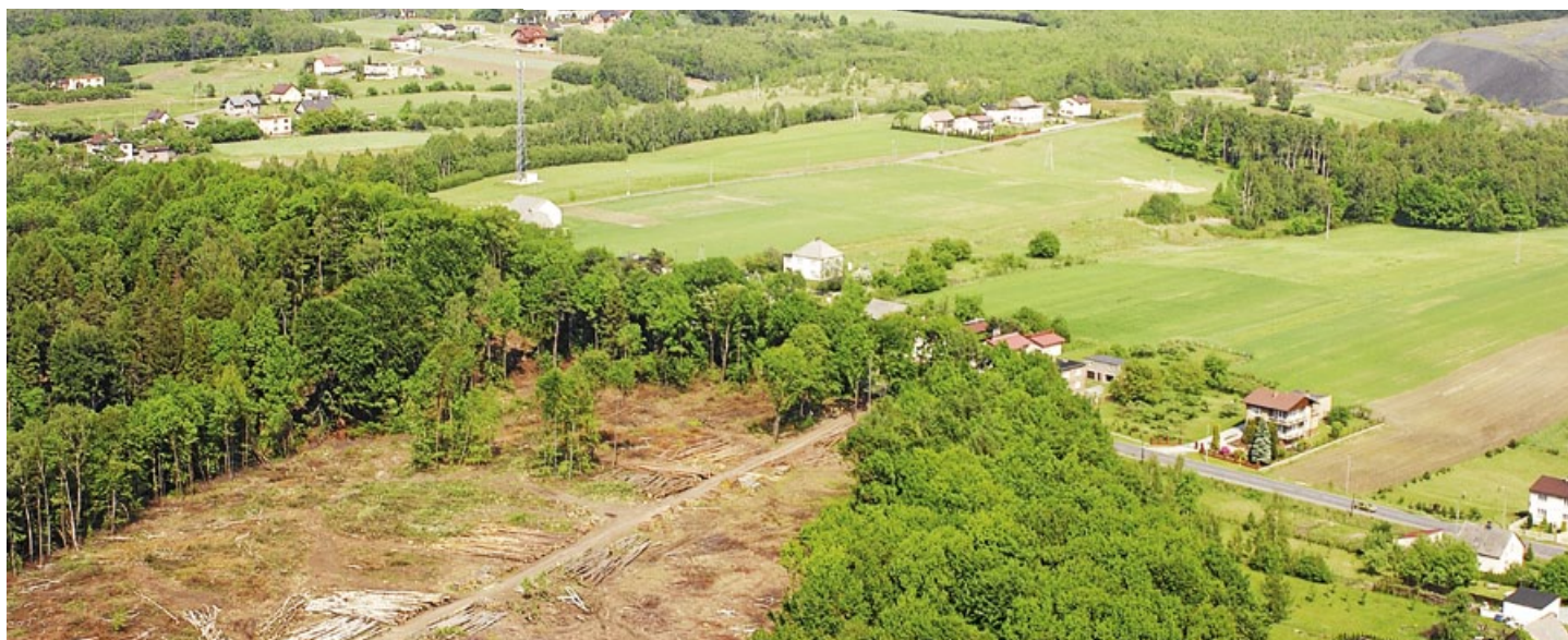
Fotografia przedstawia budowę autostrady A-1 w Skrzyszowie. Zdjęcie zrobiono wiosną 2008 roku, a prezentujemy je dzięki uprzejmości mieszkańców gminy Godów.