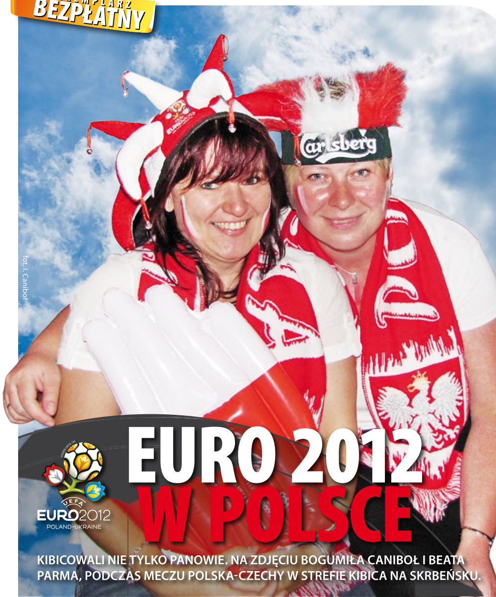
fol. I. Canibol