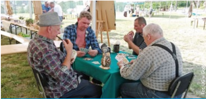
„Szkaciorze” z Krostoszowic