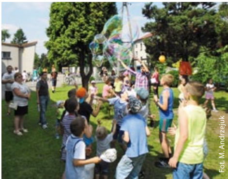
Piknik Rodzinny w Gołkowicach 04.06.2016 r.