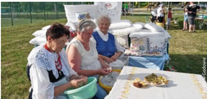
„Szkubaczki” – Zespół Gospodyni z Krostoszowic