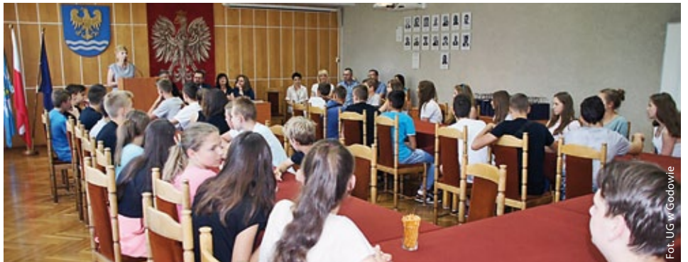
Uczniowie II klas gimnazjum w Urzędzie Gminy w Godowie (więcej na str. 10)