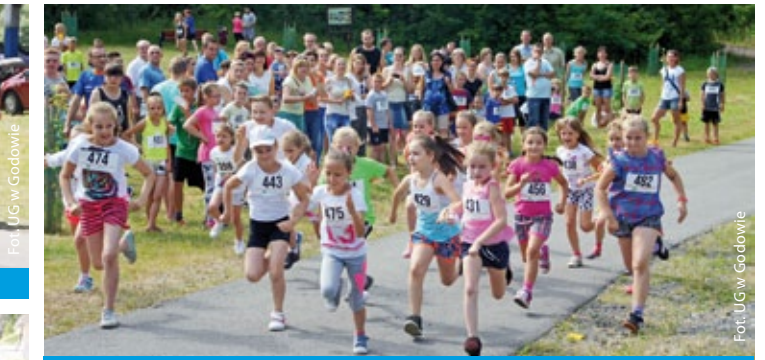
Uczestnicy Festiwalu Biegowego