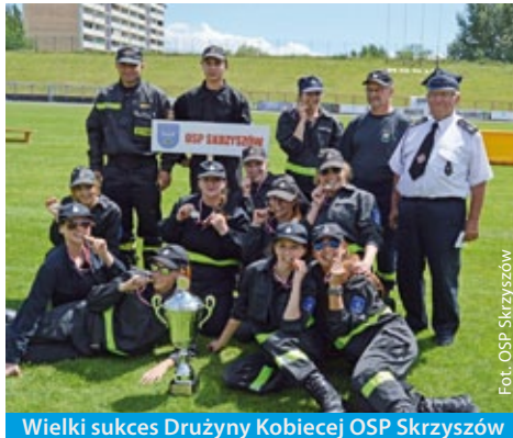
Wielki sukces Drużyny Kobiecej OSP Skrzyszów 18.06.2016 r.