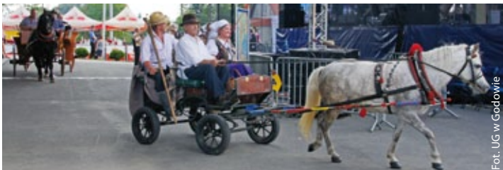
Członkowie Stowarzyszenia Hodowców i Miłośników Koni Mustang