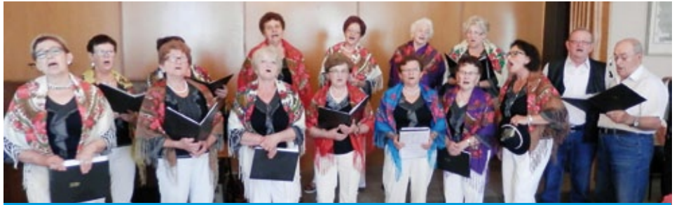
Zespół Kalina z występem w Boguminiu-Skrzeczoniu