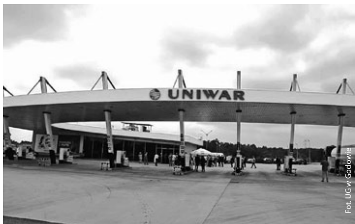
Gmina Godów to dobra lokalizacja