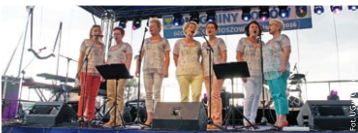
Spoko Babki ze Skrzyszowa