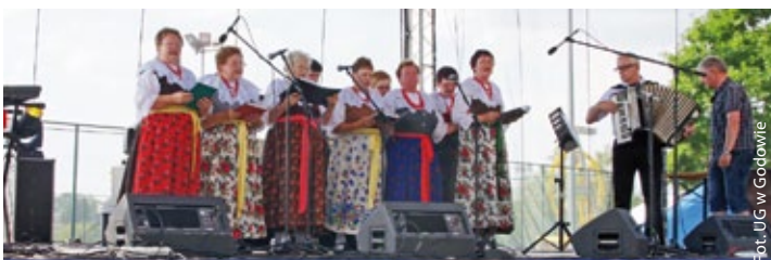
Zespół Gospodyni z Krostoszowic