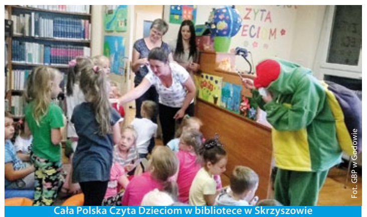
Cała Polska Czyta Dzieciom w bibliotece w Skrzyszowie