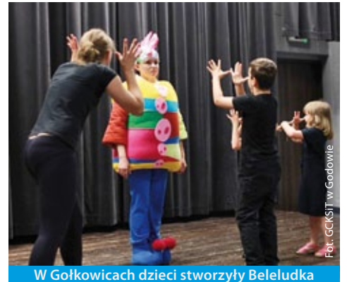
W Gołkowicach dzieci stworzyły Beleludka (więcej na str. 8)