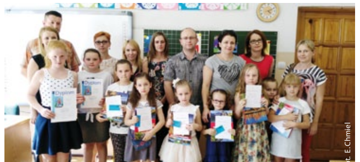
Konkurs „Śląskie Straszki”