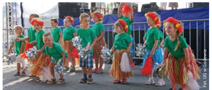
Przedszkolaki z Krostoszowic