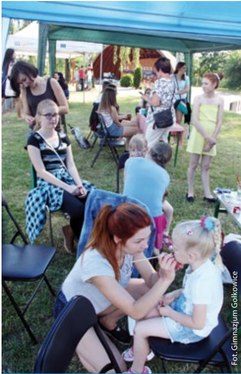
Festyn gimnazjalny w Godowie (więcej na str. 5)