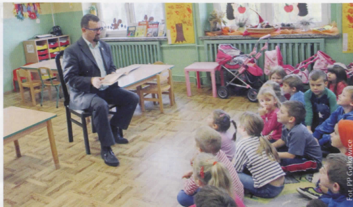
Wójt z dzielnym ołowianym żołnierzem

Gdy Wójt czytał bajkę, mała publiczność siedziała jak zaczarowana. Dzieci nawiązały z gościem bardzo dobry kontakt, zadawały mnóstwo