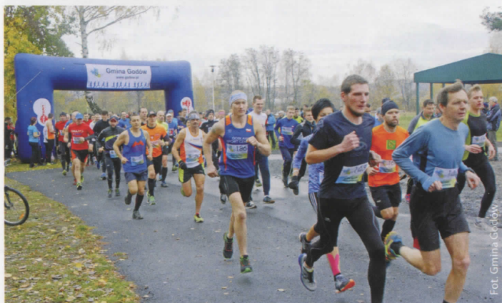
Uczestnicy zawodów biegowych