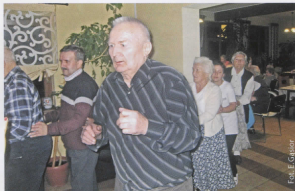
Dруга młodość seniorów

Szanownemu Jubilatowi raz jeszcze składamy serdeczne gratulacje oraz najlepsze życzenia dalszych lat życia w zdrowiu, pogody ducha oraz mnóstwo sił do pokonywania wszelkich trudności, a także samych radosnych chwil w gronie troskliwych i życzliwych osób.