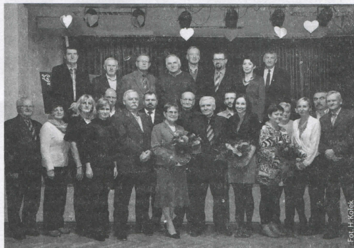
Uczestnicy spotkania z okazji 20-lecia Jesteśmy