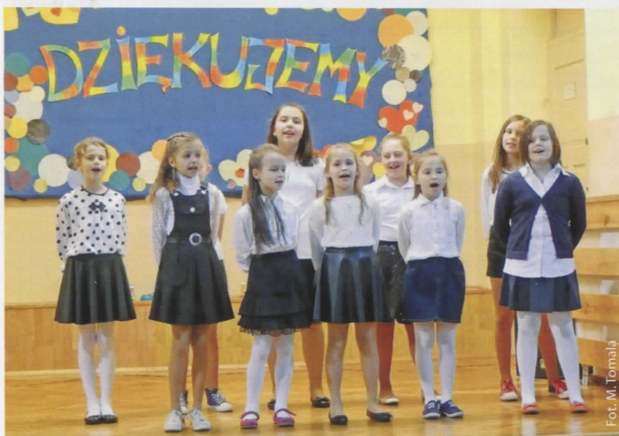
Uczennice kl. IV i V podczas występu