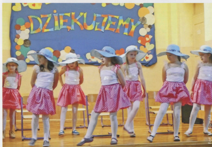
Występ uczennic kl. IIA i IIB

W Zespole Szkolno-Przedszkolnym w Łaziskach odbyła się niezwykła uroczystość: spotkanie z przyjaciółmi szkoły. Dyrekcja szkoły, gromada pedagogiczna oraz społeczność uczniowska raz w roku wspólnie z miejscową Radą Rodziców organizują wyjątkowy wieczór z udziałem osób, które w jakikolwiek sposób wspierają łaziską placówkę. Ta życzliwość przybiera różne formy. Niekiedy wystarczy przyjazne słowo i tworzenie pozytywnego wizerunku placówki w środowisku lokalnym, ale bardzo często jest to duże wsparcie finansowe.