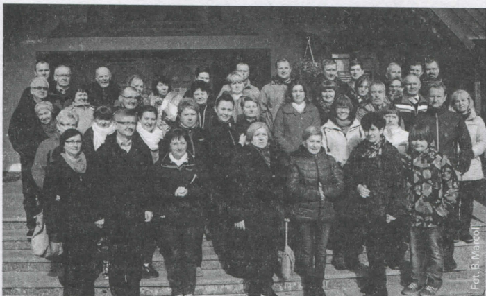
Absolwent przed kościołem na Cyrhli