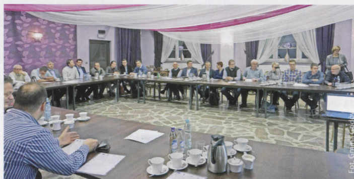
Uczestnicy spotkania przedsiębiorców

Referat Funduszy Zewnętrznych i Zamówień Publicznych