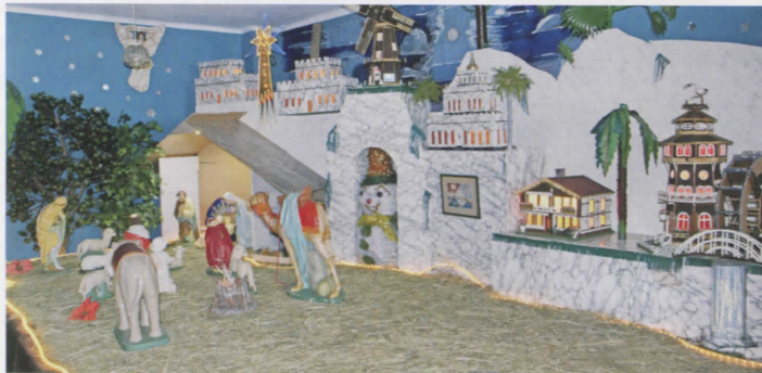
Ruchoma stajenka w Godowie

W związku ze zbliżającymi się świętami Bożego Narodzenia informujemy, że w Godowie znajduje się ruchoma stajenka. Można ją zwiedzać cały rok, jednak szczególnie w najbliższym czasie warto ją obejrzeć, a przedstawionemu wydarzeniu poświęcić kilka chwil refleksji.