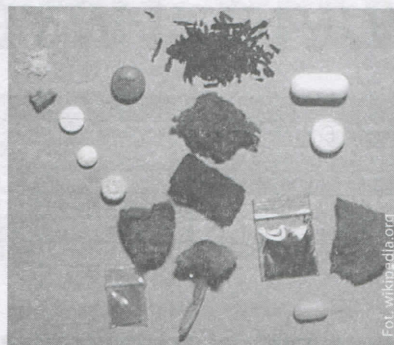
Substancje psychoaktywne mogą przybierać różne formy

gotrwałym używaniu substancji lotnych, narządem jest mózg. Często w takich przypadkach dochodzi do tzw. zespołu organicznego charakteryzującego się zaburzeniami pamięci i intelektu. Nierzadko osoby stale używające tych środków mają zaburzenia koordynacji ruchowej, których widocznym efektem jest charakterystyczny chód. Stosowanie wielu lotnych substancji odurzających bez wątpienia może prowadzić do zgonu. Po dłuższym zażywaniu alkoholu i barbituranów występują poważne zaburzenia świadomości, toku myślenia, orientacji i oceny sytuacji, osłabienie napięcia mięśniowego, stały niepokój, trudności ze snem, chroniczne zmęczenie. Dopalacze zwykle mają więcej efektów ubocznych niż amfetamina: drgawki, podniesienie temperatury ciała, uczucie zagubienia, psychozy, bezsenność, tachykardia, mdłości, wymioty i bóle głowy.