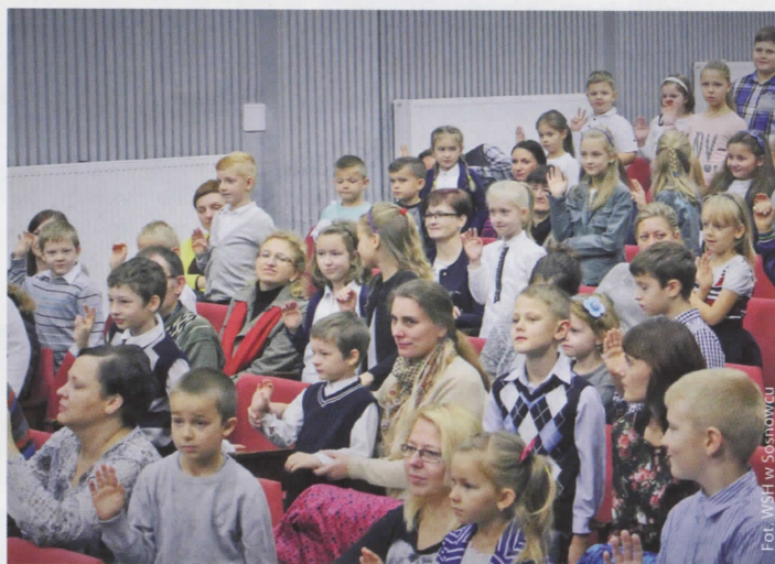
Ślubowanie młodych adeptów nauki