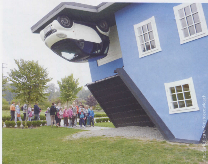
W Dream Parku w Ochabach

Dotacja uzyskana na realizację zadania „Nasza profilaktyka i integracja” znacznie rozszerzyła ofertę zajęć Świetlicy Profilaktyczno-Wychowawczej w Krostoszowicach oraz filii w Łaziskach. Pozyskane środki finansowe umożliwiły zaproszenie do tych placówek wykwalifikowanych specjalistów, którzy od początku roku szkolnego prowadzą cyklicznie ciekawe warsztaty. Stałe zajęcia popołudniowe zostały wzbogacone m.in. o comiesięczne spotkania z dogoterapeutą i jego podopiecznymi – Lusią i Florką. Podczas warsztatów uczestnicy przyzwyczajają się do kontaktu ze zwierzętami, przełamują lęki, bawią się i uczą wydawania poleceń. Spotkania te kształtują w dzieciach pozytywne emocje, eliminują agresję, rozwijają empatię, są również ciekawą formą spędzania wolnego czasu i wspaniałą przygodą.