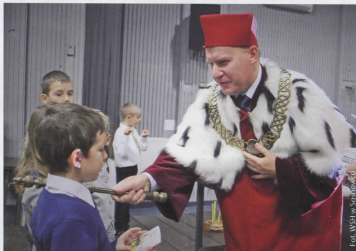
Pasowanie na studenta GUD