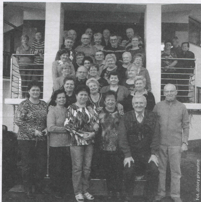
Skrzyszowianie w Zakopanem