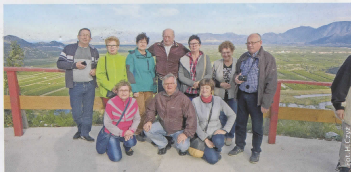
Gołkowska grupa w Chorwacji

Chórzyści zwiedzili m.in. Split, Dubrownik, Mostar, Medjugorje, podziwiając równocześnie piękne krajobrazy trasy wycieczkowej. Wielkim przeżyciem dla wszystkich był występ połączonych zespołów w położonym w odległości ok. 30 km od Zagrzebia chorwackim sanktuarium maryjnym Marija Bistrica, w którym owacyjnymi oklaskami nagrodzono śpiew chórzystów z Polski. Warto nadmienić, że Marija Bistrica w roku 1971 została ogłoszona narodowym sanktuarium Matki Bożej Królowej Chorwacji, a obiektem kultu jest tu niezwykła drewniana figura Matki Bożej pochodząca z końca XV wieku, zwana też Czarną Madonną. Bystrzycką świątynię odwiedza co roku ok. 500 tysięcy pielgrzymów.