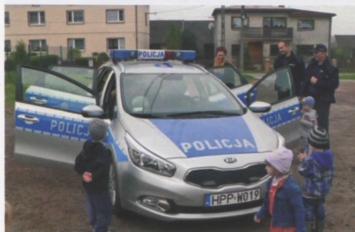
Innowacyjne przedszkola – konkurs „Zdrowo i bezpiecznie” (więcej na str. 3)