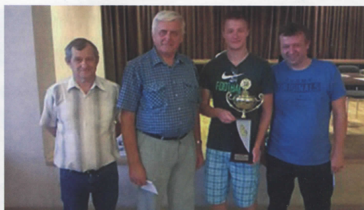
Zwycięzcy Turnieju Skata w Skrzyszowie