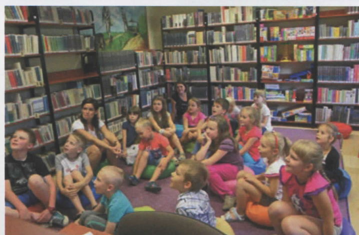
Sierpień w bibliotece – „Czytam Sobie w Wacacje”