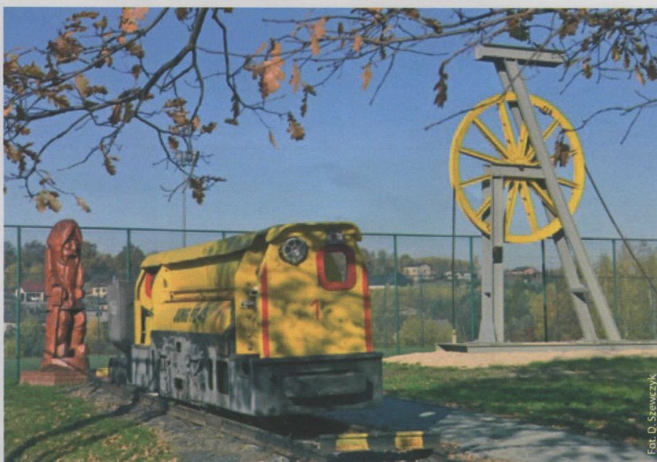
Tereny rekreacyjne – Orlik Krostoszowice