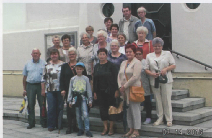
KGW Skrbeńsko w Wadowicach (więcej na str. 4)