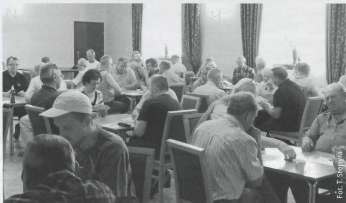
Uczestnicy turnieju skata w Skrzyszowie