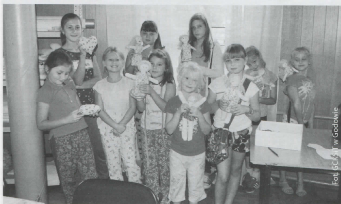
Malowana tkanina – zajęcia z dziećmi w OK w Godowie

W połowie czerwca w Ośrodku Kultury w Godowie rozpoczął się cykl warsztatów krawieckich połączonych z kursem zdobienia tkanin pod nazwą „Malowana tkanina”. Realizacja projektu była możliwa dzięki dofinansowaniu z Funduszu Inicjatyw Obywatelskich – Śląskie Lokalnie – Centrum Rozwoju Inicjatyw Społecznych. Dzięki dofinansowaniu inicjatywy na kwotę ponad 4,5 tys. zł doposażono pracownię działań kreatywnych – Art Pompownia w dwie maszyny do szycia, materiały, akcesoria krawieckie, materiały wykończeniowe, mulinę, farby, konturówki, szablony, płyny do transferu, drukarkę laserową oraz inne akcesoria niezbędne do przeprowadzenia warsztatów. Wszystkie zajęcia były darmowe.