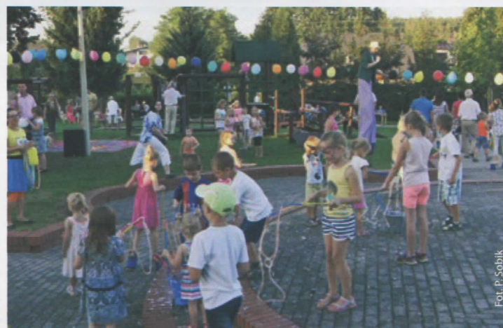
Festyn dla Dzieci w Skrzyszowie 28.08.2016 r.