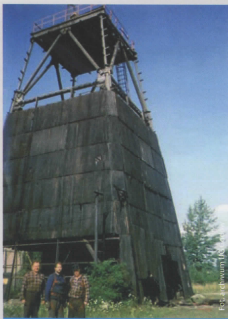
Dawny szyb kopalniany KWK 1 Maja w Krostoszowicach