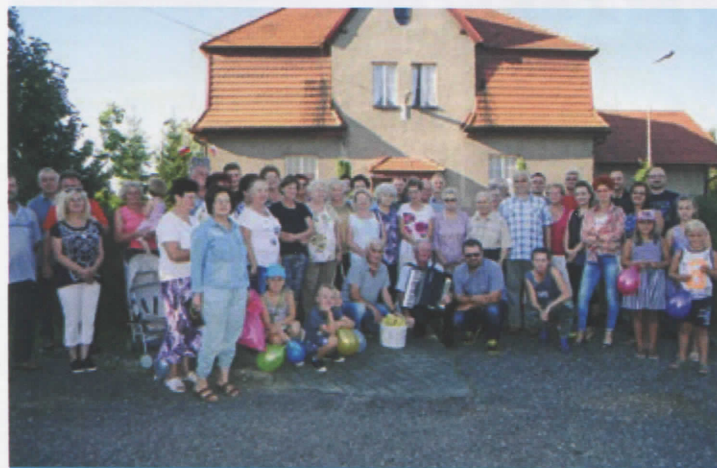
Spotkanie pod pomnikami, Godów 25.08.2016 r.