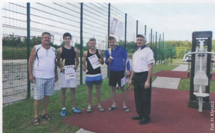
Zdobywcy I miejsca w Turniej Siatkówki Piłkowej (więcej na str. 14)