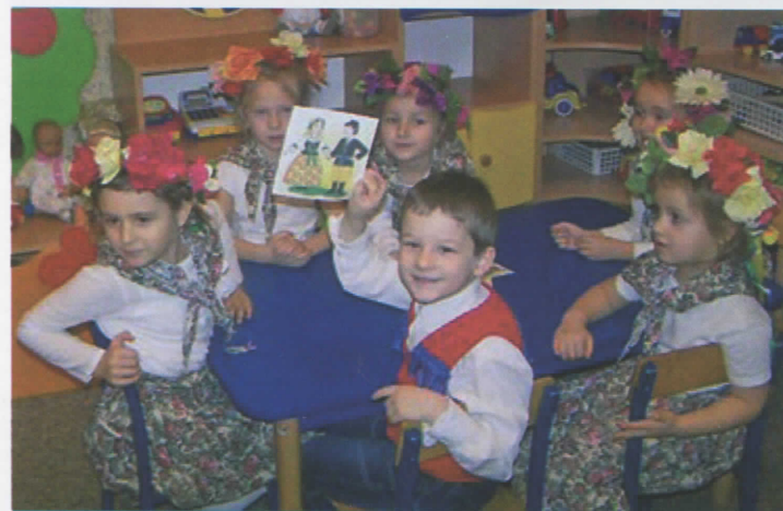
Innowacyjne przedszkola na ludowo (więcej na str. 3)