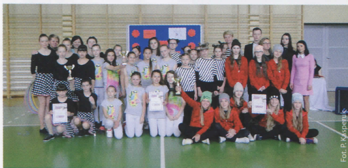
O tańcu nie da się napisać (więcej na str. 5)