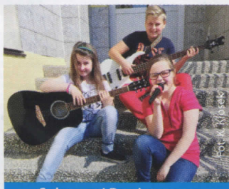
Sukces w I Powiatowym Konkursie Piosenki Polskiej (więcej na str. 6)