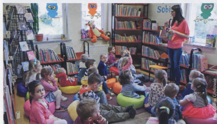
Spotkanie w Gminnej Bibliotece Publicznej w Godowie (więcej na str. 5)