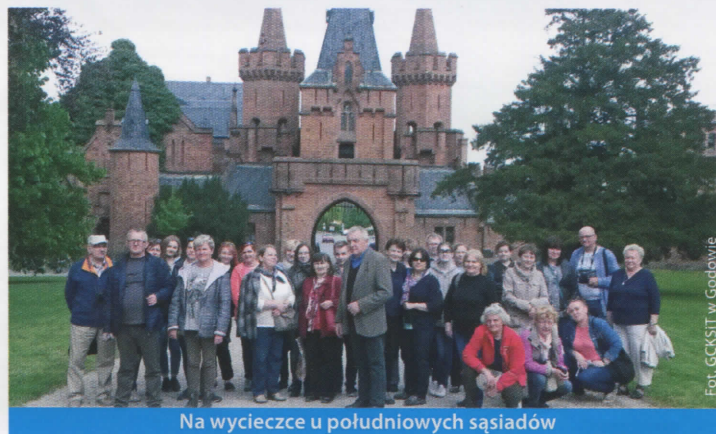
Na wycieczce u południowych sąsiadów