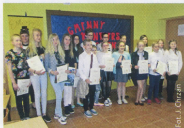
Gminny Konkurs Mitologiczny (więcej na str. 9)