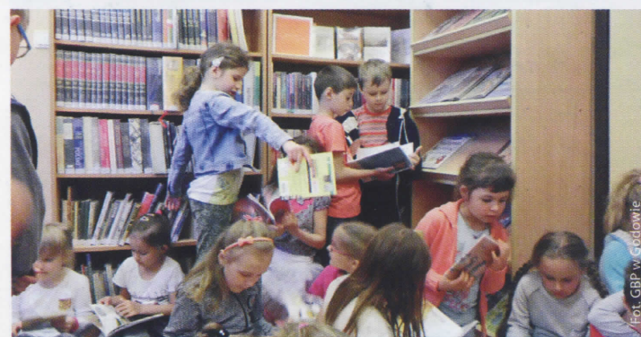
Tydzień Europejski w Przedszkolu Publicznym im. Przyjaciół Kubusia Puchatka w Gołkowicach (więcej na str. 9)