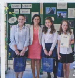
„Nasze miejsce na ziemi” (więcej na str. 12)