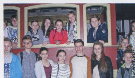
Zespół Szkół w Skrzyszowie z wizytą w Muzeum Powstań Śląskich