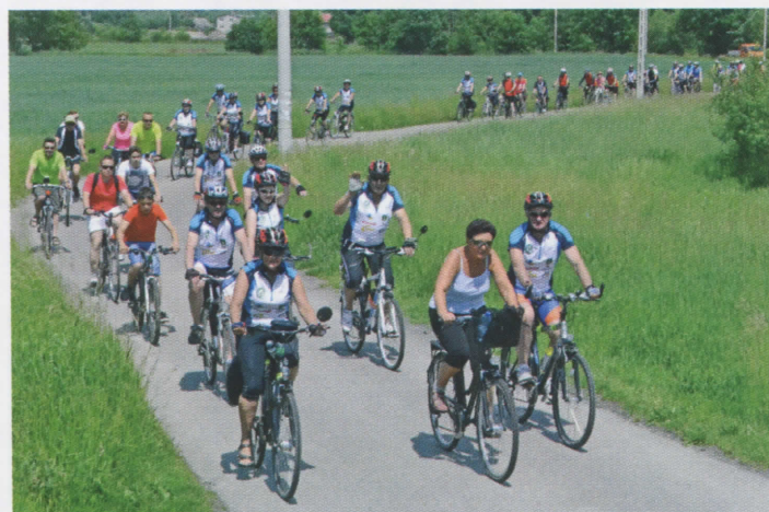
Uczestnicy IV Rodzinnego Rajdu w Gminie Godów, organizowanego przez Koło Turystyki Rowerowej oraz GCKSiT w Godowie