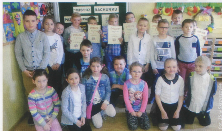
Międzyszkolny konkurs „Mistrz Rachunku Pamięciowego” (więcej na str. 9)