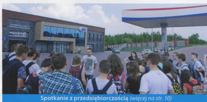
Spotkanie z przedsiębiorczością (więcej na str. 10)