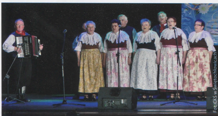
Zespół Podbuczanki w CKS w Świętochłowicach (więcej na str. 6)