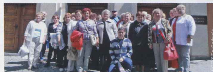
Wycieczka-pielgrzymka na Górę Św. Anny (więcej na str. 6)