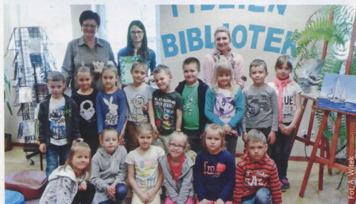
Tydzień Bibliotek w Gołkowicach (więcej na str. 8)