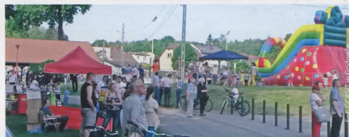
Rodzinna Majówka w Godowie (więcej na str. 5)