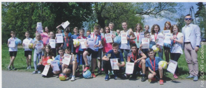
Biegi Między Pomnikami Powstańców Śląskich (więcej na str. 8)