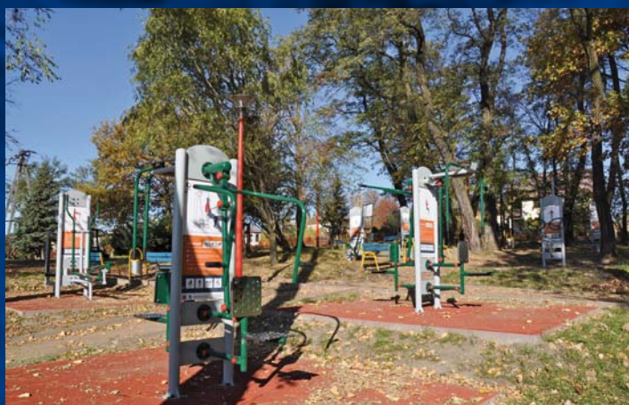
Siłownia zewnętrzna w parku sołeckim w Łaziskach Venkovní posilovna při Parku Starostenství v Łaziskach