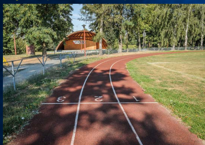
Teren rekreacyjny w Godowie Rekreační komplex v Godowie