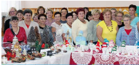
Uczestniczki Artystycznych Wiosad 2, Godów, 18.10.2017