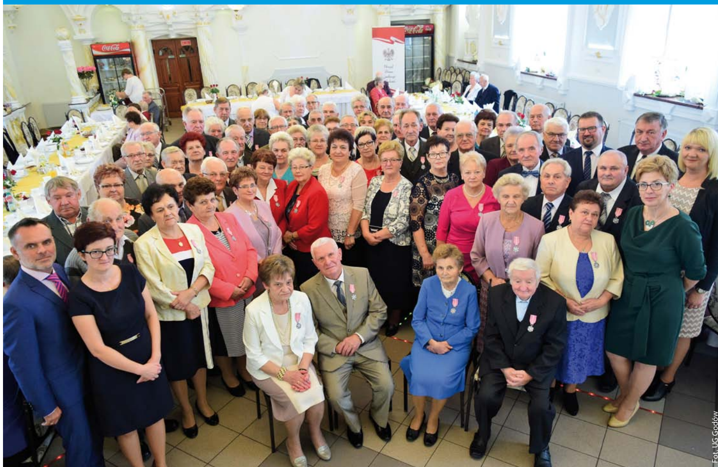
Jubilaci obchodzący 50 lat małżeństwa