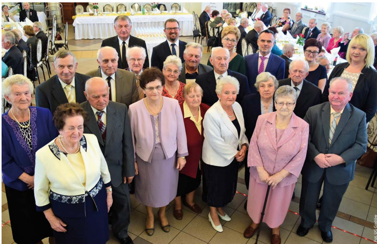
Jubilaci obchodzący 60 lat małżeństwa