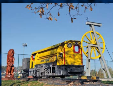
Pomnik w miejscu byłego szybu kopalni „Anna” w Krostoszowicach Památník na místě bývalé šachty „Anna” v Krostoszovicích