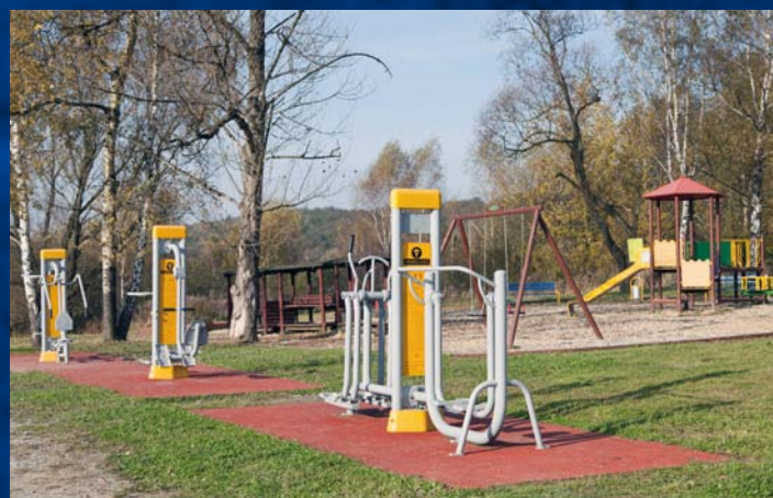
Siłownia zewnętrzna i miejsce do kalisteniki w Krostoszowicach Mimo posilovny a místo, kde se kalisteniky v Krostoszowicach