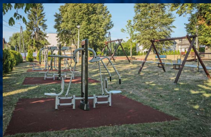
Siłownia zewnętrzna w Skrzyszowie Vnější tělocvična v Skrzyszowie