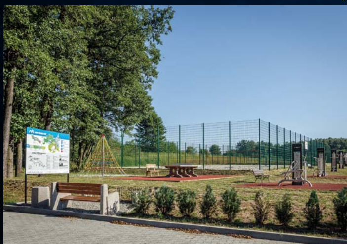
Skrbeńsko Teren rekreacyjny Rekreační komplex v Skrbeňsku