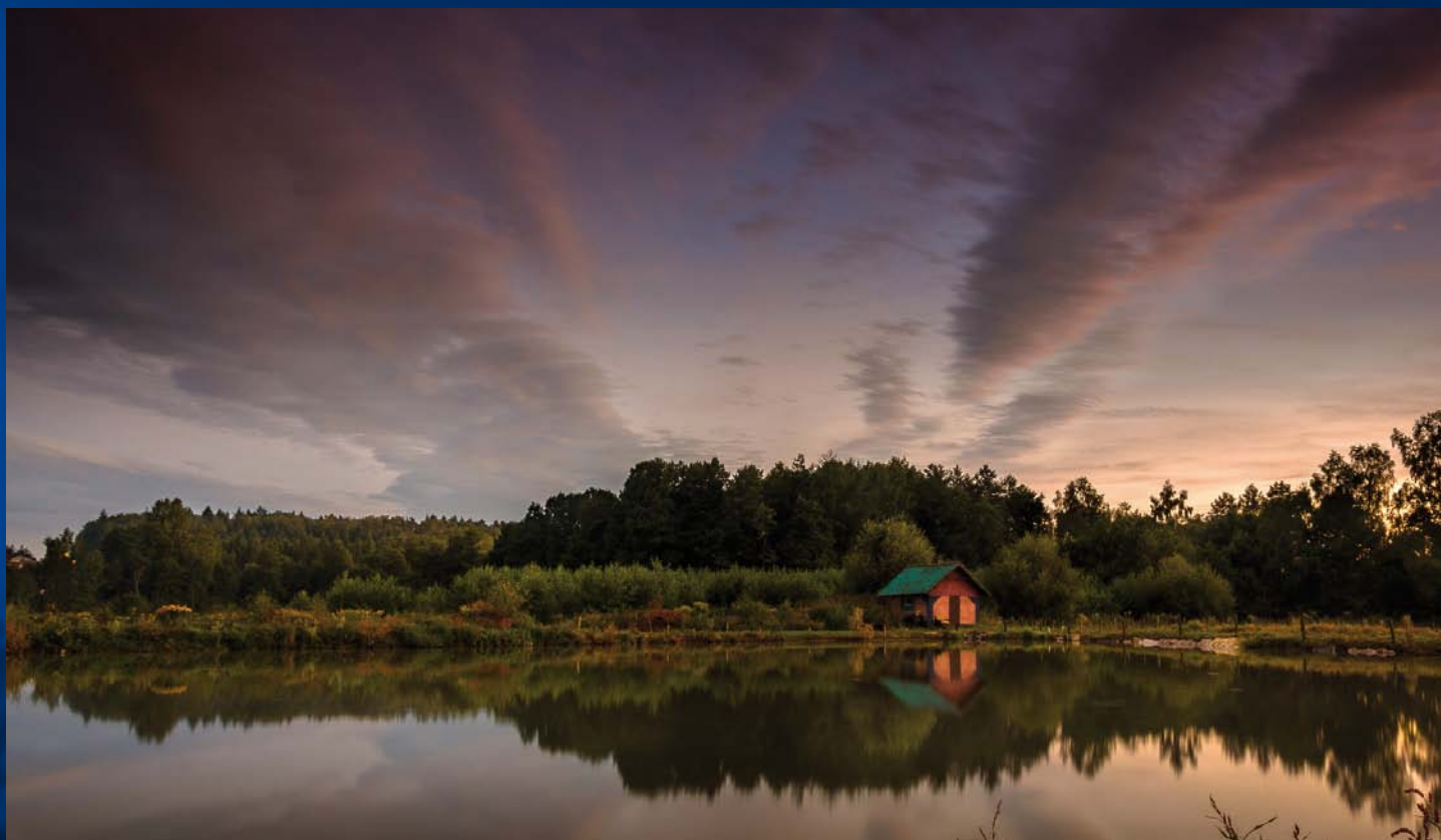
Stawy na Głębocku Rybníky na Głębocku