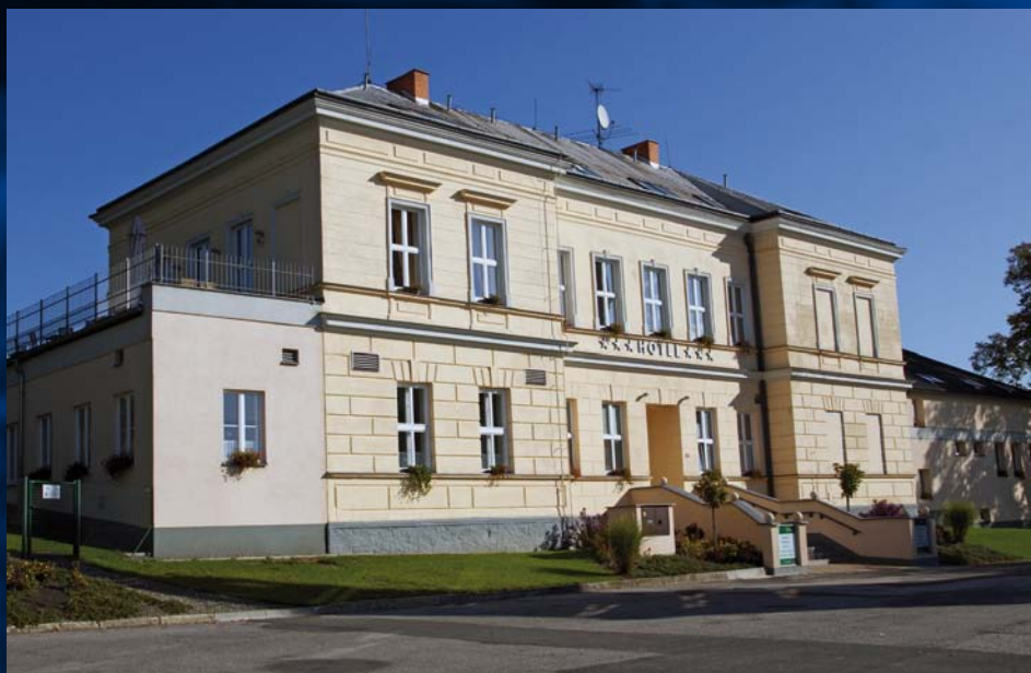
Hotel Dakol w Petrovice u Karvine Hotel Dakol v Petrovicích u Karviné

Publikacje používá text a fotografie účastníků konkursu „Dobrý víkend v víkend v obci Godów a Petrovice u Karviné” realizované v rámci partnerského projektu „společná spolupráce k lepšímu porozumění” spolufinancovaného Evropskou unií v rámci Evropského fondu pro regionální rozvoj - INTERREG V-A Česká republika-Polsko a státního rozpočtu prostřednictvím Euroregionu Těšínsko – Marleny Czyž, Dawida Niemca, Karoliny Niemiec, Adriany Spandel a Mai Skupnik a fotografie Damiana Szewczyka.