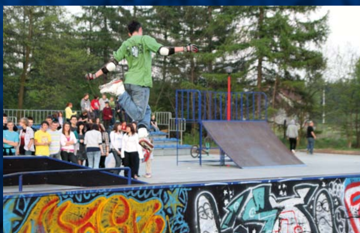
Skatepark w Godowie Skatepark v Godowe