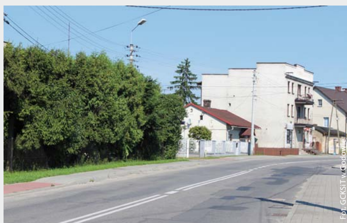
Ulica 1 Maja w Godowie, lipiec 2017 r.