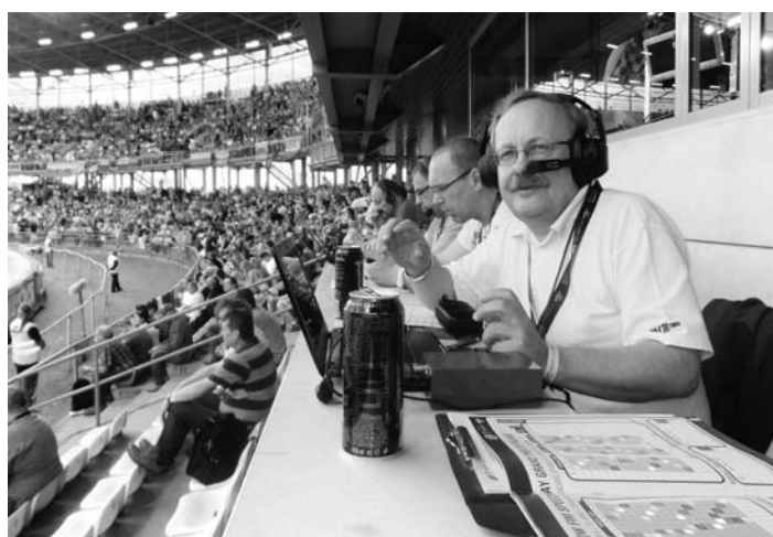
GP Polski na żużlu, Gorzów, 15.06.2013 r.