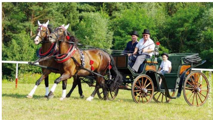
X jubileuszowy Śląski Pokaz Konia