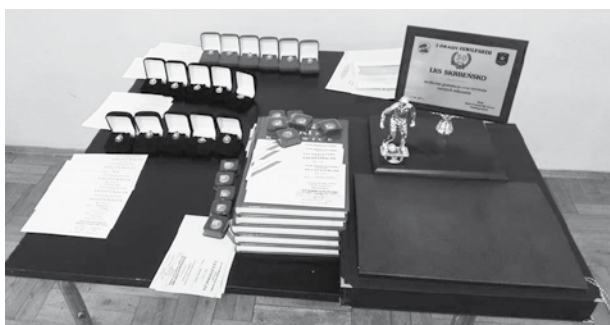
Obchody 30-lecia LKS Skrbeńsko