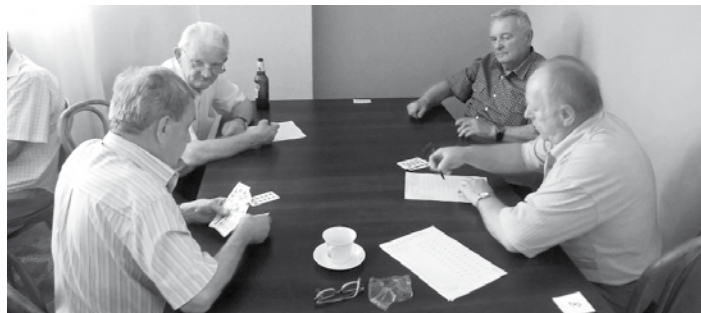
Jubileuszowe rozgrywki skatowe