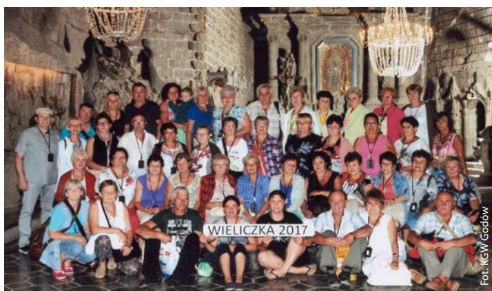
KGW Godów na wycieczce w Wieliczce