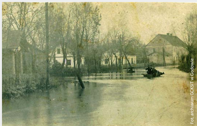
Ul. 1 Maja w Godowie. Powódź w 1930 r.