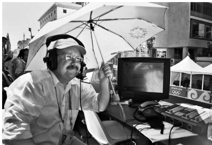
IO Ateny 2004 wyścig kolarski