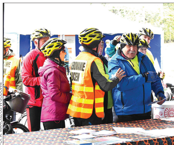
Uczestnicy Festiwalu w punkcie pieczęciowym w Godowie

tym, którzy nie wystraszyli się kapryśnej aury i pokonali trasę Żelaznego Szlaku Rowerowego, zdobywając wszystkie pieczątki. Ci rowerzyści pokazali, że aby dobrze się bawić, najważniej-