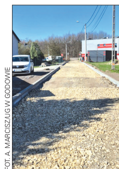
Odcinek ul. Mszańskiej przy skrzyżowaniu z ul. 1 Maja jest nieprzejezdny