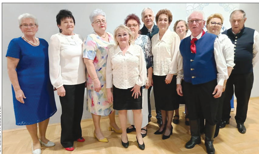
Obecny zarząd Koła Gospodyń z Godowa wraz z członkami zespołu "Ballada"

Wzruszenie wywołał również występ zespołu Ballada, którego historia nierozdzielnie spleta się z działalnością Koła Gospodyń – to właśnie przy KGW zrodził się ten wyjątkowy zespół, od lat promujący folklor i tradycję. Goście składali serdeczne życzenia, gratulacje i wyrazy uznania za lata działalności na