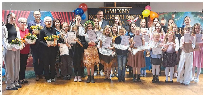
Uczestnicy konkursu wraz z jurorami i organizatorami

Kwota zakupu, po przetargu, wyniosła 423 981 zł brutto. Złożyły się na nią dofinansowanie z PFRON przekazane przez Powiat Wodzisławski - Powiatowe Centrum Pomocy Rodzinie w Wodzisławiu Śląskim, w wysokości 313 425,83 zł oraz środki własne Gminy w wysokości 110 555,17 zł.