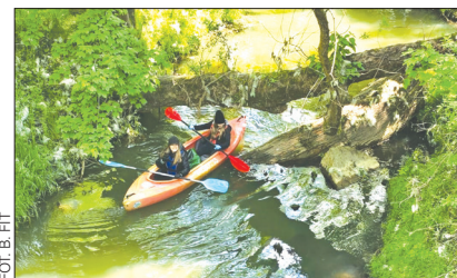
Spływ rozpoczął się niedaleko PSZOK-u w Skrbeńsku, a metę miał przy moście na ul. Celnej w Gołkowicach