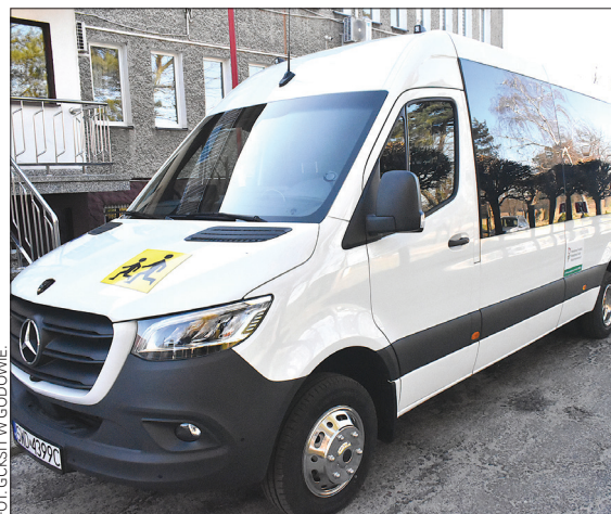
- Autobus został zakupiony dzięki dofinansowaniu uzyskanemu przez Gminę Godów z Państwowego Funduszu Rehabilitacji Osób Niepełnosprawnych (PFRON)