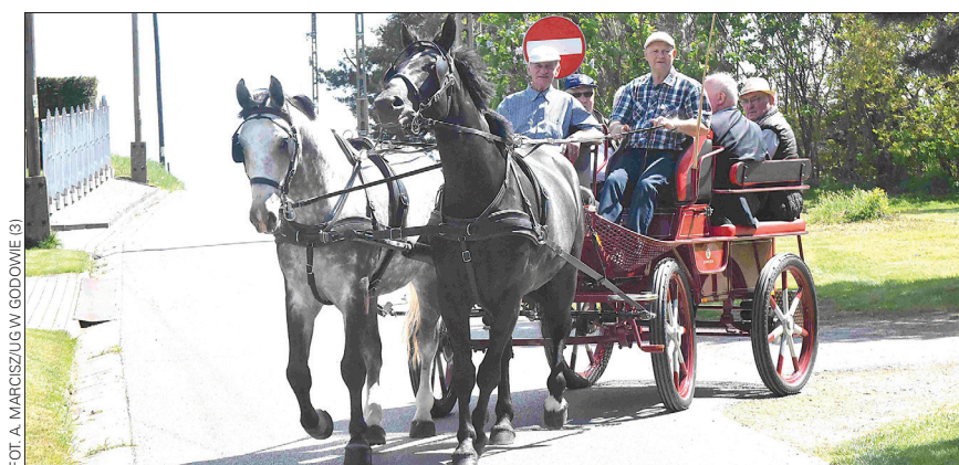
Bryczek wszakże również nie zabrakło