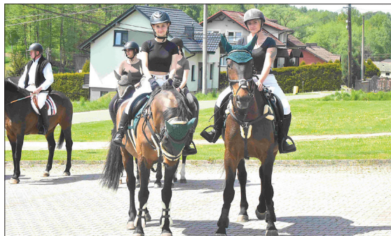
W tym roku większość uczestników procesji stanowili jeźdźcy na koniach