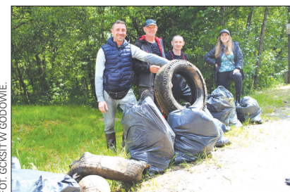
Z Piotrówki udało się wyłowić m.in. stare opony