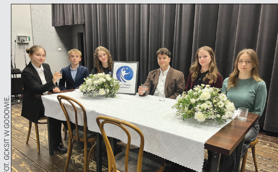
Próba Teatru Naszej Wyobraźni. Gołkowice 2025 r.