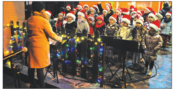
Warsztaty wokalne zorganizowano w ramach programu Inkubator Kultury Miejskiej realizowanego przez Fundację antiRAMA ze środków Ministra Kultury i Dziedzictwa Narodowego.

prac uczestników warsztatów rękodzielniczych, które odbyły się w Ośrodku Kultury w Skrbeńsku. Wydarzenie dofinansowane w ramach projektu „Kultywowanie adwentowych i bożonarodzeniowych tradycji w Gminie Godów” złożonego przez Koło Gospodyń i Gospodarzy Wiejskich „Skrbeńszczanie” sfinansowanego z budżetu samorządu Województwa Śląskiego. A.P.