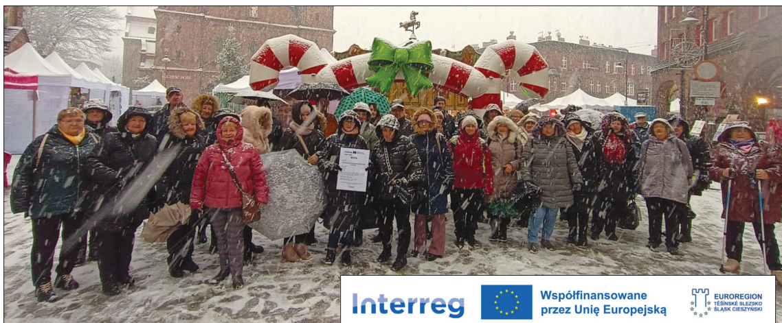
Seniorzy podczas Jarmarku na Nikiszu

Całkowity koszt projektu po polskiej stronie to 7 664 euro. Dofinansowanie wynosi 6 131,20 euro, tj. 80% kosztów kwalifikowanych dla strony polskiej. (a)