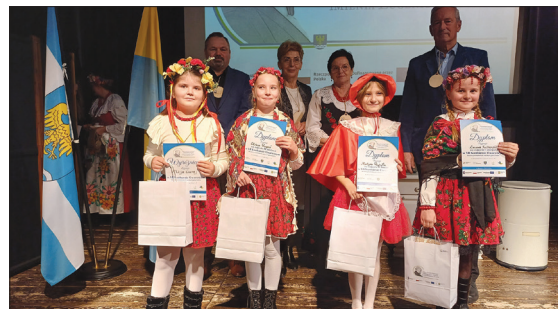
Laureaci w kategorii klas 1-3