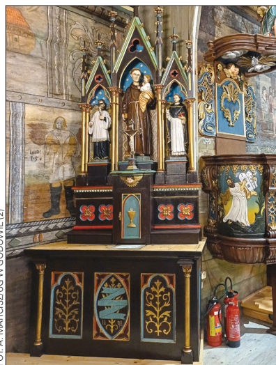
FOT. A. MARCISZUG W GODOWIE (2)

Wiosną zrealizowane zostaną jeszcze prace restauratorskie filaru podtrzymującego strop, których - ze względu na niską obecnie temperatu-