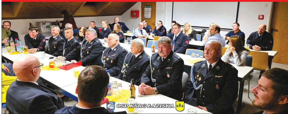
Oficjalne spotkanie strażaków z Łazisk z niemieckimi oficjalami

W dniach 10-13 października, na zaproszenie jednostki partnerskiej z Niemiec, strażacy z OSP Łaziska udali się z rewizytą do strażaków w Freiwillige Feuerwehr Schwanheim e.V..