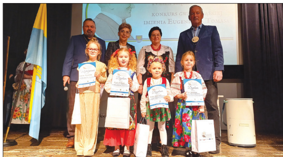
Laureaci w grupie przedszkolaków