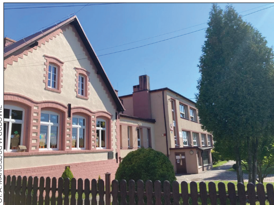
FOT. A. MARCISZUG W GODOWIE

Budowa najstarszej części szkoły podstawowej w Krostoszowicach rozpoczęła się w 1898 r. Trzy lata później w budynku tym rozpoczęła się nauka. W tamtych