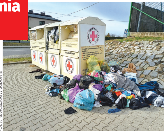
FOT. A. MARCISZUG W GODOWIE

W ostatnim czasie otoczenie większości pojemników na tekstylia wygląda w ten sposób. Nawet jeśli pojemnik zostanie przez PCK opróżniony, to w ciągu zaledwie kilkunastu dni ponownie tworzy się wokół niego śmietnik