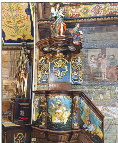
Odrestaurowano również, pochodzącą z pierwszej połowy XVIII w. ambonę

Prace te zostały zrealizowane na zlecenie parafii w Łaziskach, a sfinansowano je dzięki pozyskaniu przez Gminę dla parafii w Łaziskach kwoty 490 tys. zł (i przekazaniu z budżetu gminy kolejnych 10 tys. zł) z Rządowego Programu Odbudowy Zabytków Polski Ład.