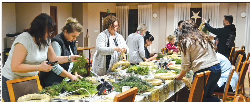
Na warsztatach rękodzielniczych powstały m.in. wieńce bożonarodzeniowe