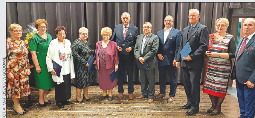
Jubileusz 60-lecia Koła Emerytów, Rencistów i Inwalidów w Gołkowicach, rok 2024