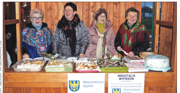
Gospodynie z Gołkowic przygotowały degustację regionalną