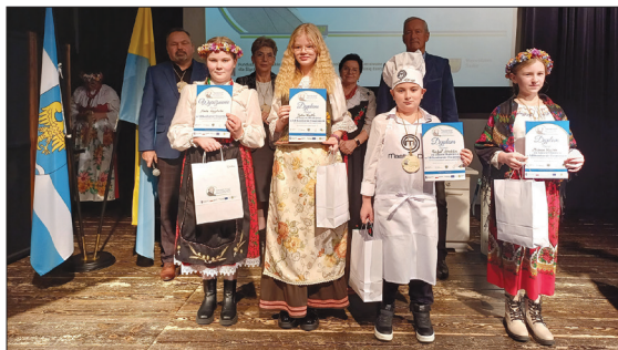
Laureaci w kategorii klas 4-5