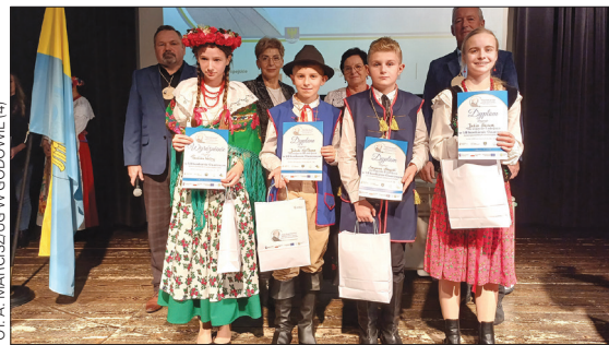
Laureaci w kategorii klas 6-8