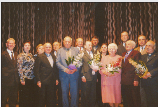
Dzień Seniora Koła Emerytów, Rencistów i Inwalidów w Gołkowicach, rok 2002