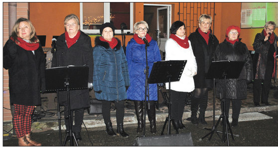
Występ zespołu Spokobabki

Wśród wystawców znaleźli się: Koło Gospodyń Wiejskich z Gołkowic, Przedszkole Publiczne w Gołkowicach, Szkoła Podstawowa w Gołkowicach, Inicjatywa Skrbeńsko oraz lokalni rękodzielnicy.