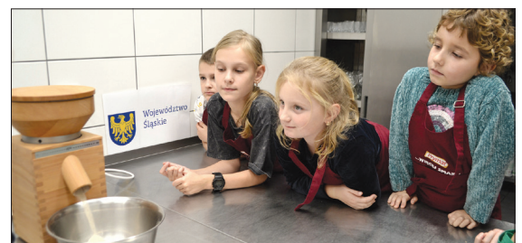
Na warsztatach kulinarnych dzieci miały możliwość wypróbować młynek do zboża

Jarmark na Transgranicznej Strefie Aktywności w Gołkowicach był prawdziwą bajką dzięki