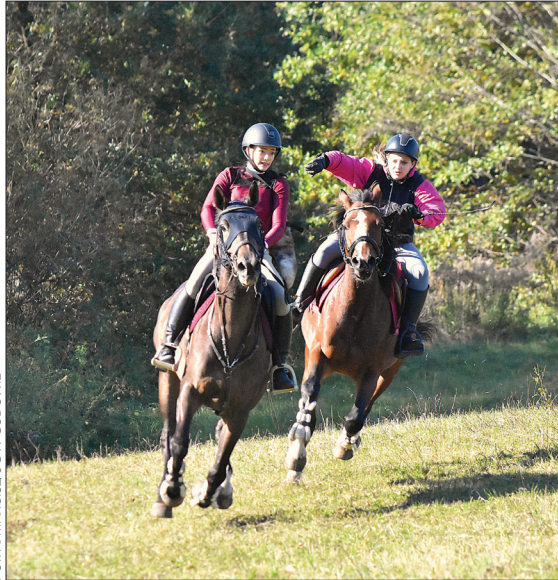
FOT. A. MARCISZUG W GODOWIE

Jak co roku, w drugiej połowie października Stowarzyszenie Hodowców i Miłośników Koni Mustang organizuje Hubertusa, czyli święto myśliwych i jeźdźców. W tym roku odbyło się ono 19 października. Pogoda była świetna, a gonitwy jak zawsze były niezwykle pasjonujące. Przede wszystkim zaś dopisała frekwencja, bo tak wielu koni i bryczek na tym wydarzeniu w Gminie Godów jeszcze nie oglądaliśmy!