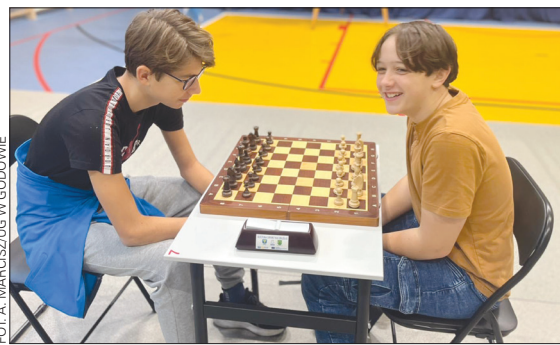
Turniej rozegrano tradycyjnie w murach Zespołu Szkolno-Przedzszkolnego w Skrbeńsku