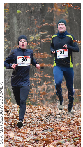
FOT. A. MARCISZUG W GODOWIE (3)

Warto dodać, że na Orliku zameldowali się również uczestnicy rowerowego Rajdu Niepodległości, zorganizowanego przez Koło Turystyki Rowerowej Gminy Godów. Uczestnicy rajdu wyruszyli o godz. 11.00 z boiska Olzy Godów i po drodze przyjechali do Krostoszowic. Rajd zakończyli po przejechaniu około 30 km.