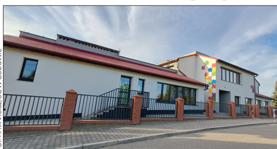
Bajkowe Wzgórze w nowej odsłonie

Łącznie prace termomodernizacyjne kosztowały 656 tys. zł, z czego 500 tys. zł Gmina pozyskała w dwóch odsłonach Marszałkowskiego Programu Poprawy Jakości Powietrza. (a)