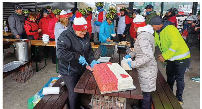
Na każdego uczestnika zmagania czekał biało-czerwony tort

11 listopada przy Orliku w Krostoszowicach oraz w lasach tamtejszej buczyny tradycyjnie na biegowo świętowaliśmy Narodowe Święto Niepodległości.