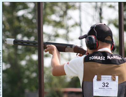
FOT. ARCH. T. MARCOL (2)