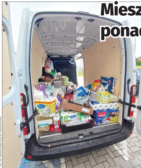
FOT. A. MARCISZUG W GODOWIE

W sumie zebrano ponad 5 ton darów, które samochodami dostawczymi trafiły do Stronia Śląskiego, Głuchołaz i Opola