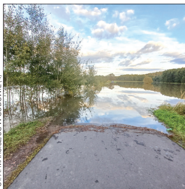
FOT. A. MARCISZUG W GODOWIE (4)