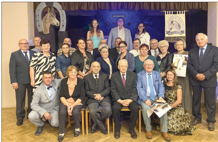
Jubileuszowe obchody odbyły się 5 października

W sobotę 5 października Stowarzyszenie Hodowców i Miłośników Koni "Mustang" świętowało 20. urodziny. Z tej okazji w Ośrodku Kultury w Skrzyszowie odbyła się jubileuszowa uroczystość.