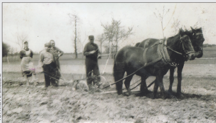
Prace w polu. Skrzyszów, lata 50. XX wieku