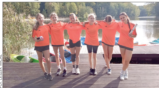
Drużyna dziewcząt reprezentująca SP Skrzyszów w Sztafetowych Biegach Przełajowych

Naszą szkołę reprezentowały 3 zespoły. W kategorii klas V-VI (Igrzyska Dzieci) wystartowała drużyna chłopców