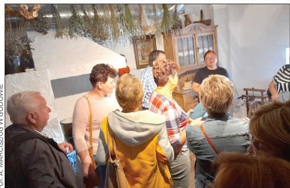
Seniorzy udali się m.in. do Brennej

Integracja seniorów z Gminy Godów i Obec Petrovice u Karvine trwa w najlepsze. 24 września odbyli wspólną wycieczkę autokarową m.in. po Beskidzie Śląskim.