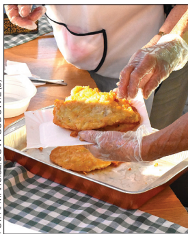
Placki ziemniaczane cieszyły się ogromnym zainteresowaniem