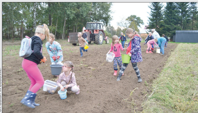
Wykopki Szkoły Tradycji. Skrbeńsko, rok 2024