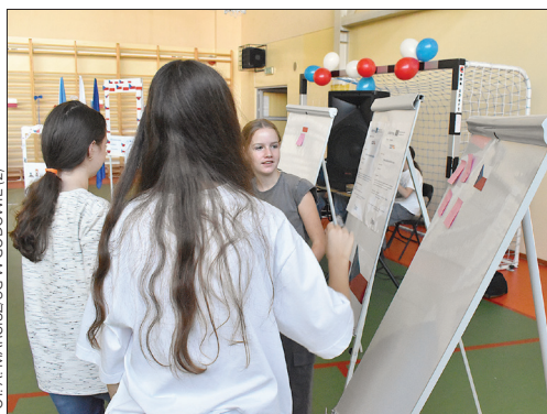
FOT. A. MARCISZUG W GODOWIE (2)

Warto zaznaczyć, że projekt obejmuje prawie 170 dzieci z Polski i Czech w wieku od 11 do 14 lat. Jego głównym celem jest wzmocnienie