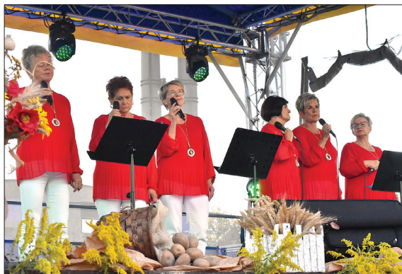
Na scenie nie mogło zabraknąć Spokobabek