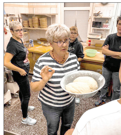
Warsztaty z pieczenia śląskiego kocioca

W ubiegłym roku w Skrzeńsku przyjmowaliśmy specjalnych Gości. W ramach partnerskiej współpracy z Inicjatywą Skrzeńsko do naszej gminy przyjechało zaprzyjaźnione stowarzyszenie z niemieckiego Eibau. W tym roku przyszedł czas na rewizytę. W dniach 27-30 września członkowie Inicjatywy ze Skrzeńska odwiedzali swoich przyjaciół w Niemczech.