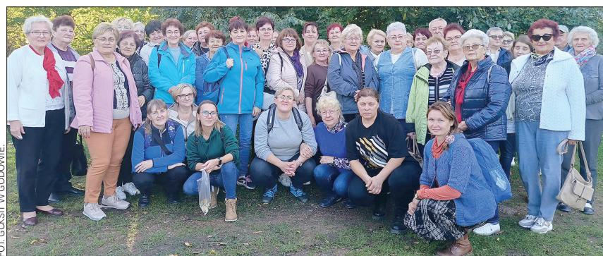
Koło Gospodyń Wiejskich z Godowa wzięło udział w wycieczce do Bielska-Białej. Program wycieczki obejmował zwiedzanie Zamku Książat Sułkowskich. Za sprawą pięknej pogody widoki ze Schronisko PTTK Szyndzielnia zapierały dech w piersiach!