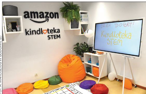
Kindloteka w GBP w Godowie