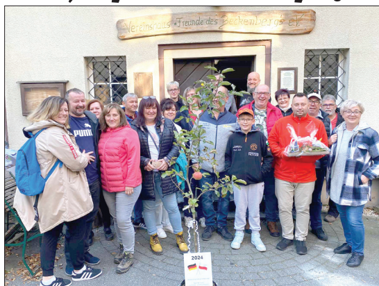
Inicjatywa przywiozła z Eibau prezent - sadzonkę jabłoni na znak niemiecko-polskiej przyjaźni