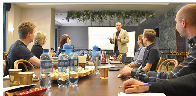
Szkolenie odbyło się w Ośrodku Kultury w Gołkowicach