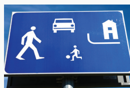
Wjeżdżając w strefę zamieszkania kierowcy często zapominają o obowiązujących w niej przepisach ruchu drogowego

- W strefie zamieszkania dopuszczalne jest kierowanie hulajnogą elektryczną lub urządzeniem transportu osobistego (deskorolka elektryczna, elektryczne urządzenie samopoziomujące) przez dziecko w wieku do 10 lat wyłącznie pod opieką osoby dorosłej.