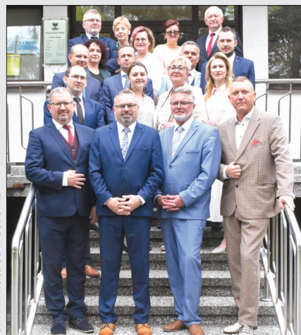
Rada Gminy (kadencja 2024-2029)