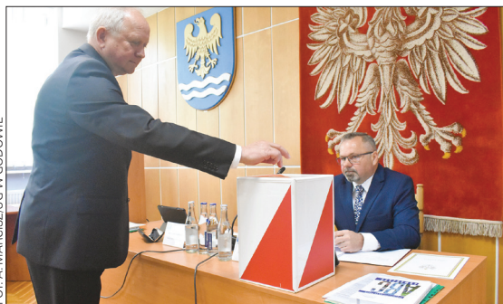
FOT. A. MARCISZUG W GODOWIE

- Dziękuję moim wyborcom, bo dzięki nim tutaj dziś jestem. Myślę, że nie zawiodę Waszego zaufania i chcę Was godnie reprezentować w radzie gminy. Dziękuję radnym za to, że mogę w tym miejscu stać, dziękuję za ogromny kredyt zaufania, jakim jest obdarzenie mnie funkcją przewodniczącego rady gminy. Jestem gotowy poświęcać swój czas, by godnie reprezentować Was w gminie i poza nią,