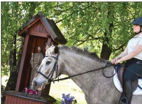
Przy kapliczce Św. Józefa w Krostoszowicach

W tym roku pogoda szczególnie dopisała, frekwencja wśród miłośników koni również. Spod kościoła w Krostoszowicach procesja