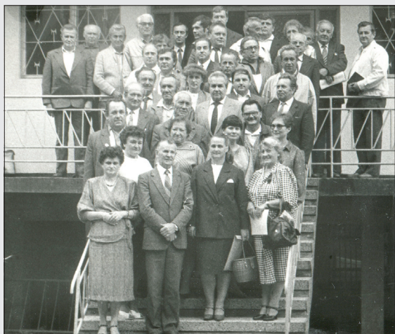
Gminna Rada Narodowa, rok 1990