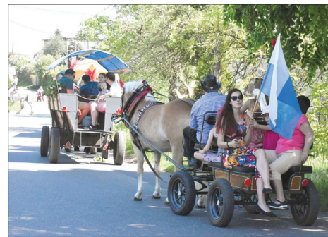
Na ulicach Skrzyszowa

Procesja, w której udział wzięli m.in. Wójt