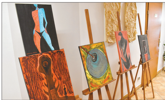
Artysta stosuje różne style malarskie

Gorąco zachęcamy, bo obrazy Szymona Grębosza, namalowane różnymi stylami, są niezwykle ciekawe, odzwierciedlają jego wizje, obserwacje i marzenia. (a)