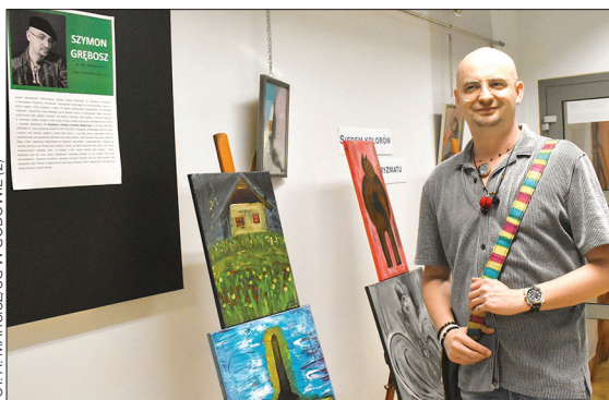
Obrazy Szymona Grębosza można oglądać w siedzibie Gminnej Biblioteki Publicznej w Godowie