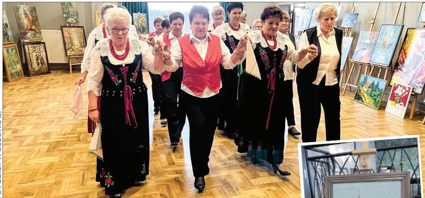
FOT. GOKSIT W GODOWIE (2)

Wernisaż wystawy otworzył polonez w wykonaniu gospodyń z Gołkowic i Petrovic