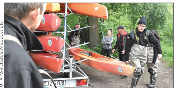
FOT. A. MARCISZUG W GODOWIE (3)

W kilkunastu workach zebrano około 150 kg odpadów