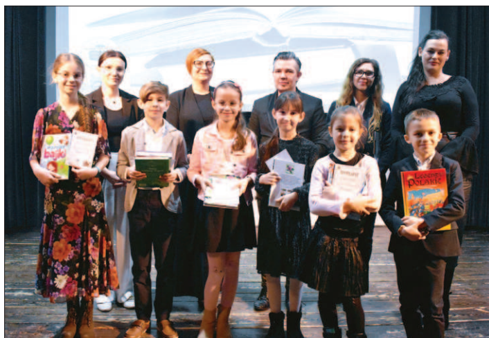
Laureaci oraz wyróżnieni w kategorii klas I-III