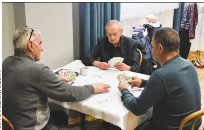
Klub Skata z Gołkowic

W organizację Żywej Lekcji Regionalizmu, obok głównego organizatora - którym było Gminne Centrum Kultury, Sportu i Turystyki w Godowie - zaangażowało się wiele organizacji i osób. Były to Koło Gospodyń Wiejskich Gołkowice, Jastrzębskie Stowarzyszenie Eksploracyjne „Szpon”, OSP Gołkowice, Klub Skata Gołkowice, Szkoła Podstawowa im. por. pil. Franciszka Surmy w Gołkowicach, Przedszkole Publiczne im. Przyjaciół Kubusia Puchatka w Gołkowicach, Gospodarstwo Rolne Adapto, Szkoła Tradycji