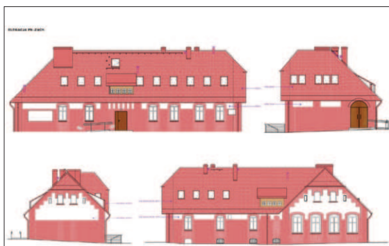
Wizualizacje ukazujące jak obiekt będzie wyglądał po przebudowie

że mieszkańcy Skrzyszowa przyzwyczaili się do tego, że w obiekcie jest punkt handlowy. Dlatego po ukończonym remoncie nadal możliwe będzie tu prowadzenie handlu i usług – podkreśla Wójt Adamczyk.