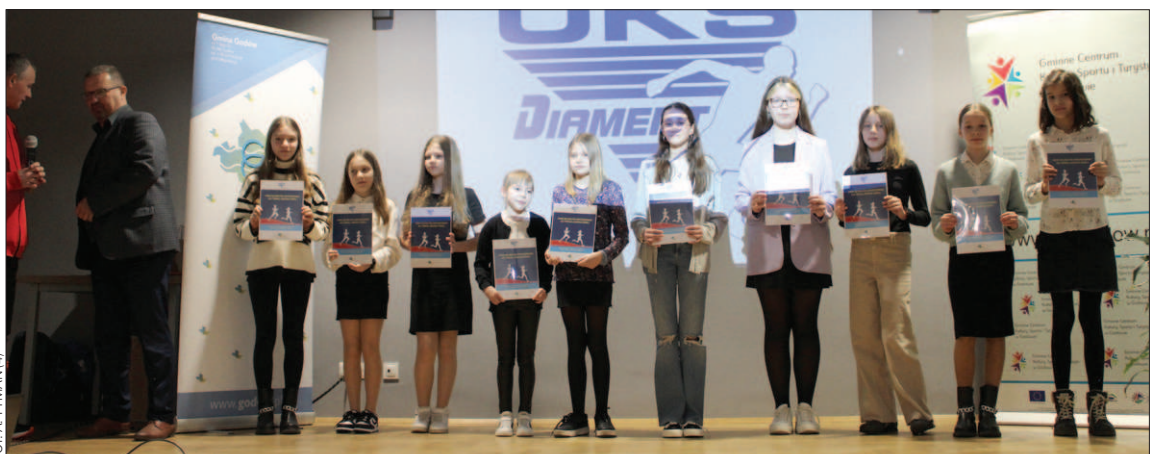
Do klubu dołączyło dziesięciu nowych zawodników