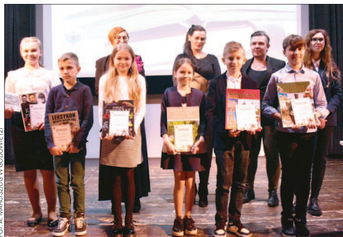
Laureaci i wyróżnieni w kategorii klas IV-VI