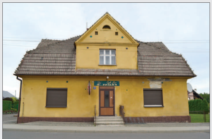
Nieużywany obecnie budynek Cafe Baru Relaks