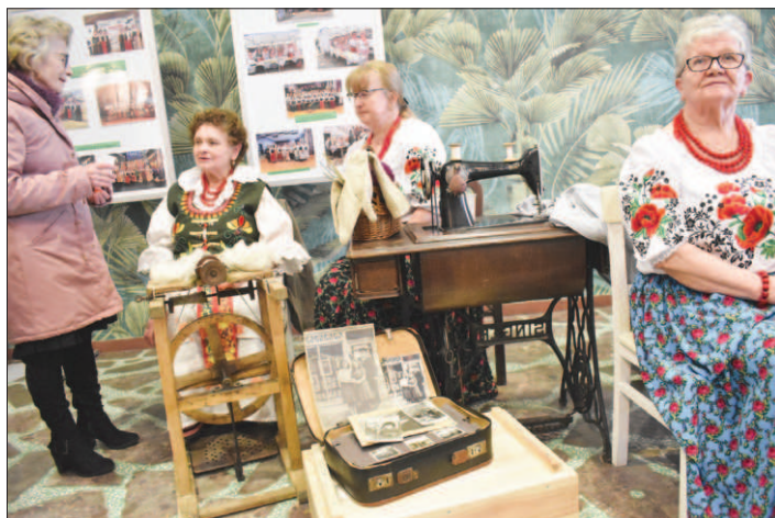
W Ośrodku Kultury można było zobaczyć m.in. dawne sprzęty

W niedzielę 10 marca w Ośrodku Kultury w Gołkowicach odbyła się Żywa lekcja regionalizmu „Drugi Raz na ludowo”. Można było nie tylko zapoznać się z dawnymi tradycjami, ale też je posmakować i nauczyć się, jak o nie dbać, by nie zaginęły. Dodatkową atrakcją była wystawa historycznych militariów oraz prezentacja filmu poświęconego Gołkowicom.