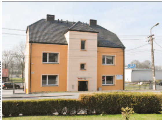
Do budynku byłego ośrodka zdrowia w Godowie zostały przeniesione trzy referaty

Godziny urzędowania oraz numery telefonów pozostają bez zmian. Urząd jest czynny w poniedziałki od godz. 7.00 do godz. 17.00, od wtorku do czwartku od godz. 7.00 do godz. 15.00 i w piątki od godz. 7.00 do godz. 13.00.