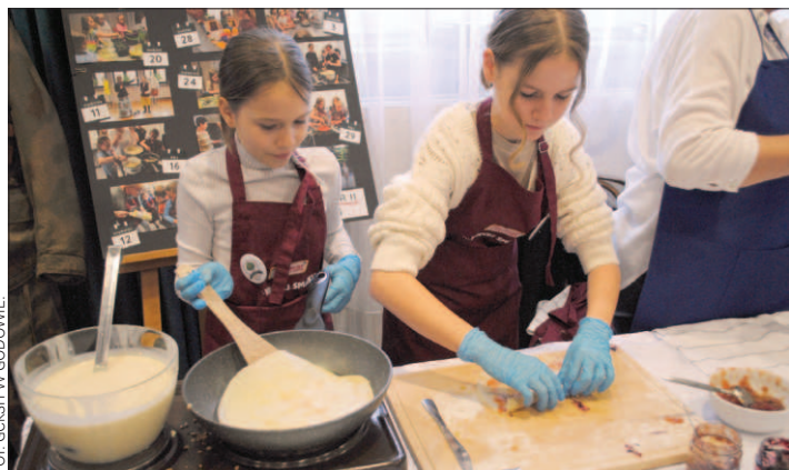
Wśród wystawców była również Szkoła Tradycji ze Skrbeńska oraz KGiGW „Skrbeńszczanie”