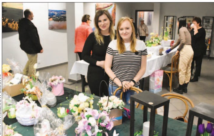
Swoje stoisko przygotowało m.in. Przedszkole Publiczne w Gołkowicach