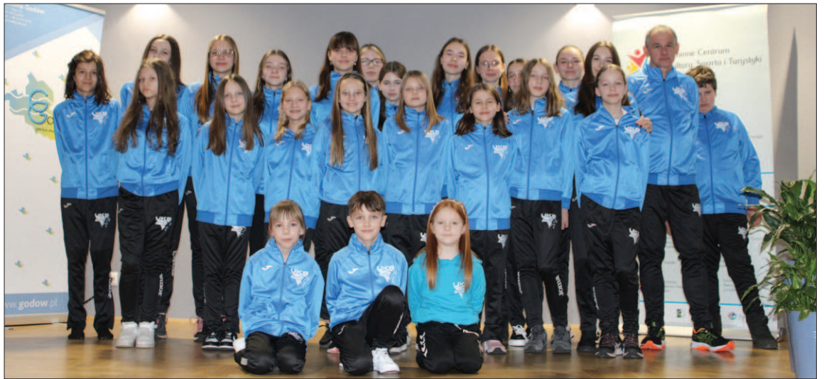
Kadra UKS „Diament” Godów