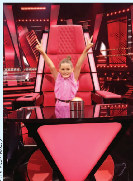
FOT. A. PTASZYŃSKA (2)

W przyszłości chciałabym: zostać piosenkarką, zagrać w musicalu oraz zaśpiewać z małym TGD