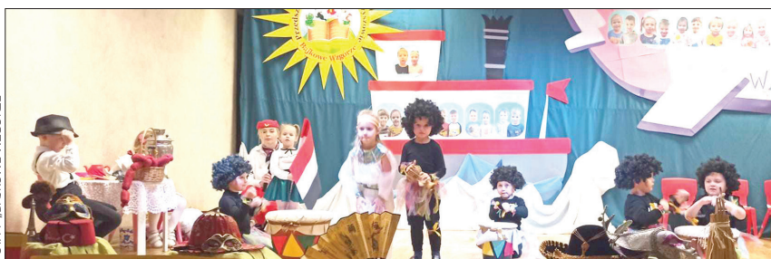
FOT. PP „BAJKOWE WZGÓRZE”

W piątek scena należała już do starszaków. Wychowankowie z grup „Żabki” i „Gumisie” zabrali swoje babcie i swoich dziadków do przeszłości prezentując przedstawie-