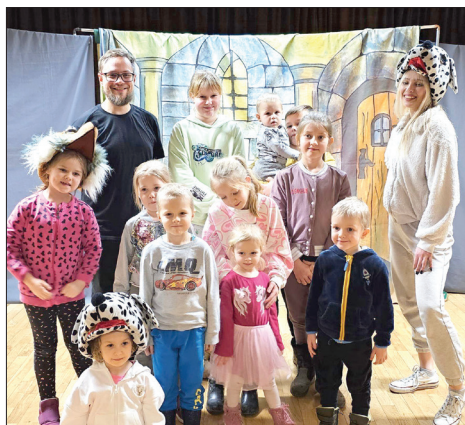
Przedstawienie „Księż i żebrak” w Ośrodku Kultury w Skrzyszowie