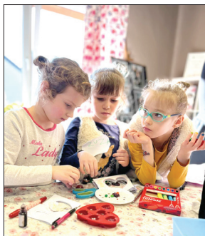
Mydlane warsztaty w Świątlicy w Podbuczu