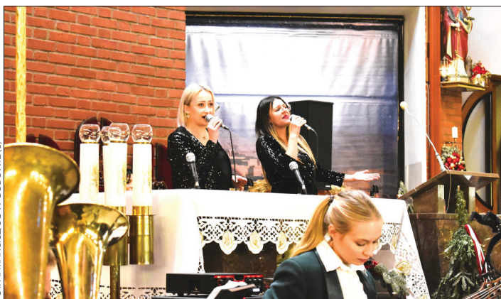
Orkiestrze towarzyszyły solistki