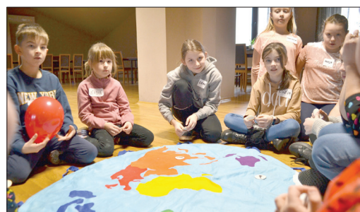
Gry i zabawy w Ośrodku Kultury w Skrzebieszów