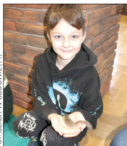
Spotkanie z ssakami przydomowymi w Ośrodku Kultury w Godowie