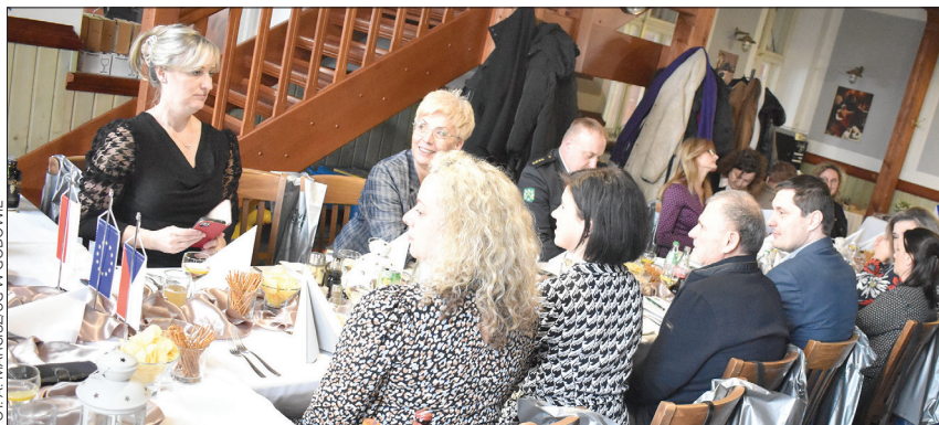
Delegacje obu partnerskich gmin przedstawiły zaplanowane na ten rok wspólne działania