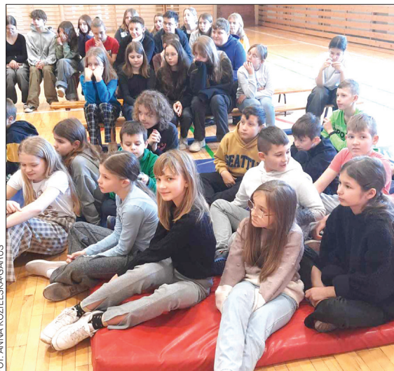
FOT. ANNA KOZIELSKA-GARUS