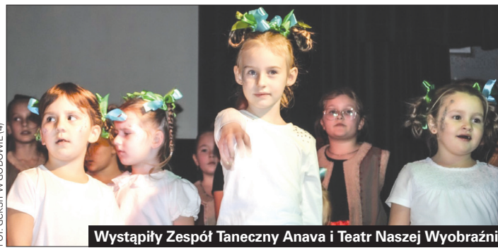
Wystąpiły Zespół Taneczny Anava i Teatr Naszej Wyobraźni