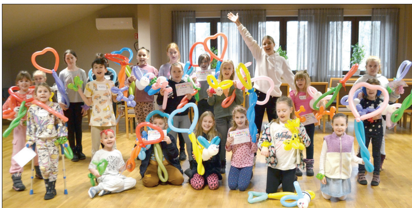
Balonowa sztuka skręcania w Ośrodku Kultury w Skrzebieszów