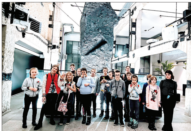
Wycieczka do Carbonarium