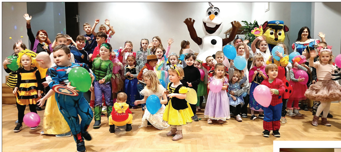
Bał przebierańców w Ośrodku Kultury w Godowie