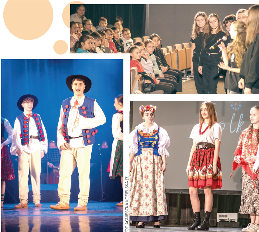
FOT. AGNIESZKA KOZIELSKA (3)