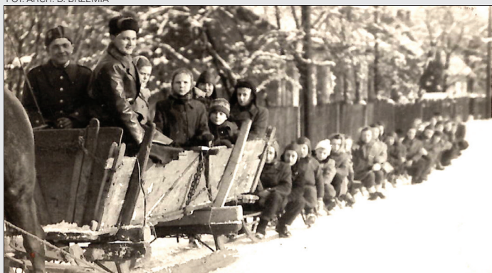
Kulig szkolny w Skrzyszowie, ok. roku 1955