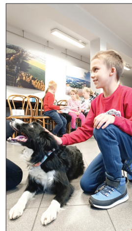
Wy nie wiecie, a ja wiem, jak rozmawiać trzeba z psem - warsztaty edukacyjne w Ośrodku Kultury w Gólkowicach