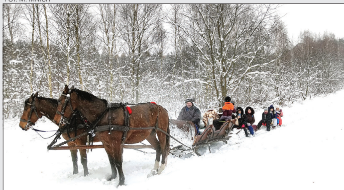
Kulig SHiMK „Mustang” w Godowie, rok 2023