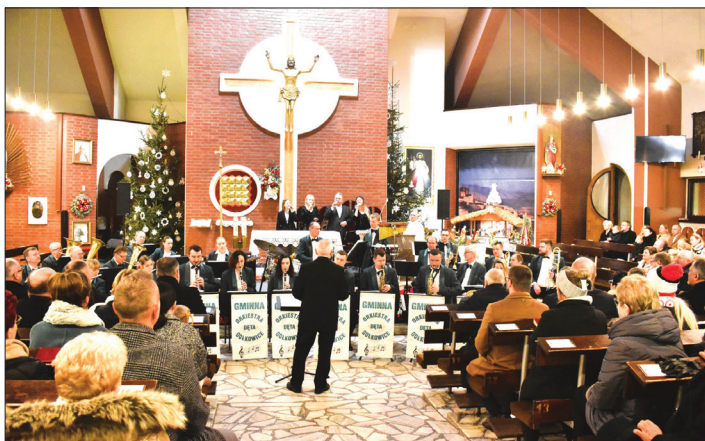
Koncert tradycyjnie odbył się w kościele Podwyższenia Krzyża Świętego w Gołkowicach