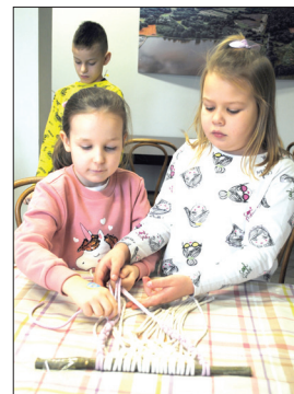
Sznurkiem wypłatane - warsztaty makramy w Ośrodku Kultury w Gólkowicach