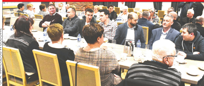
W spotkaniu wzięli udział przedstawiciele kilkunastu organizacji społecznych z terenu gminy