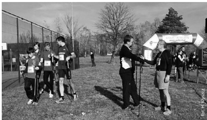
Święto Niepodległości uczczono na sportowo

W Gminie Godów Narodowe Święto Niepodległości uczczono na sportowo. 11 listopada o godzinie 11:00 ponad stu miłośników marszerowania z kijkami wyruszyło na 4,5 kilometrową trasę, prowadzącą przez malownicze, leśne tereny Krostoszwic. Oprócz mieszkańców gminy bardzo licznie stawili się zawodnicy z gmin sąsiednich, a także zawodnicy z klubów sportowych z Jastrzębia-Zdroju, Rybnika, Żor, Skoczowa, Lublińca, Bielska-Białej, Gliwic. Większość uczestników zaliczyła dwa okrążenia. Pokonany przez nich dystans okazał się całkiem spory, zwłaszcza że przygotowana przez organizatorów trasa nie należała do najłatwiejszych. Na zakończenie sportowych zmagania dla wszystkich uczestników przygotowano pamiątkowe medale oraz ciepły posiłek i napoje. Klasyfikację biegu podzielono na kategorie kobiet i mężczyzn oraz dodatkowo na przedział wiekowy uczestników. Zwycięzcy poszczególnych kategorii z rąk Wójta Gminy Godów oraz Prezesa Klubu Sportowego INTER Krostoszwice otrzymali pamiątkowe puchary.