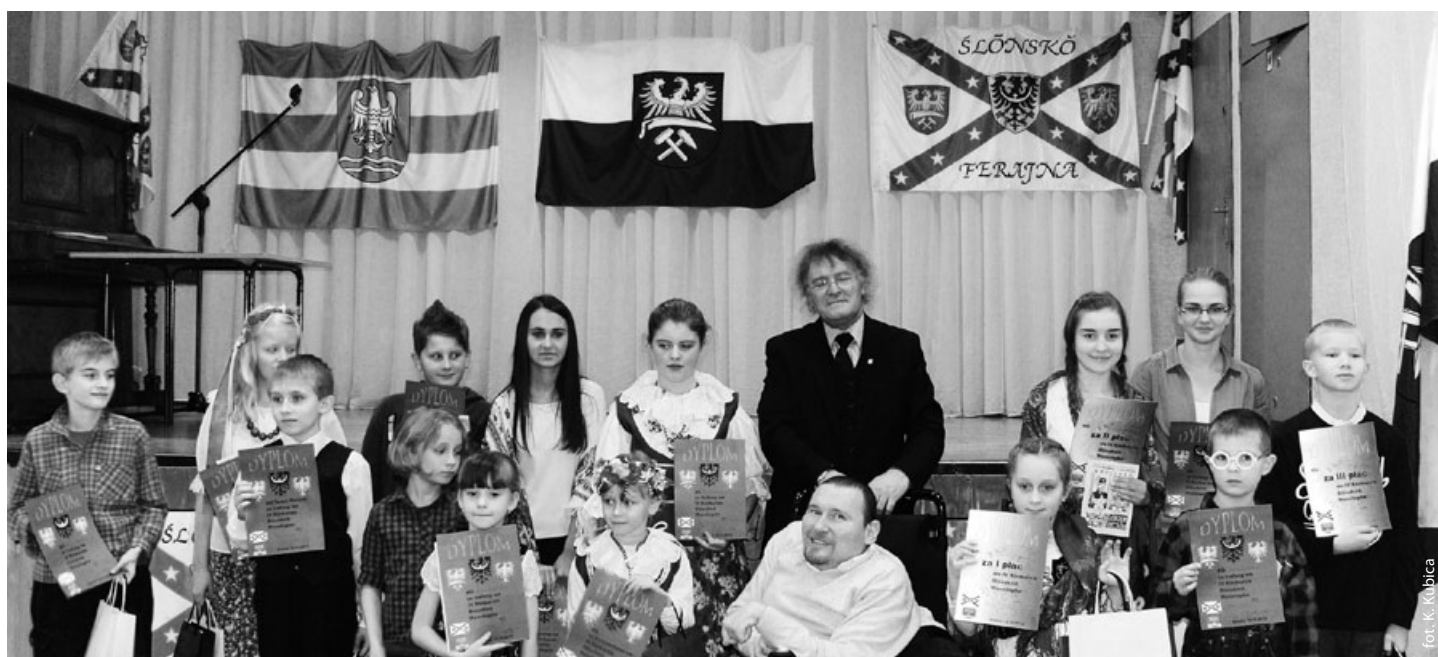
Nagrodzeni uczestnicy konkursu z Posłami