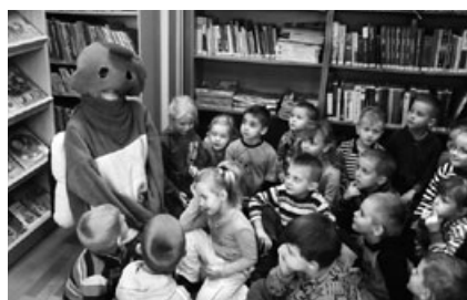
Z wizytą w bibliotece w Skrzyszowie

Zanim zima w pełni nastanie, zrobimy jesiennie podsumowanie. Wiele w naszym przedszkolu się działo, zabaw i śmiechu nie brakowało. We wrześniu jarzyny u nas królowały, dzieci z ziemniakiem konkurencję miały, zaś z rudą marchewką pięknie tańcowały. W październiku uroczystość była nie byle jaka, bo Pasowanie na Przedszkolaka. Z bajek postaci wyskoczyły i wspólnie wszystkie się bawiły. Zabki tańczyły z Krasnolami, a Gumisie zaś z Kotkami. Smerfy uważnie się przyglądały, bo po raz pierwszy w naszym przedszkolu witały. W listopadzie pomimo, że niebo zakryły chmury, dzień dla dzieci nie był ponury, gdyż bibliotekę odwiedzili i mnóstwo książek zobaczyli. Razem z Franklinem podróżowali i wszystko dokładnie zobaczyć chcieli. To jeszcze nie koniec tych uroczystości, gdyż Miś Pluszowy u nas zagościł, 4. urodziny z nami świętował i wszystkie dzieci tortem częstował. W ostatni dzień listopada wróżyć nam wypada. Andrzejkowe wróżby kryją wielką moc, każde dziecko łatwo przez dziurkę od klucza wosk. Odpowiedzi na pytania i marzenia znamy, ale na wyniki jeszcze poczekamy. O tradycjach górniczych dzieci się dowiedziały, kiedy z górnikami w przedszkolu spotkanie miały. A odważne sześciolatki ciemności się nie bały i kąpielnię „Guido” w Zabrze z ciekawością zwiędzały. Wrażenia z wycieczki były ogromne, a opowieści dzieci... o tym już nie wspomnę!