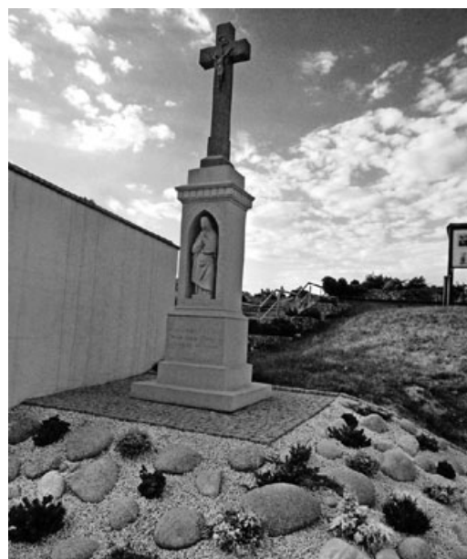
Gdzie znajduje się ten krzyż i jaką niesie historię?