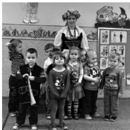
Grupa Pszczółek, czyli 3-latki z tancerką Zespołu Pieśni i Tańca „Vladislavia”