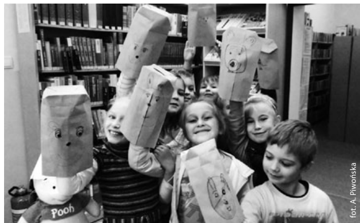
Czyj Miś jest najładniejszy?