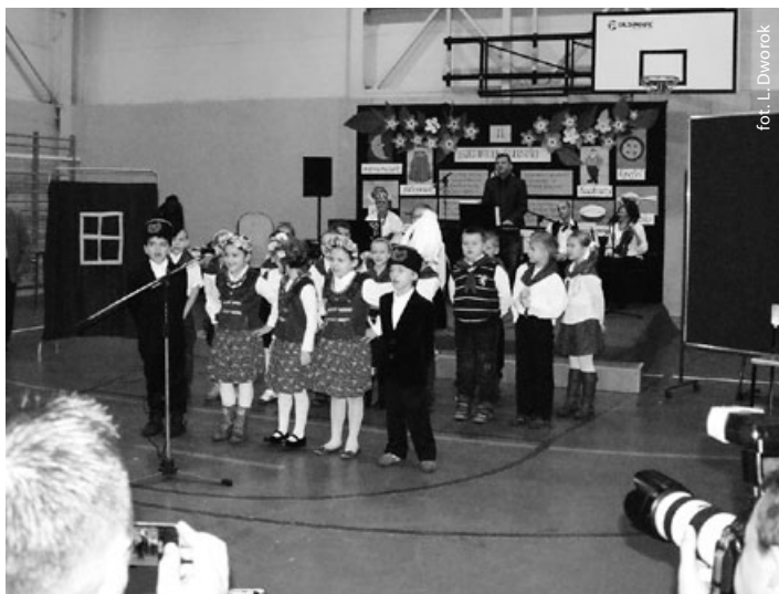
Uczniowie SP na II Biesiadzie Śląskiej