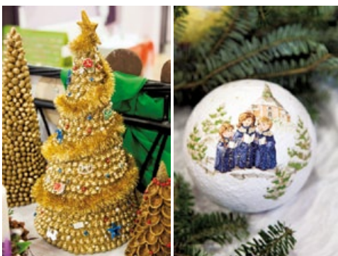
Jedne z wielu ozdób świątecznych na wystawie