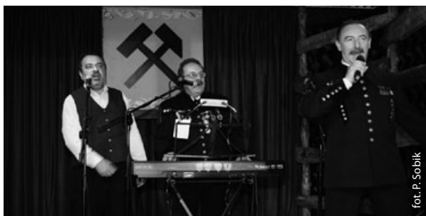
ToNieMy w całej krasie