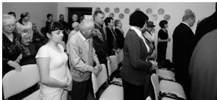
Msza św. w nowo poświęconej kaplicy