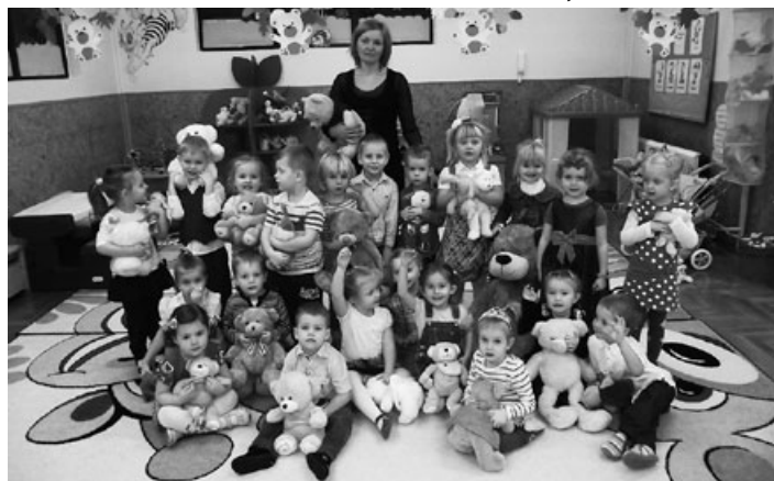
Urodziny Misia w Bajkowym Wzgórzu