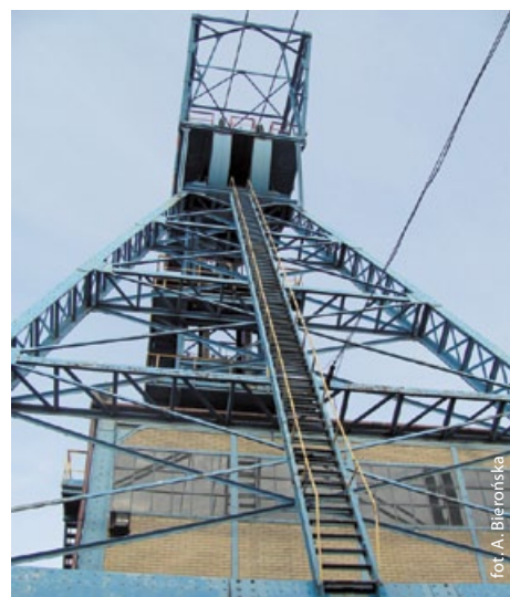
Wieża szybowa kopalni „Guido”