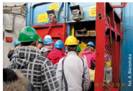
W wejście do windy kopalnianej