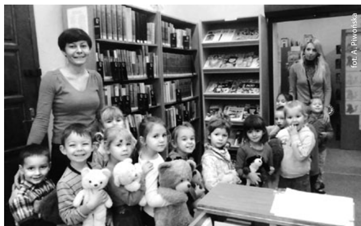
Miś też lubi książki