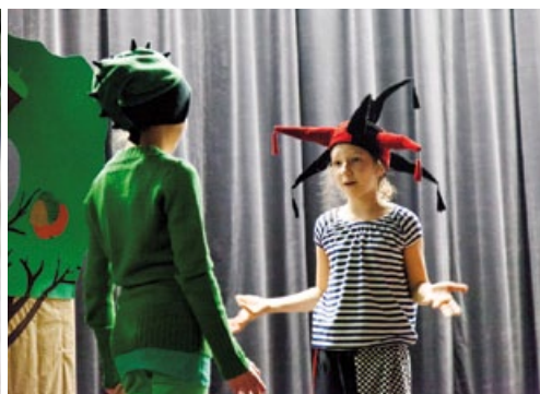
Rozmowa młodego Smoka z Gnomem