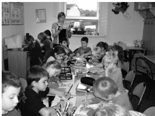
Popołudnie z książką