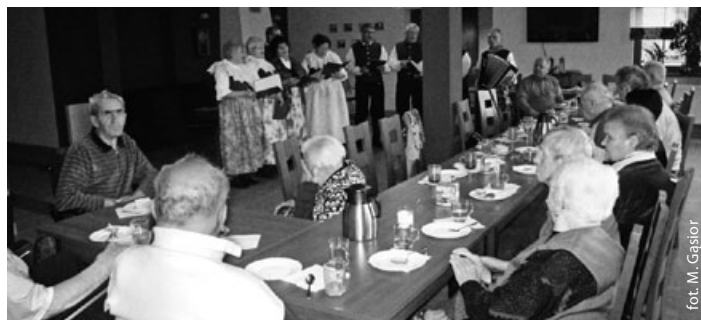
Dzień Seniora w DS Gwarek