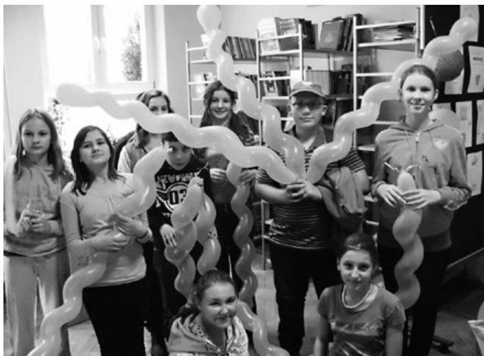
Wizyta w GBP w Godowie

O tym, że nauka to nie tylko żmudne siedzenie w ławkach, słuchanie nauczyciela i wykonywanie ćwiczeń, przekonani są uczniowie Zespołu Szkolno – Przedszkolnego w Godowie, którzy w tym roku szkolnym uczestniczyli już w wielu niecodziennych lekcjach i spotkaniach z ciekawymi ludźmi. Tym samym pogłębili swoją wiedzę ze środowiskiem lokalnym, z jego tradycjami i historią. Poszerzyli swoją wiedzę i uświadomili sobie, jak wiedza zdobywana na różnych przedmiotach